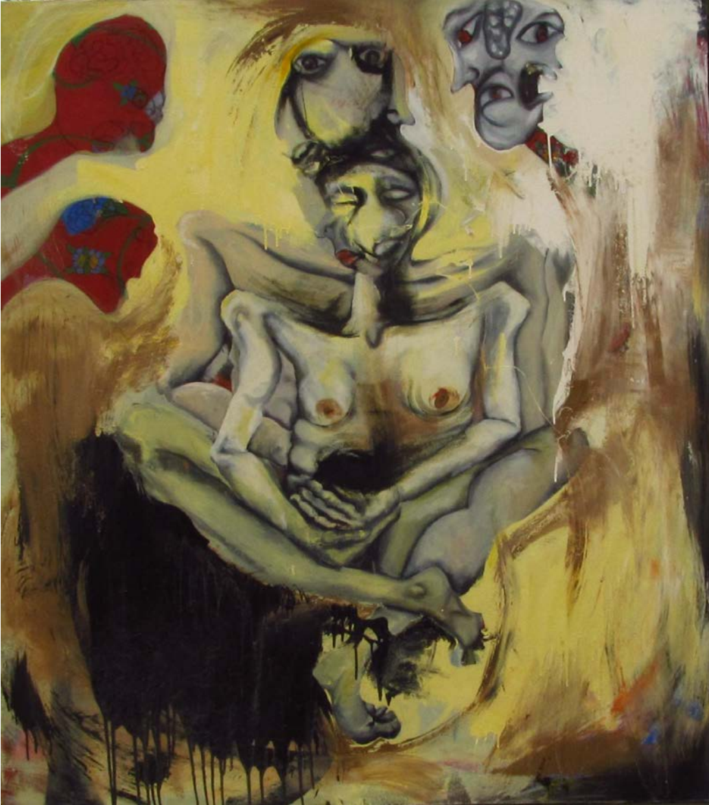
Resim 12: Amineh Ahmadi, “ Döllenme Gazabı ”, tuval üzerine yağlıboya, 170 x 150 cm,