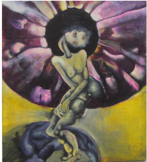
Resim 20: Amineh Ahmadi, “Anima”, tuval üzerine yağlı boya, 150 x 170 cm, 2014.