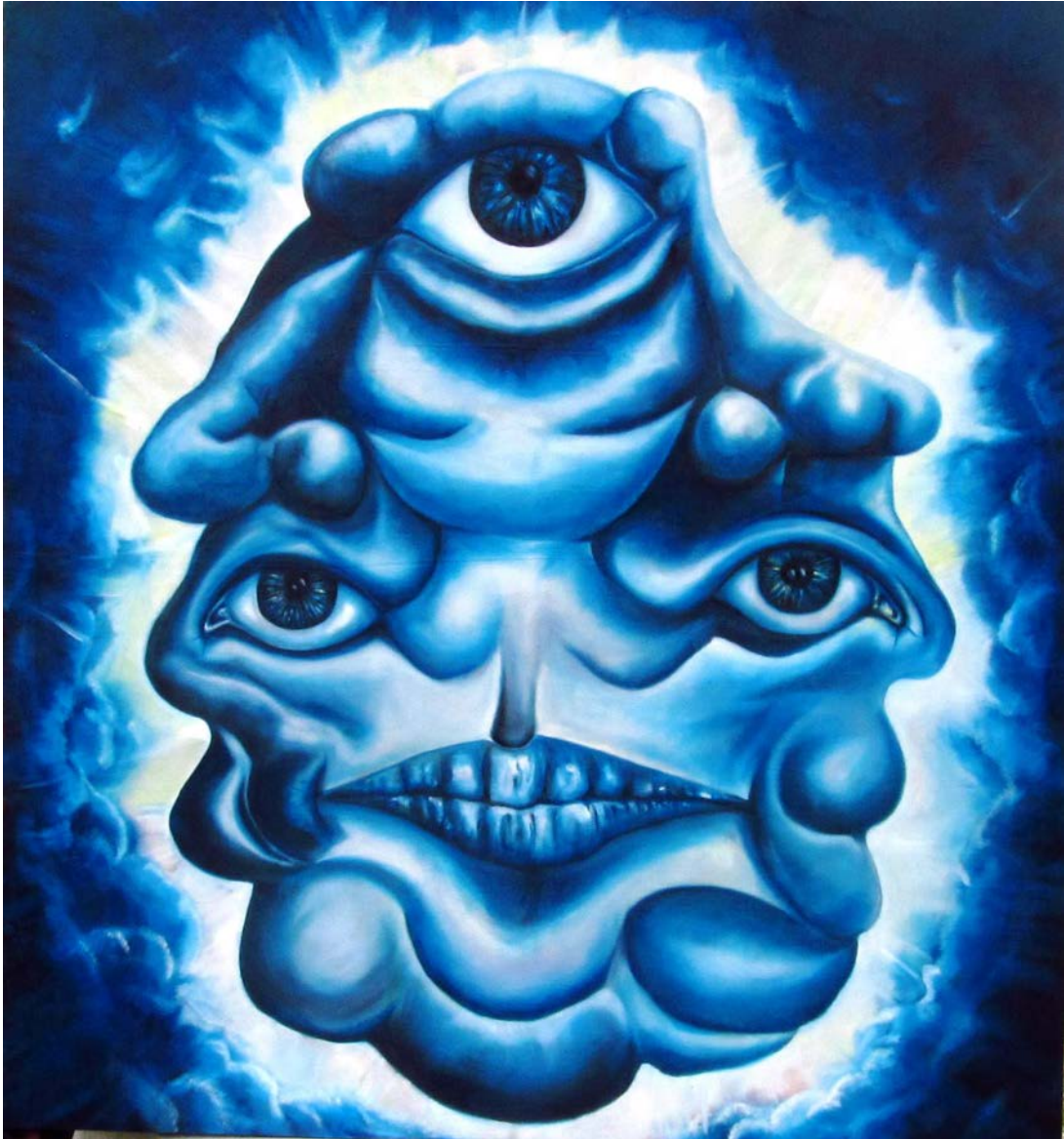
Resim 25: Amineh Ahmadi, “Mavi Ay”, tuval üzerinde yağlı boya, 214 x 200 cm, 2015.

Resimlerimde mavi renginin tonlarının kullanılışı semboliktir. Derinlik ve evreni anımsatan mavi, denizlerin ve gökyüzünün rengidir. Çalışmalarımda mavi, insanın bütünleşme isteğine işaret eder. Sağ taraftaki siyah yuvarlak, genel olarak körleşmiş insanın gözünü temsil eder. Ama bu resimdeki siyah leke, Resim 3 ve Resim 19'dakilere göre daha küçüktür ve tekrar düş dünyasına açılan gözü çağrıştırmaktadır.