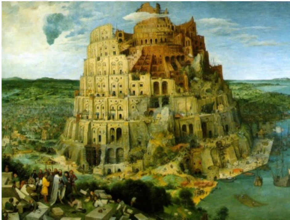
Resim 3: Pieter Bruegel, “ Babil Kulesi ”, panel üzerinde yağlı boya, 114 x 155 cm, 1563. 2

Rab indi. Onlar bir kavim, hepsinin tek dili var. Gelin inelim, birbirlerinin dilini anlamasınlar diye onların dilini karıştıralım. Rab onları oradan dağıttı ve şehri bina etmeyi bıraktılar” (Sedes, 2013, s. 9). Ünlü din tarihçisi Mircea Eliade’nin soterioloji teorisine göre her kültür kendine has evren eksenini (axis mundi) yaratır. Bu eksen gökyüzünden yeraltına kadar devam eden sembolik bir çizgidir. Eliade’nin sembolik sistemlere dair yorumuna göre bu hayali çizgi, göğü (tanrı/cennet) yer (insan) ve yeraltına (cehennem/şeytana) bağlar. Dağ (ziggurat) şeklinde olduğu düşünülen Babil Kulesi’nin hikayesini Eliade’nin teorisi ışığında okuduğumuzda, insanın açgözlülüğünden dolayı sembolik evren ekseninin radikal bir şekilde altüst olduğunu görebiliriz. Babil sözcüğü Akad dilinde tanrının kapısı anlamına gelir. Mitolojide insan ile tanrının yarışı her zaman göksel güçlerin çok daha güçlü olduğunu göstermektedir. Bu hikayeye daha farklı bir açıdan baktığımızda, insanın transandantal isteğiyle tanrısal bir güce sahip olma hevesini okuyabiliriz.