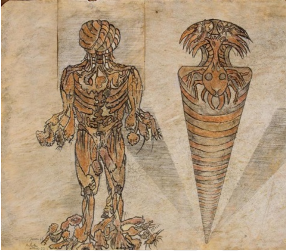
Resim 10: Yüksel Arslan, “ isimsiz ”, kağıt üzerinde karışık teknik, 41 x 47 cm, 1963. 7

Grotesk, kendimiz yüzümüze taktığımız maskeyi düşürür ve içimizdeki yabaniliği ortaya çıkarır. Bu yüzden insan kendi hakikati ile yüzleştiğinde korkuya bürünür ve düşünceye dalar. Grotesk bir resme bakan izleyicinin gülüşü boğazında tıkanır, dudağında kurur ve şu soruyu sorar kendinde: acaba bu benim gerçek yüzüm mü?