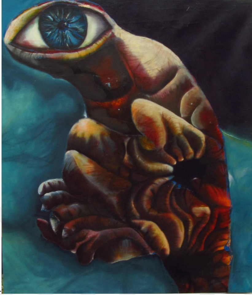
Resim 24: Amineh Ahmadi, “Açgöz”, tuval üzerine yağlı boya, 195 x 222 cm, 2015.

Bir gözümüz hedefe odaklanırken diğer gözümüz sonsuzluğu hedefler. Günümüzde tinsel olan diğer göz, materyalizmin baskısı altındadır. İki göz de açgözlülükle bakar, gerçeğe öyle odaklanmıştır ki tinsel gözün varlığına inanmaz. Rüyadaki gözümle gerçek dünyada yaşasam, düşlerle gezebilsem, kabuslarım biter. Sadece şahit olmak gerekir hayata. İnsanları yargılamak, başkalarını suçlamak bir gün insanın kendisine geri döner. Çünkü hiç kimse kusursuz değil ve dünya sadece siyah ve beyazdan oluşmuyor.