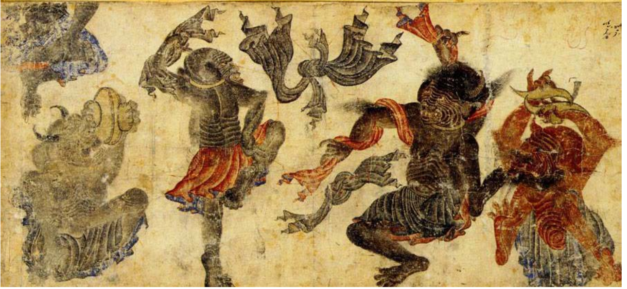
Resim8: Mehmed Siyah Kalem,“İblisler”, kağıt üzerinde mürekkebe, 50 x 34 cm, 15. yy. 6