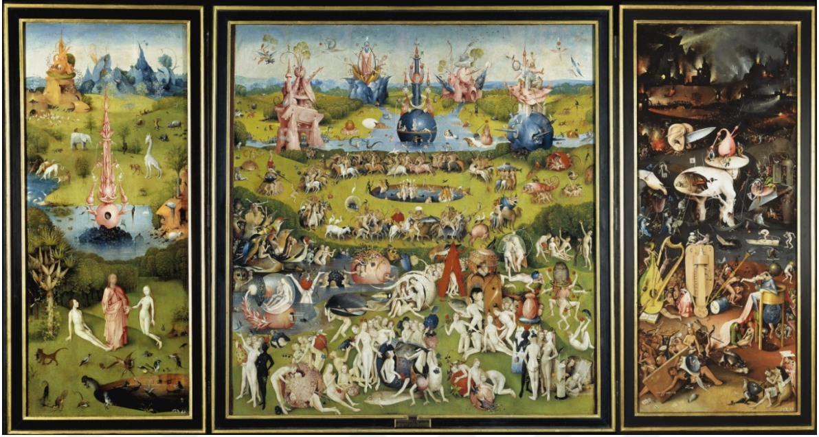
Resim 5: Hieronymus Bosch, “Zevkler Bahçesi”, ahşap panel üzerinde yağlıboya, sol panel: 220 x 97.5, orta panel: 220 x 195, sağ panel: 220 x 97.5 cm, 1500 dolayları. 3

Freud Bosch'un eserlerini inceleyerek, onun gece kabuslarını resmettiğini savunmuştur. Bosch, kendi yaşamında karamsar olmasına ve korkunç bir dünyada yaşadığına inanmasına karşın, eserlerinde inanılmaz bir renklilik ve mutlu ifadeli insanlar yansıtabilmiştir. Sanat tarihine eşsizliğiyle geçen “Zevkler Bahçesi” (Resim 5), bütün kuralları yıkarcasına resmettiği bu insanların keyifli hallerini, fantastik bir öykü içinde vermiştir. Tabloda, bir yandan dünya nimetlerinden zevk alan insanlara, diğer yandan günahlarından dolayı işkence edilmeleri dikkat çekiyor. Tablo aynı zamanda Ortaçağ insanında hakim olan karabasan ve ölüm düşüncesini de vurgulamaktadır. Boch'un bu çalışmasında kabusa yönelik en belirgin işaretler, cehennemi anlatan sağ panelde görünmektedir. “En arkada korkunç bir karanlık ve cehennem ateşi görülmektedir. Bu eser yaklaşık olarak 1500 yılında yapılmıştır. Bosch'un olgunluk dönemine denk düşen tablo, teknik olarak tarifi neredeyse olanaksız oldukça karmaşık bir manzara sunuyor. Freud bu resmi yorumlarken bir düş olarak nitelermektedir. Resimde bir düş gibi her şey birbirine girmiş durumdadır. Freud'dan yola çıkarak bu resmin