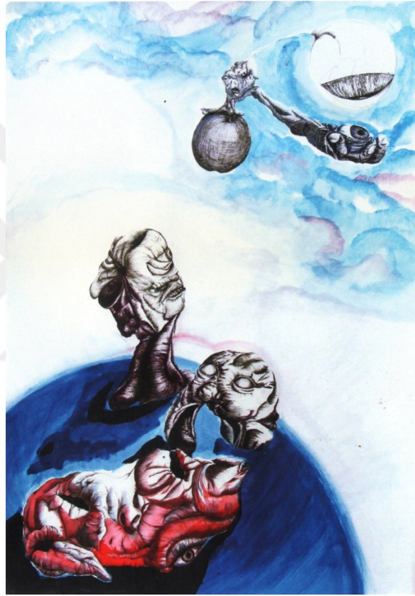
Resim 27: Aminah Ahmadi, “ Nefsine Bakanlar ”, kağıt üzerine çini mürekkebi ve tempera, 70 x 100 cm, 2016.

içimdeki bütün varlıkların tüm garipliği eyleme geçerler. Yola Çıkan adlı resim(Resim 26), aynı dönemde farklı zamanlarda ayrı ayrı çizilen imgelerin beyaz bir kağıt üzerinde kolaj tekniğiyle birleştirilerek oluşmuş bir çalışmadır. Fon sonradan resmin bütünlüğünü elde etmek ve perspektif yaratmak için resme eklenmiştir. Resimdeki varlıklar suskunlar ve tebessümle kendilerini izleterek korkuya değil düşünceye davet ediyorlar. Bu, kendi iç dünyamda bir eylem ve dış dünyamdaki bütün garipliklerle barışmak için bir davettir.