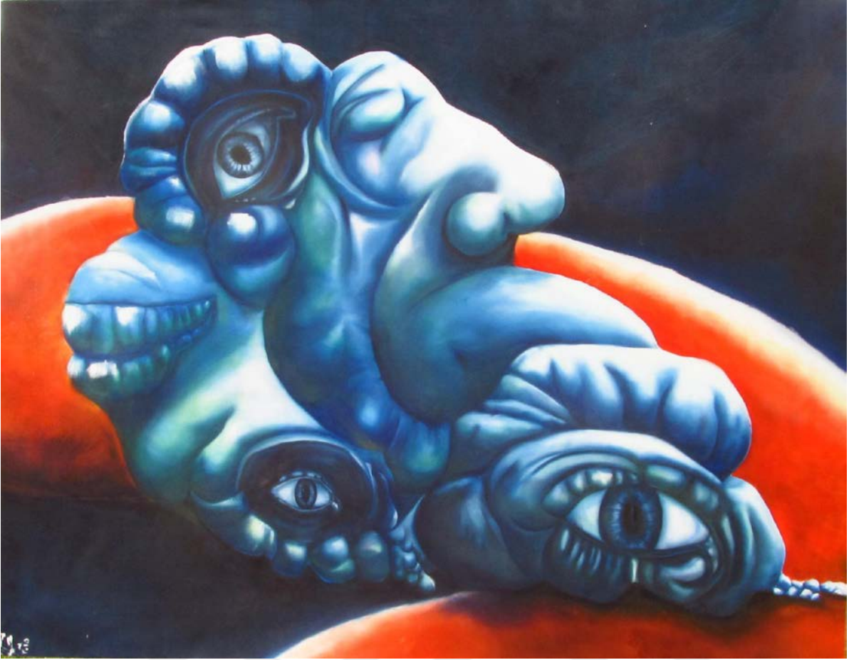
Resim 22: Amineh Ahmadi, “Aydın Gözler”, tuval üzerine yağlı boya, 200 x 230 cm, 2015.

Aydın Gözler çalışmasında (Resim 22) sola doğru yönelmiş, dünyevi olan her şeye kapanmış dudakları, bir tebessüm içinde vurgulu bir şekilde açığa çıkarılmış bir figürle karşı karşıyız. Yüksek kontrast, arka planın karanlığını arttırmış, açılan gözlerin derinliğini vurgulamıştır. Bu çalışmada sabah ışığının doğumu ele alınmıştır. Bakan ve bakılan arasındaki çizgiyi uç noktaya taşınmıştır. Burdaki gözler izleyiciye bakarken sorular sorar: