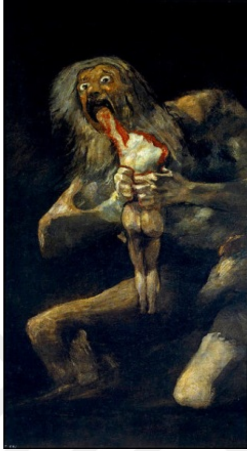
Resim 13: Francisco Goya, “Çocuklarını Yiyen Satürn”, duvar üzerine yağlı boya,