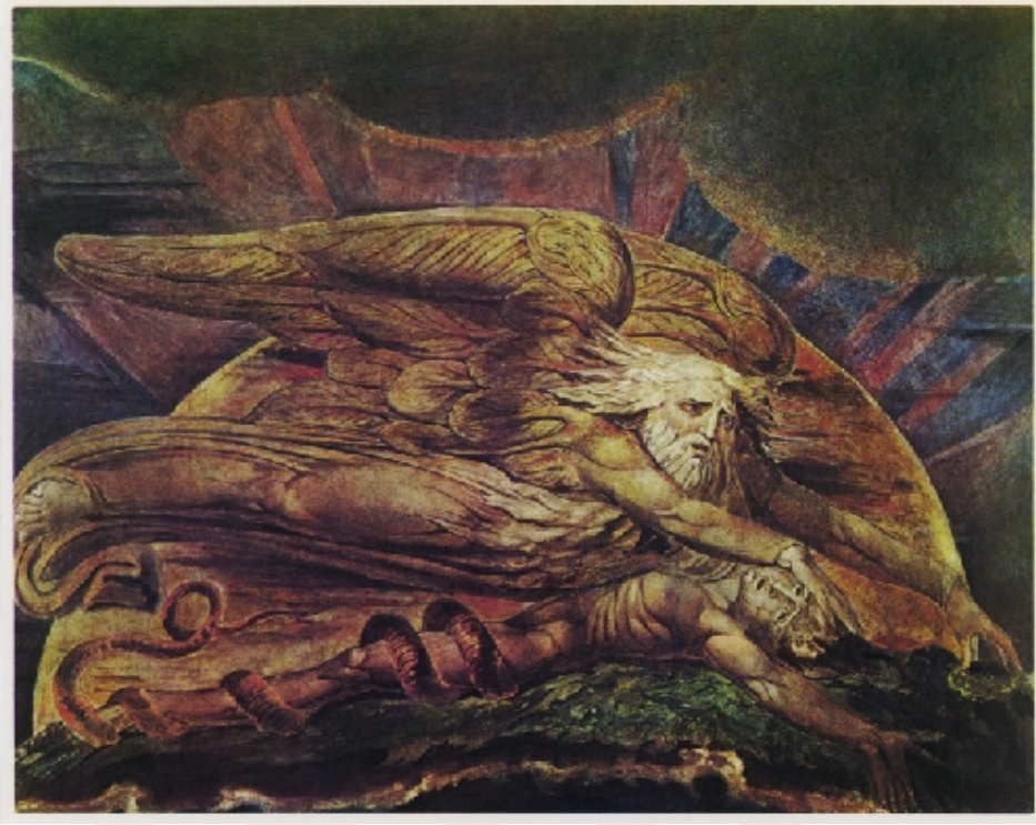
Resim 7: William Blake, “ Tanrı Adem’i Yarattı ” kağıt üzerine tükenmez kalem ve sulu boya,