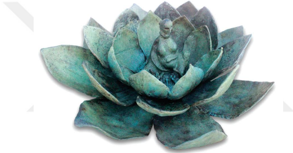
Resim 30: Amineh Ahmadi, “ Mavi Lotus ”, bronz heykel, 50 x 50 x 25 cm, 2016.

Çünkü hepimizi birbirimize bağlayan ve hiçbir zaman göremeyeceğimiz tek bir Varlık'tan geliyoruz ve onunla bağlı olmak kendimize yönelmektir. Kendimizi dinlemek, anlamak ve kabul etmektir. Ama ne yazık ki bütün duyguları yaşamaya ve görmeye ömrümüz yetmiyor, bu yüzden hep eksikiz. Onların tadını alabilmek için illa ki onları yaşamış olmamız gerekmiyor. Çoğu zaman o duyguyu, yaşayanın gözlerinde görebilir ve düşlerimizde onu yaşayabiliriz. Onların gözlerinde kendimizi duyabiliriz. O gözlerin içine hiç korkmadan ve hiçbir yargıda bulunmadan bakmak cesaret ister.