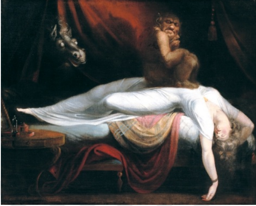
Resim 14: Henry Fuseli, “ Kabus ”, tuval üzerine yağlı boya, 101 x 127 cm, 1781. 10