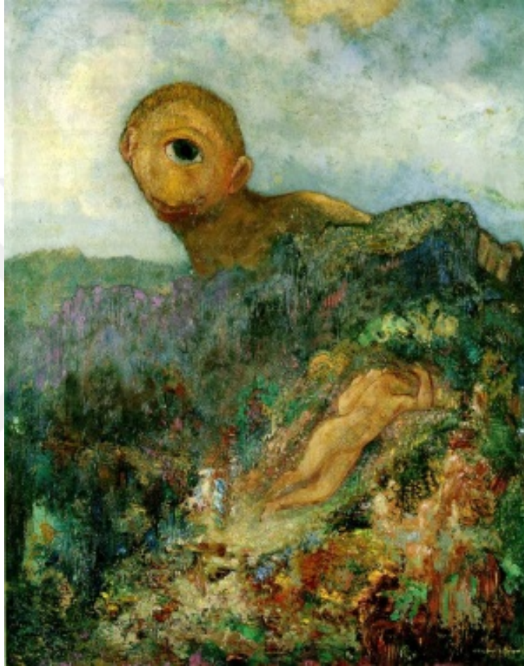
Resim 6: Odilon Redon, “Kiklop”, ahşap panel üzerine yağlıboya, 64 x 51 cm, 1899. 4

Sanat tarihinde 19. ve 20. yy.’da bir akım olarak Sembolizm ismiyle katagorize edilen sanat akımı sembolik anlatımı öne çıkardığı için rüyalar ve kabuslar diline yakın sayılabilir. Nitekim rüyaların dili de Jung’un anlattığına göre sembolik bir dildir.