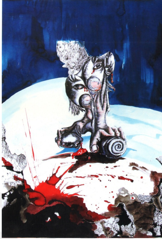
Resim 29: Amineh Ahmadi, “Ptlayış”, kağıt üzerinde çin mürekkebi ve tempera, 70 x 100 cm, 2016.

Gözlerin ardındaki gözlemci, derin karanlıkta dur durak bilmeden, hep izliyor. Ondan kaçış yok, uykuda bile. Sanki ölsen yine seninle olacak, sonsuza kadar. Hayatının ilk günlerini anımsa. O günlerde çocuk kokuyor, temiz bir ruh taşıyorduk. Mavi, canlı hayaller kuruyorduk. Çocukken birbirimizin gözlerine bakıyorduk. Gözler insanların ruhunu birbirlerine açtıkları birer penceredir. İnsan kendi çelişkilerini başkalarında görür. Gözümüze görüneni iyi ya da kötü diye adlandırabiliriz. Ama aslolan, iyinin ve kötünün ötesindeki evrenin dengesidir. Ancak doğrudan, kalpten bakmayı öğrenerek dönüşüp değişebiliriz. Bu saf bakış, tüm varoluşu karşılıksız sevebilmekte yatıyor.