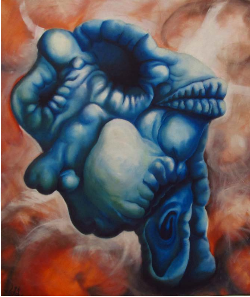
Resim 23: Amineh Ahmadi, “ Mavi Kör ”, tuval üzerine yağlı boya, 235 x 200 cm, 2014.

İnsanın iki ağız vardır, biri kulaktır, ruhunun ağızı; diğeri ise teninin ağızıdır. Kulağımıza gelen giden her sese dikkat etmemiz gerekir. Söz temiz, ahlaki ve güzelse onu duymak ruha iyi gelir. Yediğimiz, içtiğimiz herşey temiz ve faydalı olursa sağlıklı bir vucuda sahip oluruz. Emanet olarak verilmiş vucudumuz ruhumuza açılan kapıdır ve ona iyi bakmamız, onu özenle korumamız gerekir. Mavi Kör (Resim 23), dünyevi karmaşanın içersinde kendini kaybetmiş insanı temsil eder. Doyumsuz gözleri karanlık bir çukura benzetilmiştir. Arka plandaki turuncu renk, karmaşık dünyada asılı kalan mavi ruhu öne çıkarmak için seçilmiştir. Bu renk seçimi semboliktir.