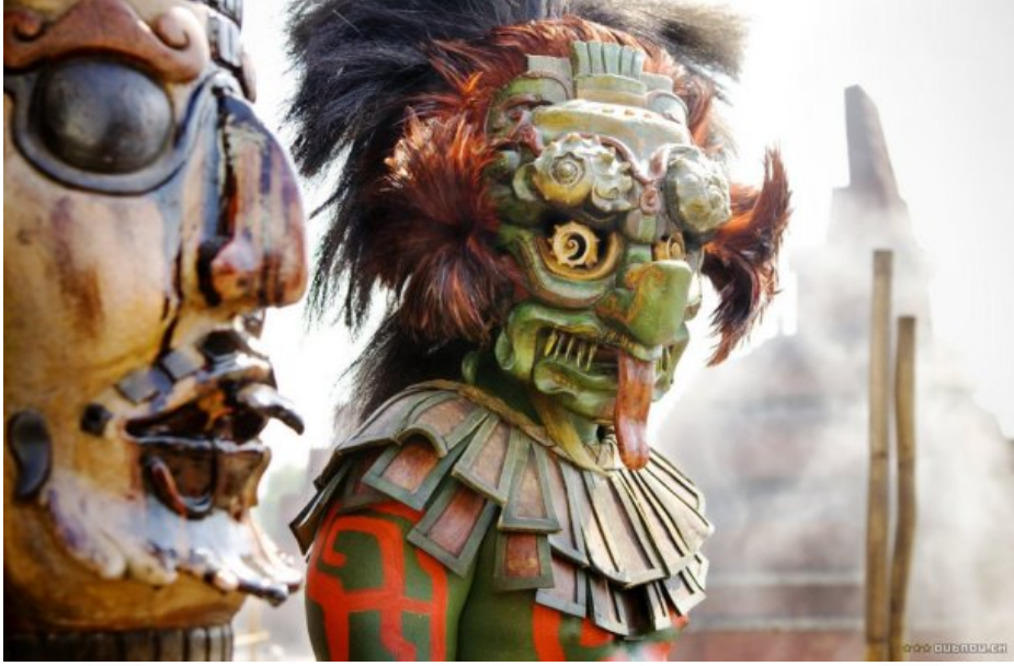
Resim 2: Mel Gibson, Apocalipto , sinema eseri, 2007. 1

“Ve adem tek başına oturdu. Hüzne boğulmuş bir halde. Bütün hayvanlar etrafında toplandı ve dediler ki: seni böyle üzgün görmek hoşumuza gitmiyor. Bizden her ne dilerse gerçek olacak.