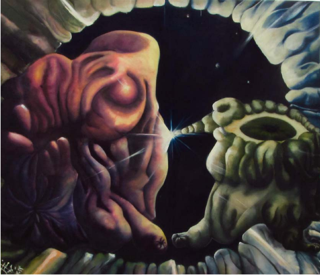
Resim 21: Aminah Ahmadi, “ Evren ”, tuval üzerine yağlı boya, 200 x 250 cm, 2014.

“Evren” isimli resimde (Resim 21) insan varlığı ve onun dünyaya gözünü ilk açışı ele alınmıştır. Soldaki mor renkli, içe doğru kıvrılan, büzüşmüş biçim, solmuş bir halde duruyor. Sağ tarafta tek gözlü bir varlığı anımsatan ve lotus çiçeği gibi yükselmeye meyilli bir imge görünmektedir. Kompozisyonun tam ortasına aydınlatıcı bir ışık yerleştirilmiştir. Ancak bu ışık gerçekte hiçbir şeyi aydınlatmamaktadır, meğer zihinde olan bir görünüşmüş. Arka planda, gözbebeğinin derinliği, uzayın sonsuzluğuna karışır. Evren ’de anlatmak istediğim şey fiziksel ve tinsel birleşmenin paradokskal yapısıdır. Bir tarafta kanlar, diğer tarafta da gözyaşı nehirler gibi akar gider ama sonunda herşey yeniden doğar ve hayat devam eder.