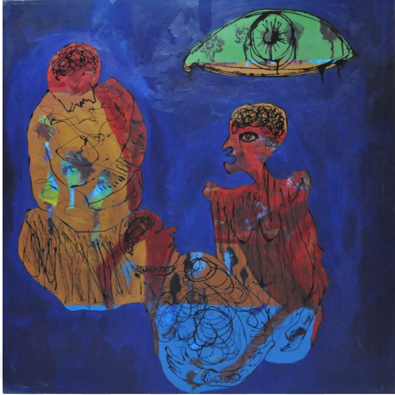
Resim 18: Amineh Ahmadi, “Göz Arkasındaki Cennet”, tuval üzerine karışık teknik, 150 x 150 cm, 2013.