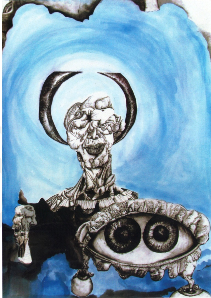
Resim 28: Amineh Ahmadi, “ İki Göz Bir Arada ”, kağıt üzerine çini mürekkebi ve tempera, 70 x 100 cm, 2016.

gözlerini açmaya çalışan başka bir figür yerleştirilmiştir. Bu iki figürün yukarısındaki figür ise, gökyüzüne dikilmiş gözleriyle hem gölgesini izler hem de sonsuzlaşmanın özlemini taşır.