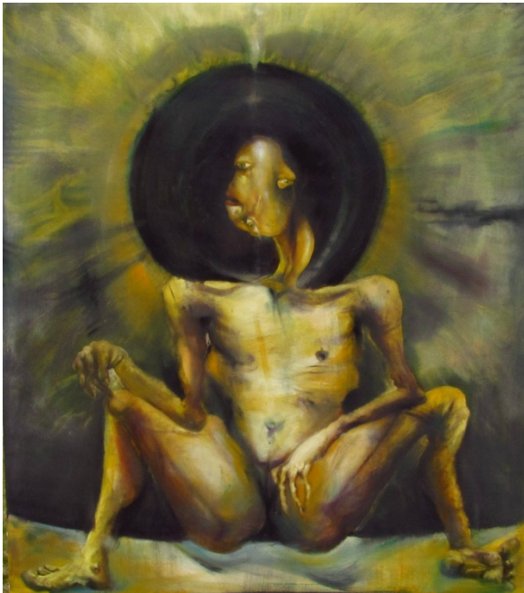
Resim 19: Amineh Ahmadi, “Animus”, tuval üzerine yağlı boya, 150 x 170 cm, 2014.