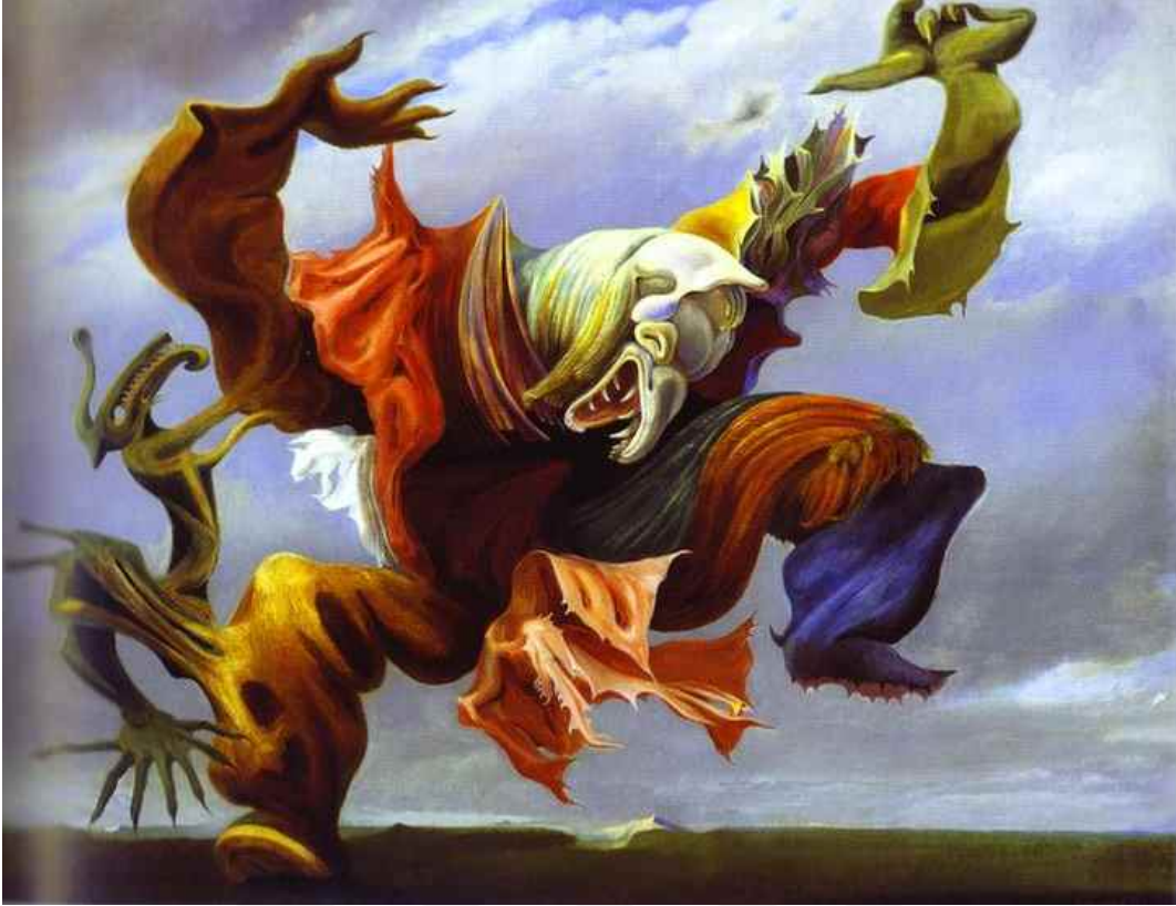
Resim 11: Max Ernst, “ Ocağın Meleği ”, tuval üzerine yağlı boya, 114 x 146 cm, 1937. 8

(Resim 11)'da Max Ernst'in siyasetle birebir ilgili olan nadir eserlerinden biridir. Sanatçı İspaniya iç savaşında cumhuriyetçileri yenen faşistlerin gücünü, saldırgan, kör ve önüne gelen herşeyi yokeden bir iblise benzetmiştir. Böylece sanatçı geleceğe dair endişelerini dile getirmiş ve geleceği görmek konusunda kendisini de dahil etmiştir. Demonun agresifliğine vurgu yapmak için Ernst, kontrastı yüksek, parlak renkler seçmiştir.