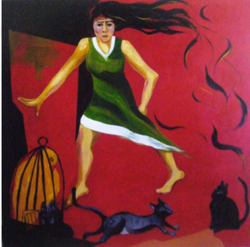
Resim 15: Amineh Ahmadi, “ Kabus ”, tuval üzerine akrilik boya, 150 x150 cm, 2007.