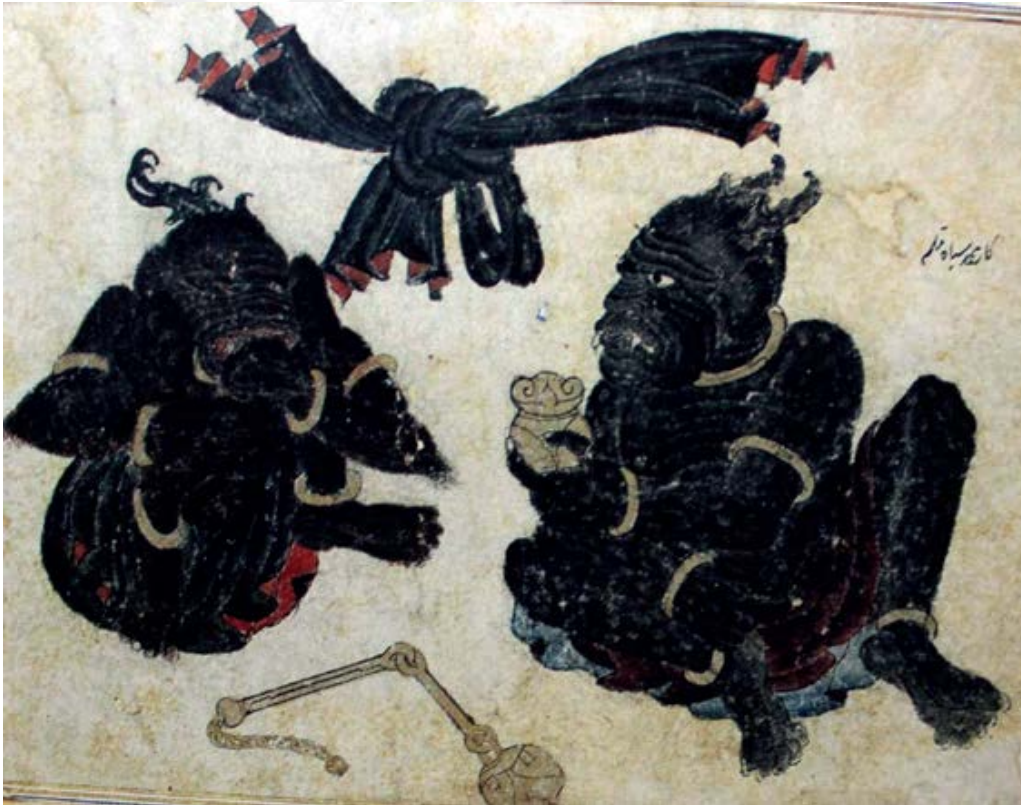
Resim9: Mehmed Siyah Kalem,“İblisler”, kağıt üzerinde mürekkebe, 50 x 44 cm, 15. yy.