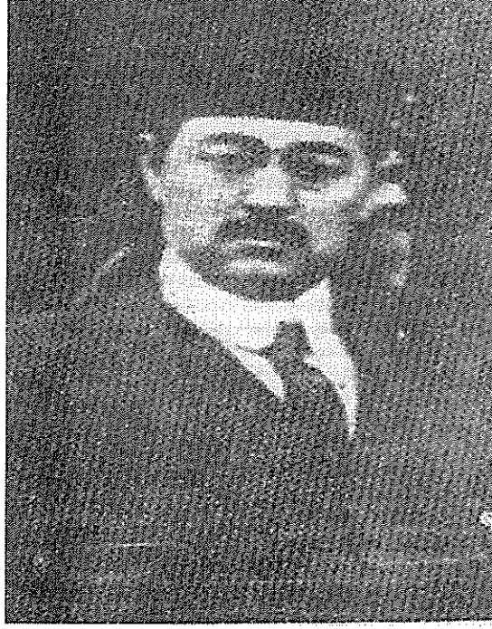
II. Meşrutiyet yıllarında Tekin Alp