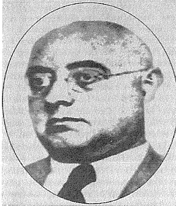
Cumhuriyet Yıllarında Tekin Alp