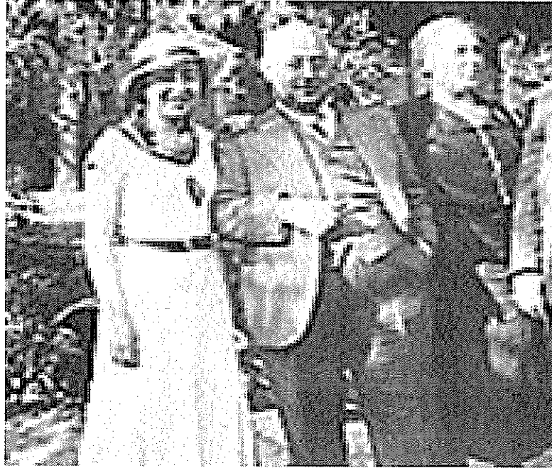
Cumhuriyet Döneminde Tekin Alp