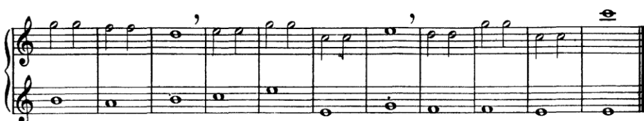
Görsel 3: Altes, Joseph-Henri. Altes Method for the Boehm Flute Part I No:5 Variation I