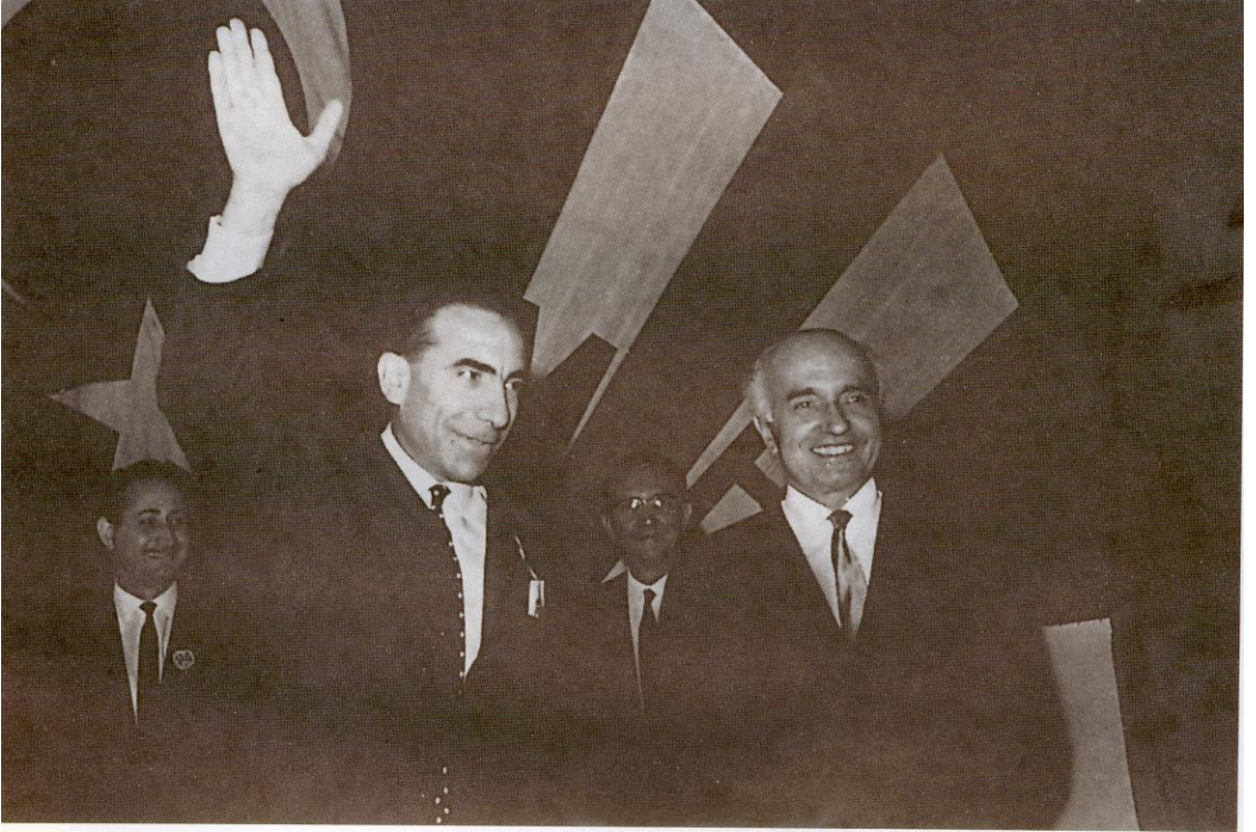
Alparslan Türkeş, Genel Başkanlığını ilan ediyor.