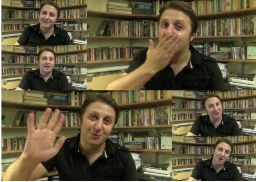
Şekil 2. Model Örneğinden Görüntüler

İçeriğini güzel konuşmanın önemini ve güzel konuşabilmek için yapılması gerekenlerin oluşturduğu model örneğine , tez çalışmasının yer aldığı Yüksek Öğretim Kurumu sayfasından ulaşılabilmektedir. Bu örneğe ait görüntülere ise çalışma içinde şu şekilde yer verilebilir: