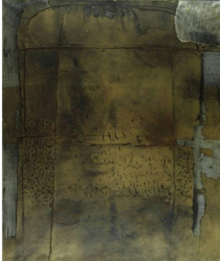
Görsel 7. Antoni Tapies, 1958, “Gri Hardal / Grey Ocher”.

Antoni Tapies de çalışmalarını bu hareketin doğurduğu fikir bağlamında ele almış ve daha sonra hareketten ayrılarak bireysel çalışmıştır. Paul Klee ve Joan Miro'nun sanat üslubundan etkilenen Tapies, kısa bir süre sonra sanatsal çalışmalarında, farklı nesnelere kullanmıştır. Yapıtlarında kullandığı mermer ve kil gibi nesnelere toz ve kalıntıları ile kabaca biçimler oluşturarak yapıtlar üretmiştir. Çalışmalarında farklı prosedürler uyguladığı yüzeylerde; parmak izi, oluk, kesik ve çatlaklar oluşturmuştur. Yapıtların yüzeyinde kalın ve tane şeklinde oluşturduğu dolgu formları biçimlendirmesi ile boya tüplerini gelişigüzel bir şekilde formların üzerinde bir çeşit macun ile karıştırarak uygulamıştır. Böylece Tapies kolaj gibi tekniklerin biçimlerini, farklı kılacak şekilde geliştirmiştir. Kolaj tekniğine benzer bir şekilde çizikli veya üzerini çizecek kartonları kullanarak, üzerlerine yağlı boya ve mermer tozu ile karışımı şekilde farklı renkler oluşturmuştur. Bu çalışmalarındaki nihai amacı pürüzsüz yüzeylere zıt, kaba ve gözenekli dokular oluşturmaktır. Bu çalışmaların yüzeyinde oluşan boşlukları boyayarak ve diğer alanları kazıyarak yüzey üzerinde dokular oluşturmuştur. Tapies'in yapıtlarında kurduğu temalar; yaşam, ölüm, evren, cinsellik gibi içsel bir ses ile işaret ve imgelerden oluşur.