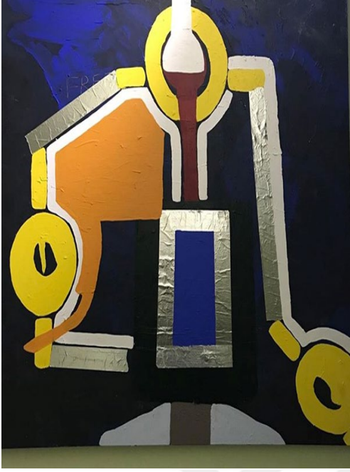
Görsel 3.8. Abdulvehap Erboğa, 2018, “Özgürlük”.

sosyal, kültürel, dil ve ekonomik olgular bu süreç içerisinde olumlu olumsuz yaşanmışlık olarak bu çalışmaya ilham olmuştur.