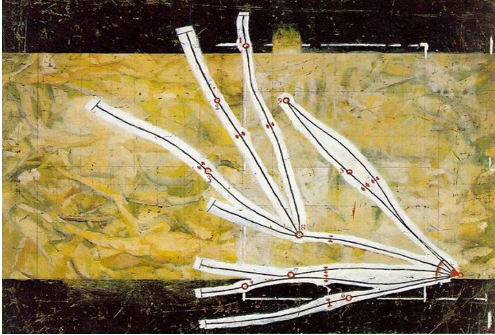
Görsel 3. Marcel Duchamp, 1914, “Stopaj Ağı / Network of Stoppages”.

yüzeyine) yapıştırılmıştır. Bu yapıtında kullandığı her biri bir metrelik olan birbirinden farklı nesnelere, sadece bir deney olarak kurgulamıştır. 1799 yılında, Fransız Yasama Meclisinin; dünyanın çevresinin çeyreğinin on milyonda birini, bir metre olarak belirlemiş ve buna göre de metrik sistemlerini oluşturmuşlardır. Duchamp bu örnekten yola çıkarak, insanların işine yarayabilecek ve insanların kendi kararlaştırdığı ölçüleri işaret ederek, doğa güçlerinin araya girmesi ile bu tür bazı şeylerin yararsız bir duruma sokulduğu gösteriyordu. Bir demiryolu ağ haritasına benzettiği “Stopaj Ağı” adlı yapıtında da, “Üç Standart Stopaj” adlı yapıtında kullandığı iplerin aynısını, yalnız her bir ipi üçer kez tekrarlayarak yapmıştır.