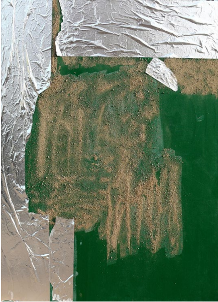
Görsel 3.4. Abdulvehap Erboğa, 2017, “Çatışma”.