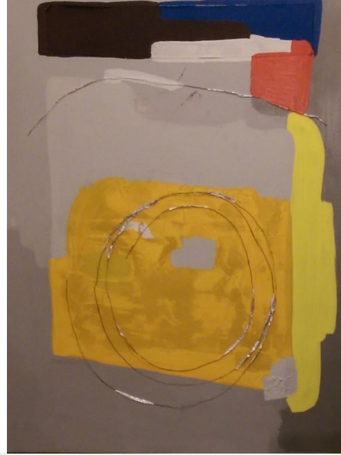
Görsel 3.9. Abdulvehap Erboğa, 2017,

“Küçük Bir Şey”. Tuval üzerine karışık teknik