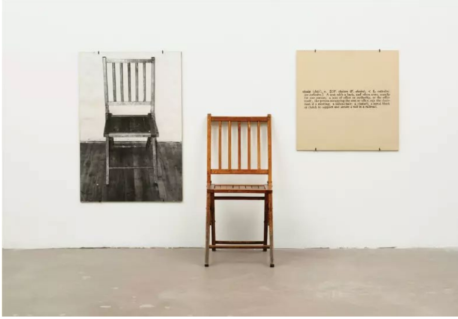
Görsel 9. Joseph Kosuth, 1965, “Bir ve Üç Sandalye / One And Three Chairs”.

Researchgate. Erişim: 14.12.2018. https://bit.ly/2A9Astp