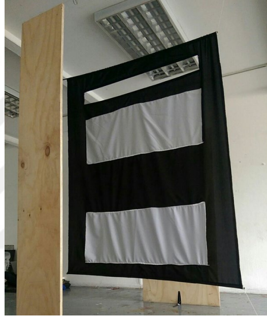
Görsel 3.7. Abdulvehap Erboğa, 2018, “Biz”.