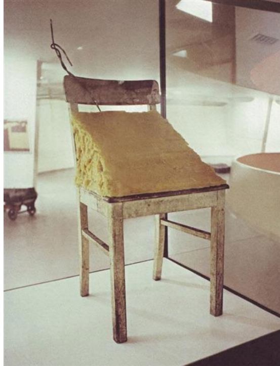
Görsel 8. Joseph Beuys, 1964, “Yağ Sandalyesi / Fat Chair”.

Antoni Tapies (1923-2012), yapıtlarında kullandığı farklı nesnelere bir arada sentezleyerek, (bireşim) kaba ve yoğun bir şekilde biçimlendirmiştir. “Gri Hardal” yapıtında (görsel 7), Tapies, tuvalin üzerinde farklı nesnelere bir arada biçimlendirerek, İspanya'nın Katalanya bölgesinde, savaştan sonraki sahneyi kurgulayarak, evlerin, sokakların ve duvarların yıkıntılarına benzer bir imge oluşturmuştur. İspanya'daki iç savaşın ardından, evlerden ve duvarlardan kalan izleri kurgulayan Tapies, savaşın insanlara çektiği acı ve şiddeti, dönemin İspanya devlet yöneticisi olan Franco'nun acımasız baskıları ve savaş sonrası oluşturduğu sahneyi, yapıtlarında, nesnelere farklı şekilde biçimlendirerek göstermiştir. George Macinuas (1931-1978) New York'ta Litvanya kültür derneği adına, çıkaracağı bir dergi için kullanmış olduğu Fluxus ismini, sözlükten bularak kullanmıştır. Fluxus sanat hareketi; New York, Avrupa, Rusya da etkinlikler düzenleyerek birçok sanatsal faaliyetler sürdürmüştür. Bu hareketin 1964'te düzenlediği Düsseldorf'taki etkinliğine, Joseph Beuys da “İki Müzikçi İçin Kompozisyon” adlı bir gösteri yapmıştır. Performans, yerleştirme, heykel, resim gibi çeşitli çalışmaları olan Beuys, daha çok işlerinde hayvan ve hayvansal maddeler (yağ, keçe gibi) kullanarak, insanlar ile arasında bir bağ kurmuştur.