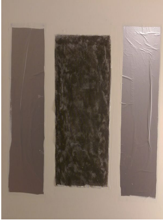
Görsel 3.10. Abdulvehap Erboğa, 2017, “İnce Memed”.