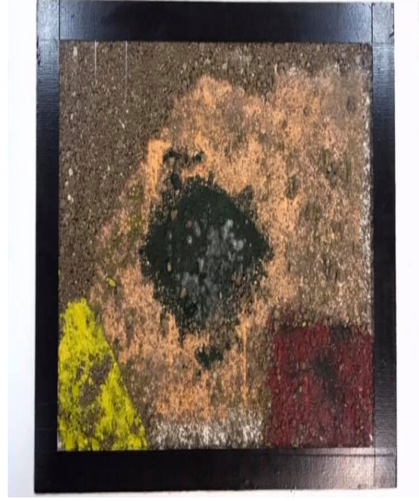
Resim 3.11. Abdulvehap Erboğa, 2017,