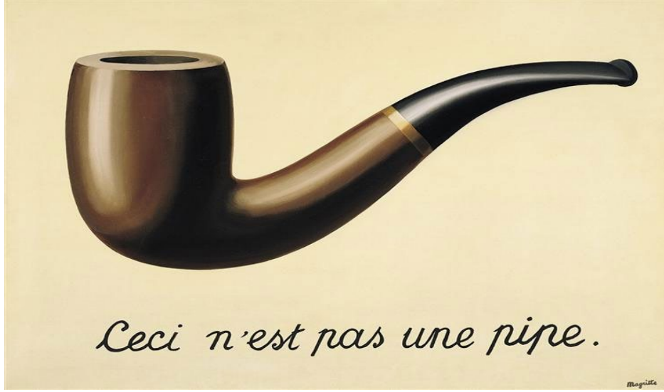
Görsel 5. Rene Magritte, 1929, “Bu Bir Pipo Değildir / İmgelerin İhaneti”.

“La Trahison des images / This Is Not A Pipe / Ceci N'est Pas Une Pipe”.