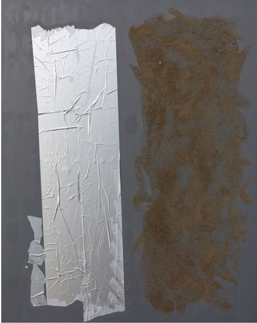
Görsel 3.2. Abdulvehap Erboğa, 2017, “Ben”.

benzer bir anlam bağı kurulmuştur denilebilir. Aynı zamanda bu iki nesnenin birbiriyle olan biçimi ve yapı ilişkisi; farklılığı ve karşıtlığı içinde barındırır.