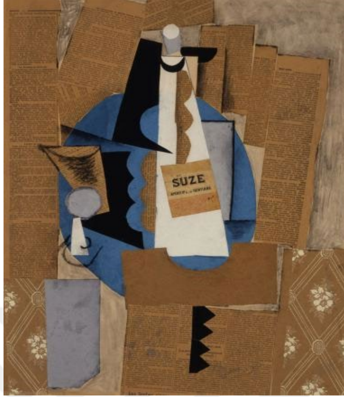
Görsel 1. Pablo Picasso, 1912, “Suze Şişesi / La bouteille de Suze”.

Kemperartmuseum. Erişim:26.10.2018. https://bit.ly/2PTZK4p