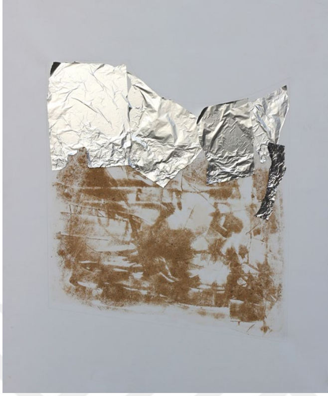
Görsel 3.3. Abdulvehap Erboğa, 2017, “Yabancı”.