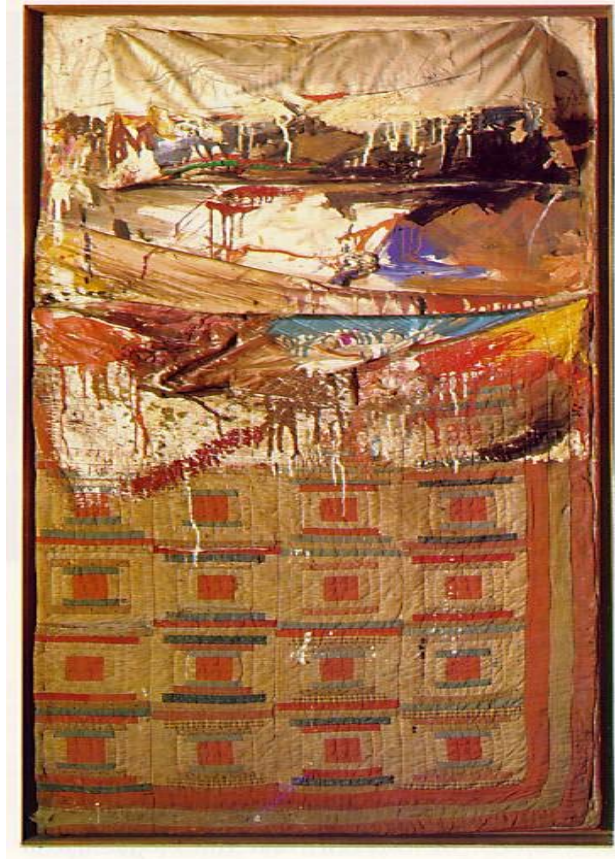
Görsel 6. Robert Rauschenberg, 1955, “Yatak / Bed”.

Archive .Erişim:09.11.2018, https://bit.ly/2z1zTKN