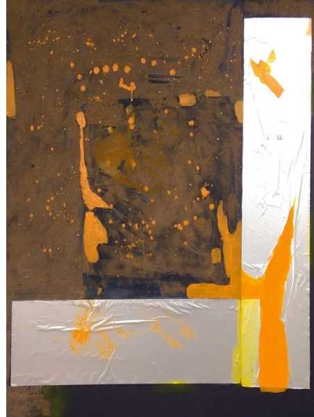
Görsel 3.5. Abdulvehap Erboğa, 2017, “Üç Şey”.