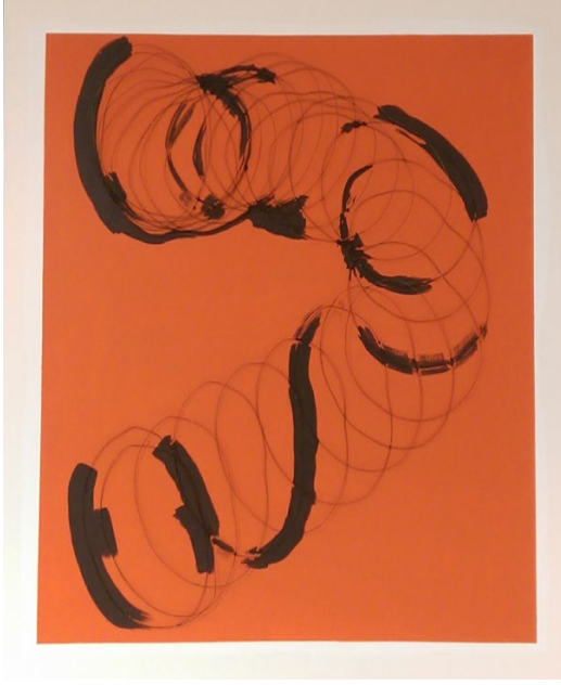
Görsel 3.6. Abdulvehap Erboğa, 2017, “Durgun”.

“Çatışma” (görsel.3.4.) adlı çalışma karışık teknikle; alüminyum folyo, toprak ve yeşil boya kullanılarak yapılmıştır. Belli bir mekân üzerinde toplumsal ve ekonomik olarak toplumun üzerine hâkim bir güç oluşturma fikrinden yola çıkarak yapılmıştır. Yine aynı teknik ile yapılan “Üç Şey” (görsel.3.5.) adlı resimde yoğun kullanılan toprak ve L harfi şeklinde kullanılan alüminyum folyo ise; toprağın üzerinde deneysel bir şekilde uygulanan turuncu boya, üç nesnenin biçim, özellik ve farklı maddelerin nasıl bir arada kaldığını, bir toplum içerisinde ağır basan bir sınıfın, düzen ve düzensizliğine bir benzeşim olarak gösterilmiştir.