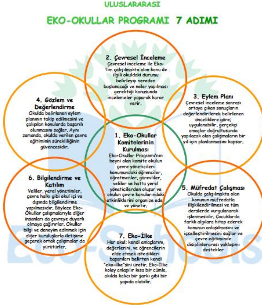
Şekil 1. 2. Uluslararası Eko-okullar Programı 7 Adımı (Eko-Okullar, 2013)

Eko-okullar komitesi, çocukların yaş ve yeteneklerine bağlı olarak birçok şekilde oluşturulabilir. Bu oluşum formal ya da informal olabilir. Her ne şekilde olursa olsun, tüm ilgili takımları temsil etmeli; tüm toplantıları ve kararları kayıt altına almalıdır.