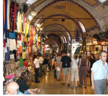
Resim 33: Günümüze ait pazar görseli

Etkinliğin birinci aşamasında çocuklara yukarıda bazılarına yer verilen Osmanlı dönemine ve günümüze ait pazar resimleri gösterilmiştir. Resimler gösterilirken diğer taraftan okul öncesi eğitim programında yer alan (MEB, 2006:22) " kendisinin ve başkalarının haklarına saygı gösterir " kazanımından yola çıkılarak, çocuklara Osmanlı dönemine ait pazarcılık anlayışı hakkında bilgi verilmiştir. Çocuklara Osmanlı dönemine ait pazarcılık anlayışına "hoşgörünün" hâkim olduğu, pazarcılık yapan insanların birbirlerinin satışlarına yardımcı olduğu anlatılmıştır. Daha önce yapılan etkinlikler esnasında çocuklar tarafından hazırlanan ürünler (sedef kutu, sihirli süpürgeler, sepetler, müzik kutuları) sınıfa getirilerek pazar ortamı oluşturulmuş ve drama yapılmıştır. Çocuklar bu etkinliğe oldukça ilgi göstermişlerdir.