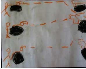
Resim 50: EFA'nın Resmi

Resim etkinliğine katılan 10 çocuktan 7'si yapılan dramayı resmetmişlerdir. Kalan 3 öğrenciden 2'sinin yaptığı resmin Çanakkale Zaferi'yle alakası bulunmamaktadır. Bir çocuk ise kazanılan zaferi daha masalsı bir boyutta resmetmiştir. Etkinlik ile ilgili görsellere aşağıda yer verilmiştir.