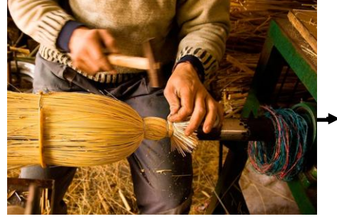
Resim 9: Süpürgenin bağlanması