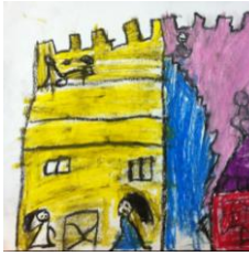
Resim 25: KS'nin Resmi

Gösterilen resimler üzerine konuşmalar bittikten sonra, resim yapma ve anlatma etkinliğine geçilmiştir. Okul öncesi eğitim programında yer alan (MEB, 2006: 25) "olay ya da varlıkların özelliklerini karşılaştırır" kazanımından yola çıkılarak çocuklardan günümüz evleri ile Osmanlı dönemi evlerini karşılaştırmalı olarak resmetmeleri ve bu resimleri anlatmaları istenmiştir. Etkinlik ile ilgili görsellere aşağıda yer verilmiştir.