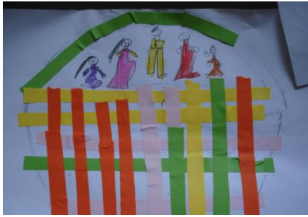
Resim 2 : Öğrencilerin yaptıkları sepetler

Etkinliğin ikinci aşamasında; okul öncesi eğitim programında (MEB, 2006:19) yer alan “kâğıt üzerinde çizilmiş basit şekilleri keser” kazanımından yola çıkılarak, çocuklardan çeşitli materyaller kullanarak kâğıda sepet yapmaları istenmiştir. Etkinlik sırasında çocuklara üzerinde sepet şablonu çizilmiş kâğıtlar ve renkli kâğıtlar dağıtılmış ve kendi sepetlerini yapmaları istenmiştir. Çocuklardan bu sepetleri yaparken kendilerini sepet ustaları gibi hissetmeleri tavsiye edilmiştir. Ardından sepetlerin içlerine taşımak istedikleri eşyaların resimlerini çizmeleri istenmiştir. Bu etkinlikle ilgili bulgulara aşağıda yer verilmiştir.