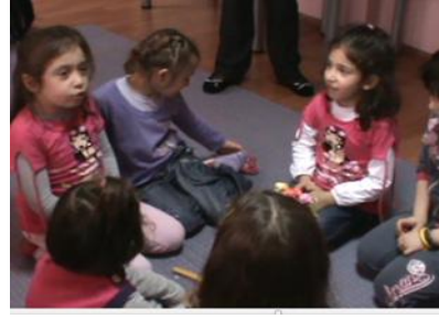
Resim 20: Eski meslekler oyunu 2.grup

Bu etkinliğin bitiminden sonra; çocukların kendi isteği doğrultusunda müzik etkinliğine geçilmiştir. Bu etkinlikte demircilik mesleği için söylenen şarkı, işlenen bütün mesleklere çocuklar tarafından uyarlanmıştır. Bu uyarlama aşağıda verilmiştir.