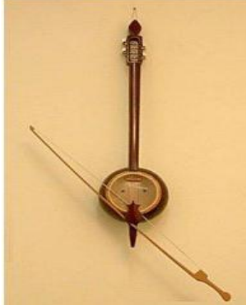
Resim 37: Kabak Kemane