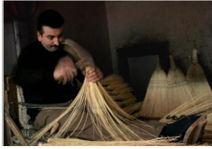
Resim 8: Süpürgelerin kesilmesi