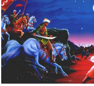
Resim 48: Türk Bayrağı Oluşumu