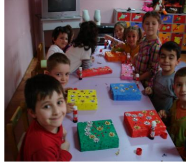
Resim 17: Sedef kutu yapımı

Yukarıdaki resimde görüldüğü gibi; çocukların her biri kendi sedef kutusunu yapmıştır.