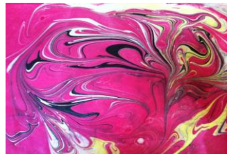
Resim 46: Ebru ürünleri-2