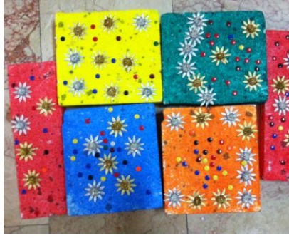
Resim 16: Çocukların yaptıkları kutular