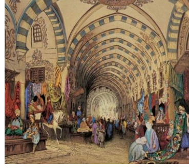
Resim 24: Çocuklara gösterilen Osmanlı Mimari Yapıları-2