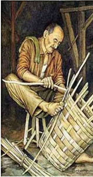
Resim 1: Sepet Yapan Usta

Bu diyalogun ardından öğrencilere aşağıda yer alan ve sepet yapan bir ustanın resmi gösterilmiştir. Konuyla ilgili diyaloga aşağıda yer verilmiştir.