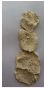
Resim 40: KS'nin Ürünü

Çocuklar tarafından yapılan seramik ürünlerinin görsellerine aşağıda yer verilmiştir.