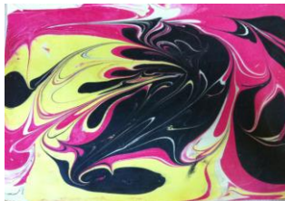
Resim 45: Ebru ürünleri-1