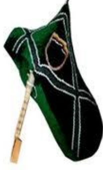
Resim 36: Tulum