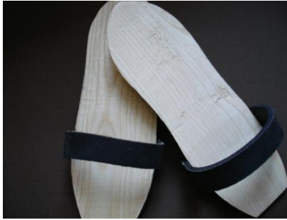
Resim 12: Sınıfa getirilen takunya