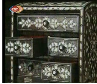
Resim 15: Yapılan sedef kutu

Yukarıdaki diyalogda görüldüğü üzere; çocuklar izledikleri videonun 2 ardından, sedef kutu yapım aşamalarını anlatmışlardır.