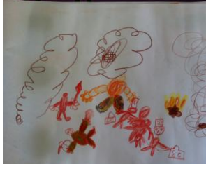
Resim 55: EY'nin Resmi

EY: Şimdi bir tane Türk askeri yaralanmış, doktor bunu tedavi etmiş. O bomba fırlatmış.