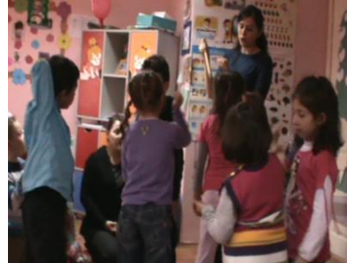
Resim 22: Şarkı söyleme

Sosyo kültürel öğretim bağlamında eski zamanlardaki sosyal yaşamı merkeze alan eski meslekler etkinlikleri genel olarak değerlendirildiğinde; bu tür etkinliklerin çocukların zamanı algılama, süregelen düş gücünü kullanma, çıkarımlarda bulunma