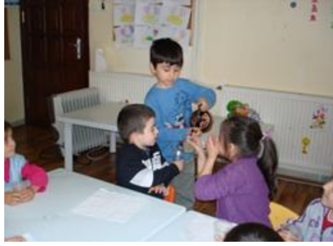
Resim 5: Sınıfta şerbet satılması

Bu diyaloglardan sonra, okul öncesi eğitim programında (MEB, 2006: 21) yer alan "küçük kaslarını kullanarak belirli bir güç gerektiren hareketleri yapabilme" kazanımı göz önünde bulundurularak, çocukların limonları sıkarak kendi şerbetlerini yapmaları istenmiştir. Şerbet yapma etkinliğinde bütün öğrenciler görev almıştır. Şerbet yapmak için tadıcı, karıştırıcı ve şeker katıcı seçilmiştir. Çocuklar yaptıkları bu şerbeti, aralarından şerbetçi seçerek hem kendi sınıflarına hem de diğer sınıftaki arkadaşlarına dağıtmışlardır. Bu etkinlik ile ilgili bulgulara aşağıda yer verilmiştir.