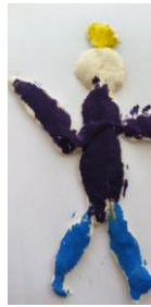
Resim 41: KŞ'nin Ürünü