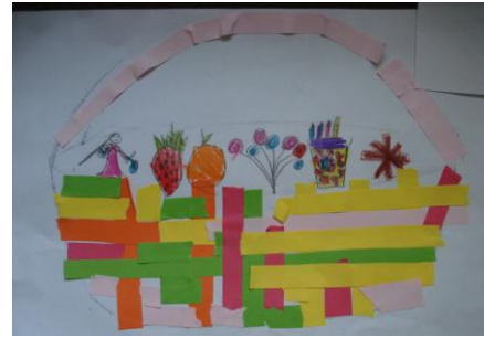
Resim 3 : Öğrencilerin yaptıkları sepetler

Yukarıdaki resimler; çocukların yaptıkları resimlerden sadece ikisidir. Çocukların kendilerini sepetçinin yerine koyarak yaptıkları sepetlerin içine; çiçek, oyuncak, meyve-sebze, yemek, bardak, vb. günlük hayatta kullandıkları nesnelere çizmeyi tercih etmeleri, onların sepetçilik mesleğini günlük hayatlarıyla ilişkilendirdiğinin göstergesi olarak yorumlanabilir. Ayrıca, EY’nin 3. diyalog s-14’te belirttiği “oyuncak”larını çizdiği resimde de betimlemesi dikkat çekmektedir. Resimler