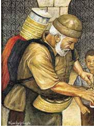
Resim 4: Şerbet satan usta

çocukların oldukça ilgisini çekmiştir. Bunun sebebi ise çocukların daha önce bu tür bir nesne görmemesidir. İbriğin incelenmesi esnasında KAP'nin " öğretmenim ama hiç ben vazoya elimi dokunmadım. " söyleminden, öğrencinin vazo şemasıyla ibrik şemasını birbirine karıştırarak Piaget'e göre bilgilerin yapılandırılmasında özümseme aşamasını yaşadığı anlaşılmaktadır. Yeni bir nesneyle ya da olayla karşılaşan çocuk, onu bir önceki şemaya dayandırarak anlamaya çalışır. Bu çocuğun özümseme sürecinde olduğunu gösterir. Eski şema yeni olayı anlamak için yeterli olmazsa; çocuk şemayı değiştirir ve uyum sağlama sürecine girerek yeni bir şema oluşturarak olayı ya da nesneyi anlar (Atikson ve diğerleri, 2002). Erken çocukluk döneminde çocuk ne kadar fazla nesne ve uyarıcıyla temas ederse o kadar şema oluşturur. Oluşturduğu bu şemalar sürekli olarak olgunlaşma ve yaşantı kazanma yoluyla değişime uğrayıp yeniden organize edilebilir olmalıdır (Senemoğlu, 2011). Böylelikle şema oluşturduğu kavramlar, bilişsel gelişime etki ederek öğrenme gerçekleşir. Bu etkinlik sayesinde de öğrenciler yeni şemalar oluşturarak yeni bir kavram öğrenmişlerdir.