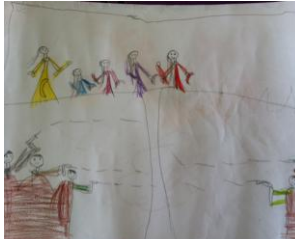
Resim 57: KFB'nin Resmi

KAP'nin okuduğu hikayelerdeki izlediği çizgi filmlerdeki masalsı kahramanları Çanakkale Savaşı'nın içine yerleştirdiği görülmektedir. Savaşın sonunda kötünün kaybetmesi iyinin kazanması bu durumun göstergesidir.