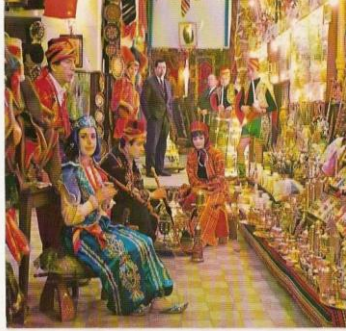
Resim 32: Osmanlı dönemine ait pazar görseli

Pazarcılık etkinliği iki aşamada gerçekleştirilmiştir. Birinci aşamada çocuklara Osmanlı dönemine ait pazar resimleri gösterilmiş; ikinci kısımda ise Osmanlı döneminde pazarcılık temalı drama yapılmıştır. Çocuklar eski meslekler etkinliklerinde hazırlamış oldukları ürünleri pazar kurarak satmışlardır.