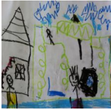
Resim 26: EFY'nin Resmi

KS yaptığı resimde, günümüz evi ile Osmanlı dönemine ait evi birebir karşılaştırdığı söylenebilir.