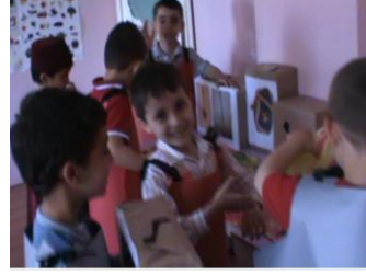
Resim 35: Osmanlı pazarcılık etkinliği

Yukarıdaki diyalog incelendiğinde; EFA'nın (s-1):" Kutucuuu, kutucuuuu." ve EY'nin (s-2): "Gel vatandaş gellll. Müzik aletleri. Gel vatandaşşşş gellll. En güzel müzik aletleri bende." söylemleri ile okul öncesi eğitim programında yer alan (MEB, 2006:24) "üstlendiği role göre konuşur" kazanımını gerçekleştirdikleri görülmektedir. Bu etkinlikte EY müzik kutusu, EFY sepet resimleri ve EFA sedef kutuları satan satıcı olmuşlardır.