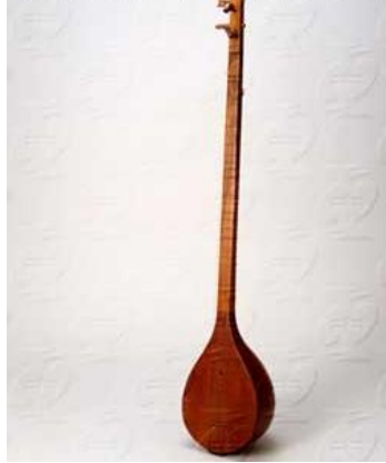
Resim 39: Kopuz