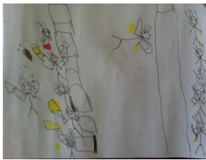
Resim 54: EFY'nin Resmi

KM'nin resminde saray çizmesi, bu olayın geçmişte yaşandığının farkında olduğunu göstermektedir. Çocuk savaşın sonucu olarak, insanların hayatının kaybettiğini konu alan bir resim yapmıştır.