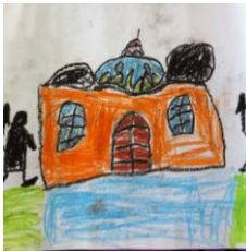
Resim 27: EY'nin Resmi

EFY'nin yaptığı resimde; günümüze ait evi standart bir ev şeklinde çizdiği ancak geçmişe ait sarayı kendi hayal dünyasında büyülü, sınırları olmayan bir yapı şeklinde resmettiği söylenebilir.