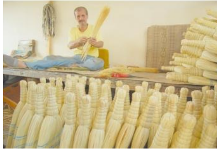
Resim 10: Biten süpürgeler

Bu etkinlikte; iki grup ayrı ayrı resimleri süpürgenin oluş ve yapılış aşamalarına göre sıraya koymuşlardır. Böylelikle okul öncesi eğitim programında (MEB, 2006:28) yer alan " olayları oluş sırasına göre sıralar " kazanımını gerçekleştirmişlerdir. Etkinlik sırasında çocukların birbirleri ile oldukça fazla etkileşim içinde oldukları ve bu etkinlikten büyük keyif aldıkları gözlenmiştir.