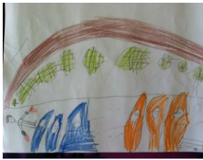
Resim 53: KM'nin Resmi

KS'nin durağan düş gücünü kullanarak yapılan dramayı resmettiği görülmektedir. Çünkü çizdiği karakterlerin görevleri ve eylemleri betimlenmemiştir.