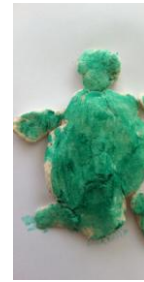
Resim 42: EY'nin Ürünü