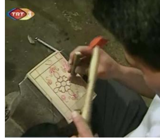
Resim 14: Şekil verilen resim oyulurken (s-3)