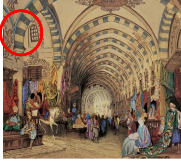
Resim 29: Çocuklara gösterilen Osmanlı Mimari Yapıları-2

KM'nin yaptığı resimdeki görsellerden çocuğun, geçmişi ve geçmişteki mimari yapıları eğlenceli yerler olarak düşündüğü şeklinde bir çıkarım yapılabilir.