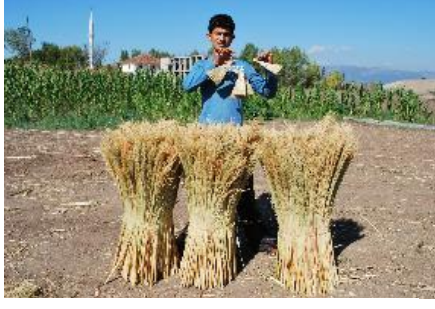
Resim 6: Süpürge otlarının yetişmesi