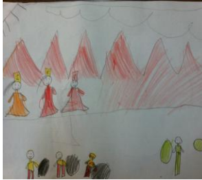
Resim 52: KS'nin Resmi

EAB'nın yapılan dramayı ve dramada arkadaşlarının üstlendiği rolleri resmettiği görülmektedir.