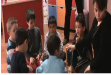
Resim 19: Eski meslekler bitiş etkinliği

mesleğe ait ürün oluşturmasıyla beraber, bu mesleklerin çocuklar tarafından anlaşıldığı görülmektedir.