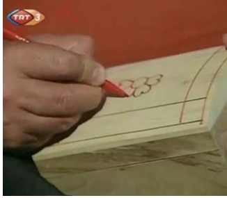
Resim 13: Sedef kutuya şekil verilirken (s-2)