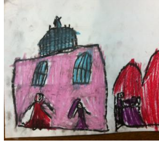
Resim 30: EFA'nin Resmi

EFA: Bu EA'nın giydiği pelerin. Şu bizim giydiğimiz kıyafet. Bu da saray.