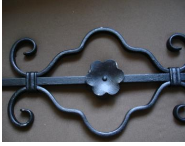
Resim 18: Sınıfa getirilen demir