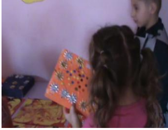
Resim 34: Osmanlı pazarcılık etkinliği