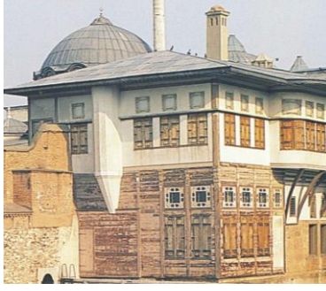
Resim 23: Çocuklara gösterilen Osmanlı Mimari Yapıları-1