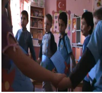
Resim 47: Nevruz Çiçeği

Nevrüzün tanıtılması aşaması bitirildikten sonra ertesi gün nevrüz etkinliğine devam edilmiştir. Nevruz etkinliğinin ikinci günü ve ikinci aşamasında " Nevruz Çiçeği " adlı oyun oynanmıştır. Bu oyunda " Nevruz " hikayesinde geçen " nevrüz kardeşliktir, nevrüz barıştır, nevrüz sevgidir, nevrüz dostluktur, nevrüz bolluktur, nevrüz umuttur, nevrüz coşkudur, nevrüz berekettir, nevrüz şenliktir, nevrüz birliktir " sloganları kartlara yazılmış ve her bir kart bir çocuğun boynuna asılmıştır. Böylelikle nevrüz sloganlarının mecaz anlamlarının farkında olmaları sağlanmıştır.