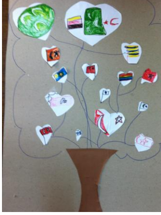
Resim 49: Bayrak Ağacı