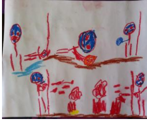
Resim 51: EAB'nın Resmi

EFA'nın yapılan dramayı resmettiği ancak dramanın temasını oluşturan yardımlaşmayı resmine yansıtmadığı görülmektedir.