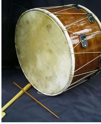
Resim 38: Davul