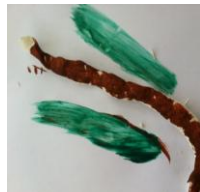
Resim 43: ET'nin Ürünü