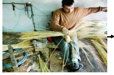
Resim 7: Süpürge otunun toplanıp bağlanması