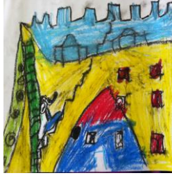
Resim 28: KM'nin Resmi

KM'nin yaptığı resimdeki görsellerden çocuğun, geçmişi ve geçmişteki mimari yapıları eğlenceli yerler olarak düşündüğü şeklinde bir çıkarım yapılabilir.