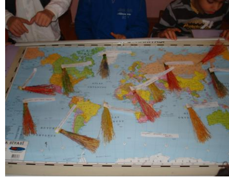
Resim 11: Öğrencilerin dünya haritası üzerine yerleştirdikleri süpürgeler.