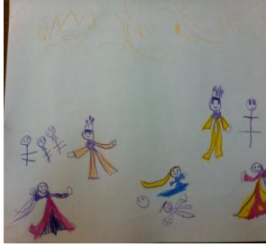
Resim 56: KAP'nin Resmi

EY'nin savaş ortamındaki olayları resmettiği görülmektedir.