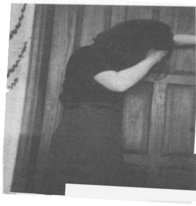
Şekil 1. Tematik Algı Testi (TAT) kartından esinlenen bir resim.

halattan yapılma alçak korkulukları da bu izlenimi pekiştirir. 70 metre aşağıda kayalar ve sığ ama hızlı bir akıntı vardır. Kontrol köprüsü, nehrin biraz daha yukarısında, sağlam, ahşap bir köprüdür. Ufak sığ bir derenin üzerinde bulunan bu köprünün yüksekliği yalnızca 3 metredir, korkulukları yüksektir ve ne yan yatar ne de sallanır. Köprüden geçen erkek denekleri karşıda çekici genç bir kadın karşılamıştır. Araştırma görevlisi olan kadın, araştırmanın hipotezinden habersizdir. Deneklere, psikoloji dersi için güzel manzaraların yaratıcılığın dışavurumu üzerindeki etkisiyle ilgili bir ödev hazırladığını açıklar, sonra da denekten kısa bir anketi yanıtlamasını ister. Anketin bir bölümünde denekten bir kadın fotoğrafına dayanarak kısa bir hikaye yazması istenir. Fotoğraf, Tematik Algı Testi (TAT) denen projektif bir testin parçasıdır.