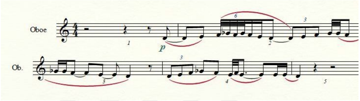
Görsel 21. 84- 87 ölçüler arası partisyon kesiti (Obua)

Ardından 84. ölçüde obua solosuyla devam eder.