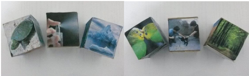
Şekil 1. Üçüncü Aşamada Öğrencilerin Fabl Yazmak İçin Kullandığı Zarlar

Bu etkinlikte amaç öğrencilerin zarları attığında üst tarafta kalan görselleri bir arada anlamlandırarak bir kurgu oluşturmaları ve bu kurguya uygun bir fabl yazmalarını sağlamaktır. Bu aşamada onlardan tamamen serbest bir fabl yazmaları da beklenebilir. Ancak bu durumda öğrencilerin en bilindik, daha önceden aşına oldukları bir konuyu baz almaları ve buna göre fabl oluşturmaları riskinin önüne geçmek için Şekil 1’deki zarlar hazırlanmış ve kullanılmıştır. Böylece karşıl arına çıkan görseller arasında anlamlı ilişkiler kurup kuramadıkları da ortaya çıkarılmaya çalışılmıştır. Tablo 7’de her bir öğrencinin kendi fabllarını yazmak için karşıl arına gelen temalar ve oluşturdukları fablların kısaca konuları özetlenmiştir.