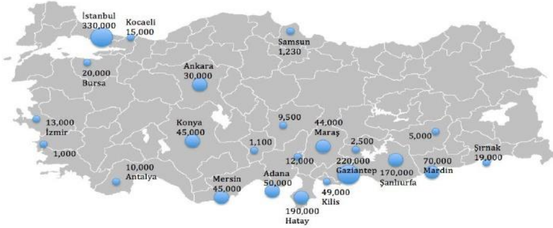
Şekil 1. Dillioğlu, Büşra, Mayıs, 2015 Tarihli UTGAM Raporundan Alınmıştır.

Suriyeli Ailelerin barınma durumları aşağıdaki haritada sayıları illeri gösterilmiştir.