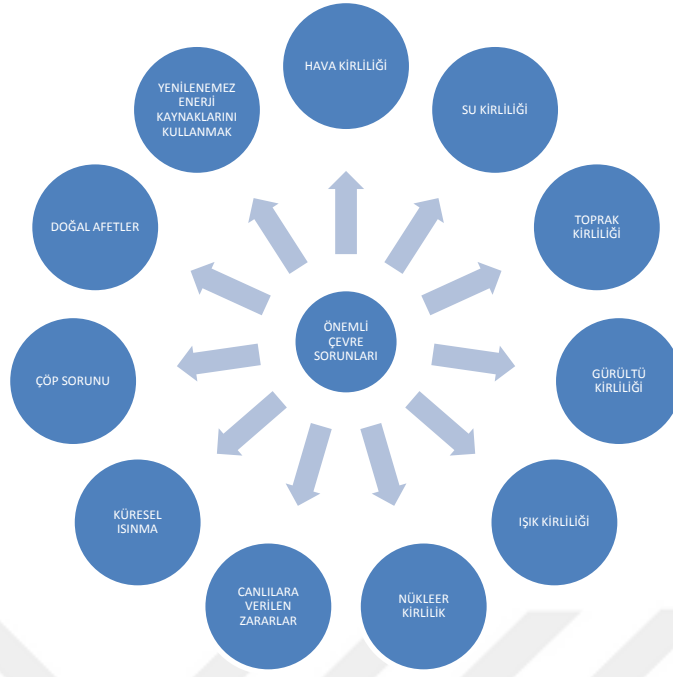
Şekil 10 Öğrencilerin önemli gördükleri çevre sorunlarına yönelik görüşleri

Öğrencilerin en önemli gördükleri çevre sorununa yönelik görüşleri tablo 30’da verilmiştir.