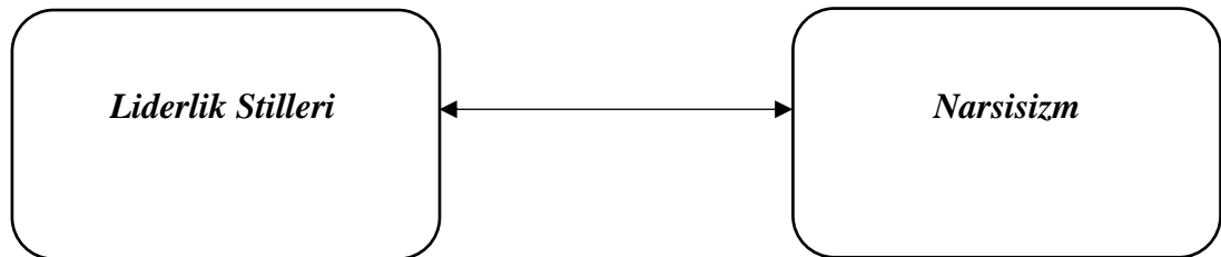
Şekil 1. Araştırmanın Modeli

Araştırmanın modeli aşağıda yer almaktadır.