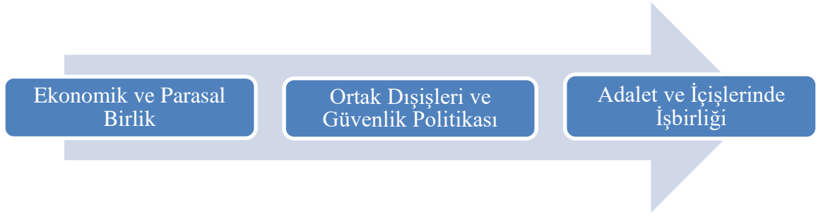
Şekil 1 : Maastricht Anlaşması ile Oluşturulan 3 Sütun