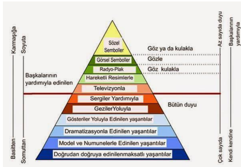
Şekil-1 Edgar Dale yaşantı konisi

Öğretici ile öğrenen arasında öğretim etkinliği sırasında mesaj alış verişini olarak tanımlanan iletişimin kurulması gerekmektedir. Teknolojik gelişmelerle ortaya çıkan araç, gereç ve materyallerden bazıları tek bir duyu organımızı etkilerken, bazıları da birden çok duyu organımızı etkilemektedir. Edgar Dale'in ortaya koyduğu yaşantı konisi eğitim araçlarını bu süreçte sınıflandırmaya yardımcı olmaktadır (32).