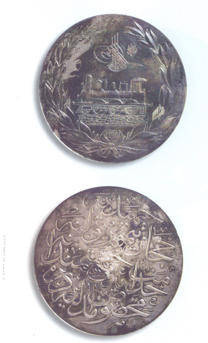
Ek 9. Necip Niyazi Efendi'ye verilen Hamidiye-Hicaz Demiryolu Madalyası örneđi. Edhem Eldem, İftihar ve İmtiyaz Osmanlı Nişan ve Madalyaları Tarihi , s.328-329.