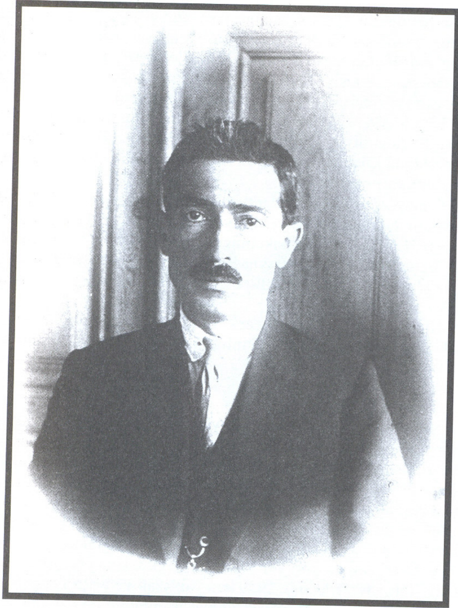
HAFIZ SABRİ BEY

Ek 7. Ahmed Sabri Efendi'nin resmi. Ünal Türkeş, Atatürk'ün Etrafındaki Muğlalılar , s. 40.