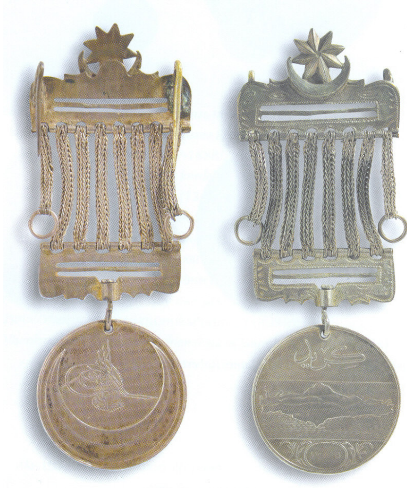
Ek 10. İbrahim Edhem Efendi'ye verilen Girit Madalyası örneđi. Edhem Eldem, İftihar ve İmtiyaz Osmanlı Nişan ve Madalyaları Tarihi , s.248