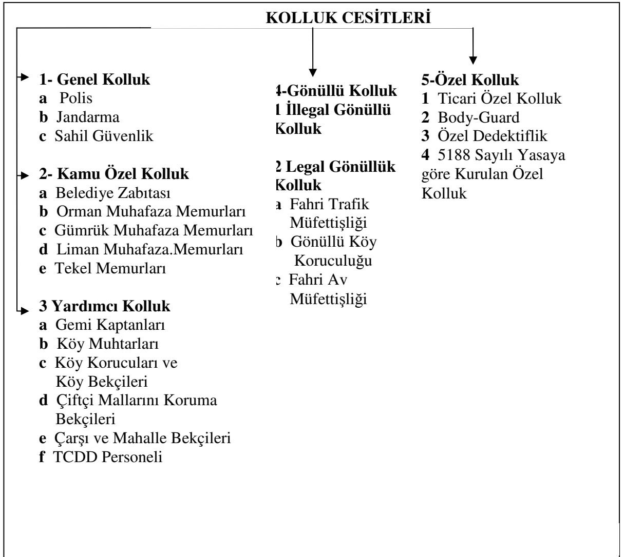
Tablo 1: Kolluk Sınıflandırılması