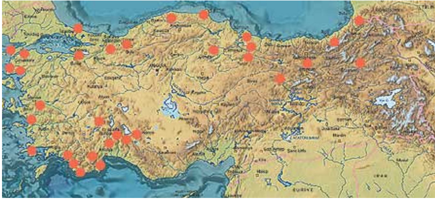
Şekil 2: Kırsal turizme yönelik TATUTA projesi uygulanan alanlar