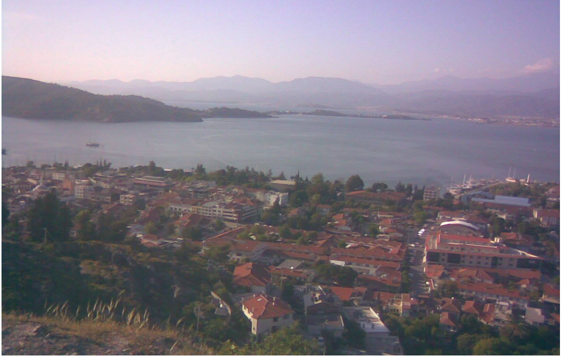
Fethiye'den bir görünüm