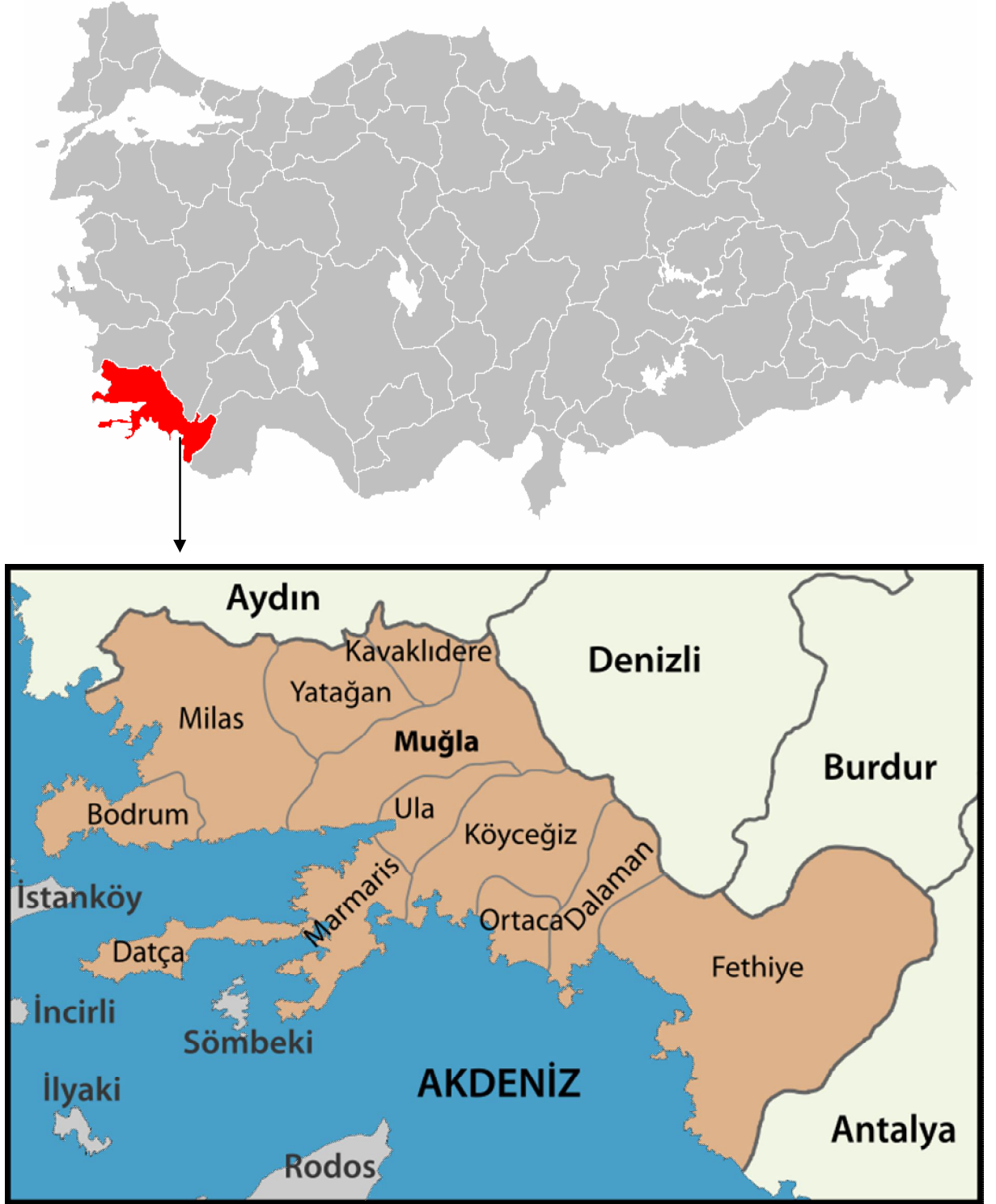
Şekil: 3- Fethiye'nin Coğrafi Konumu