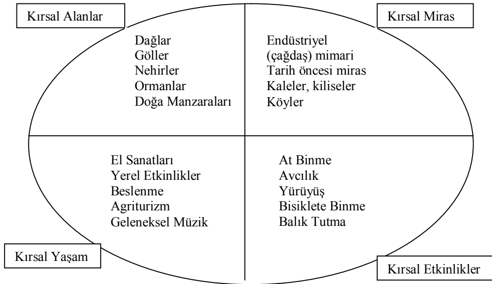
Şekil 1: Kırsal Turizm Kavramı (Kırsal Turizm Bileşenleri).