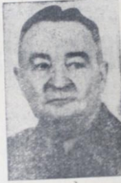
Amerikan Askeri Yardım Heyeti Başkânı Tümgeneral Armetead (Üst Foto serisi)

Bu arada Singapur'dan Hindistan'a gelmekte olan bir gemide de grip salgını baş gösterdiği ve vapurunu Madras limanında karantinaya alındığı bildirilmektedir.