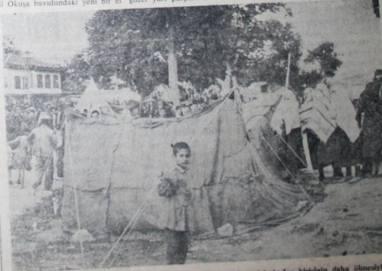
Muğla hastahanesinde tedavi görmekte olan zelzele felâketzedelerinden birinin daha ölmesiyle ölü adedi 22 ye yükselmüştür. Fethiye ve livalisinde zelzeleler devam etmesiyle besaber halk her an yeni bir tehlike ile karşılaşmaktan korktuğu için geceleri sokakta yatmaktadır. Yalıbardaki resimde Milâsa sokaklara çadır kuran halkı görüyoruz.

Daha dün mühtiş bir felâkete uğramış Fethiyelilerin hepi Devlet millet ve vatan sağ olsun diyorlar. Ve gözlerinde büyük bir felâketin dâbepi yerine asim, ümit ve himadin şuleleri parlıyor. Bizi hep beraber ve her yerde güler yüzle karşılıyorlar. Fethiyeliler, bu hâdisinde aldannıyorlar. Çünkü, siyasi birliği kadar içtimai tesanid bağları da son derece kuvvetli bir milletin evlâtlarıdır. Aynı zamanda Türkiye'yi iki yüze karşıyorlar. Fethiyeliler, bu hâdisinde aldannıyorlar. Çünkü, siyasi birliği kadar içtimai tesanid bağları da son derece kuvvetli bir milletin evlâtlarıdır. Aynı zamanda Türkiye'yi iki yüze karşıyorlar. Fethiyeliler, bu hâdisinde aldannıyorlar. Çünkü, siyasi birliği kadar içtimai tesanid bağları da son derece kuvvetli bir milletin evlâtlarıdır. Aynı zamanda Türkiye'yi iki yüze karşıyorlar.