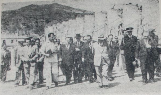
Devlet ve Hükümet Reislerimiz zelzele bölgesine gelirken Aydıncık kasa tavakkulları sırasında

Fethiye rıhtımı göçtü - Fethiye'deki tahribatı gözleri ile gören Devlet ve Hükümet Reisleri, "Fethiye en kısa zamanda Akdeniz gerdanlığında güzel bir inci olarak parlayacaktır," dediler - Bayar ve Menderes dün öğleden sonra zelzele bölgesinden ayrıldılar