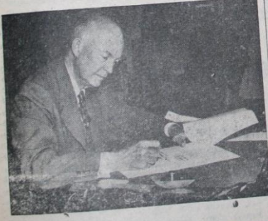
Washington, D.C. — Reiskumhur Eisenhower yeni Ortadoğu Plânına dair plânı bundan bir müddet evvel imzalamıştır. Bu suretle alıakalî kanunlar resmen mer'iyete girmiştir. Birleşik Milletler Ortadoğudaki her hangi bir memleket komünizminin tecrübesine uğraz ve Birleşik Amerikan yardımını talebederse, Birleşik Amerika derhal yardımına koşacaktır.

Vaşington (Radyo) - Amerikan Kızılhaçı (Red Cross) Türkiye'deki deprem felâketlerine 5.000 dolarlık yeni bir yardım dafası yapacağını açıklamıştır. Bu yeni yardım bu ay başlarında Amerika Kızılhaçı tarafından gönderilen 5 bin dolarlık Amerika Kızılhaçı gençlik teşkilatına üyelerine gönderilmek üzere sağlanmıştır.