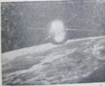
400.000 kara indik bir sahneye kapaktan fotoğraf 1955 senesinde Amerika Bayrıtıyolüne mensup de 143.4 mil kuzeyden Birleşik dünya tarafındaki seyahalet emsa Vikiing 17'iden alınmıştır. Peykin emsa bu bilgilere bir kuzey ince etmiştir.