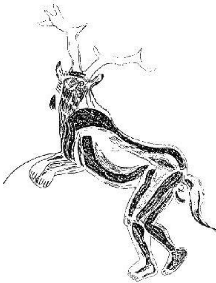
ŞEKİL-1-Therianthrop. Güney Fransa'daki Trois Frères mağarası.

Güney Afrika'da yaşayan San halkının mitolojisinde sıklıkla karşılaşılan önemli bir imge, insan/hayvan ya da therianthrop denilen yaratıktır. Şamanların sanrı esnasında gördükleri ve Üst Paleolitik sanatının önemli bir unsuru olan bu yaratık yine bu biçim verme çabasının önemli bir yansımasıdır. Bu her ne kadar sanrı esnasında görülen imgelerden biriye de Üst Paleolitik ressamı için atlar ve bizonlar kadar gerçektir (Leakey, 1996: 125,126).