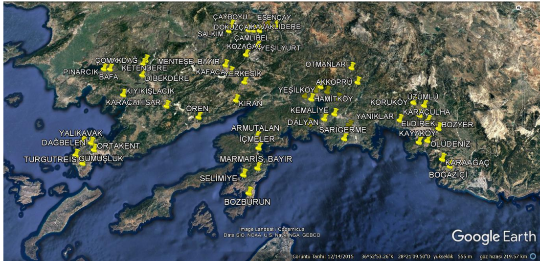
Harita 4.1: Örneklem kapsamında ulaşılan mahalleler