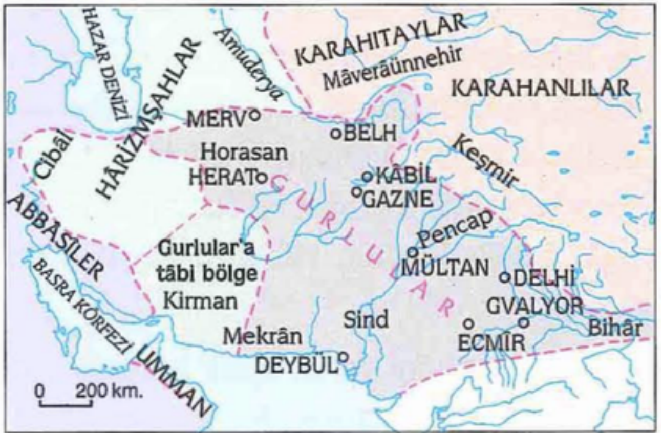
EK: V GURLULAR HARİTASI