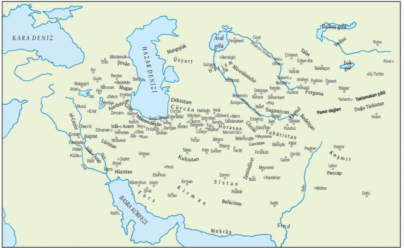
EK III: HÂRİZMŞAHLAR HARİTASI