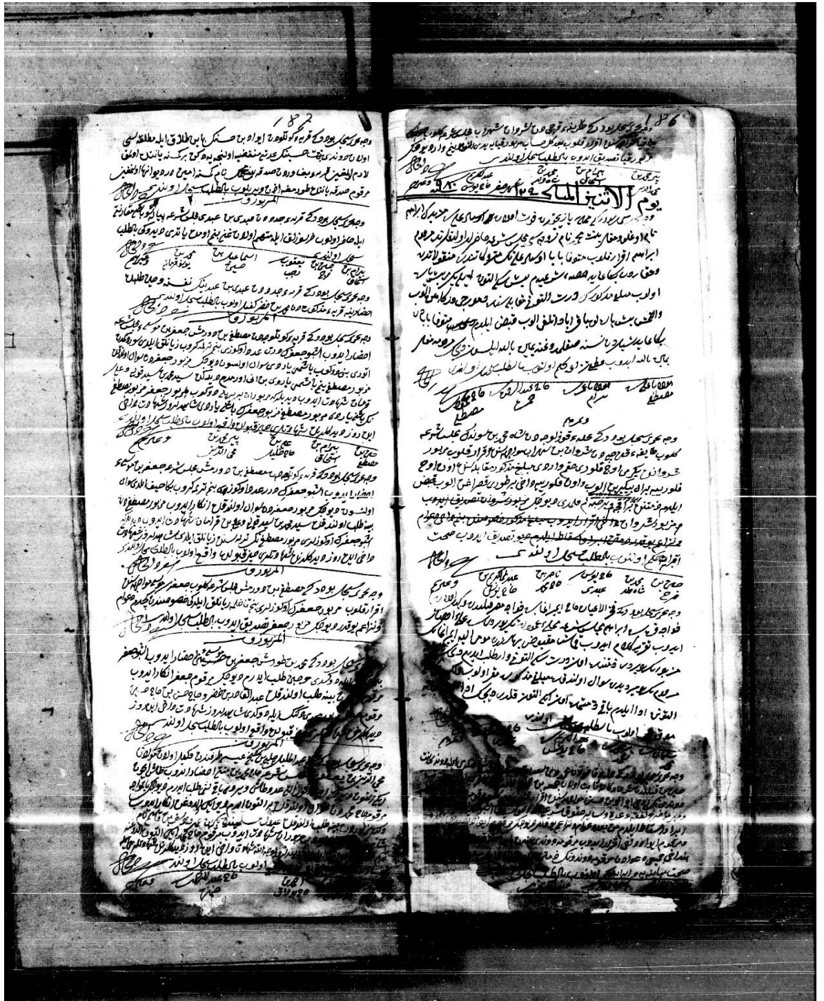
Ayıntâb Şer'iyye Sicili No 6, 186/187.