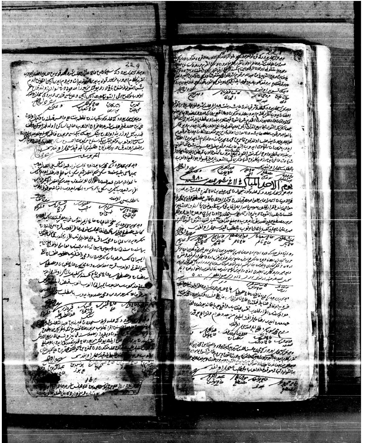
Ayıntâb Şer'iyye Sicili No 6, 228/229.