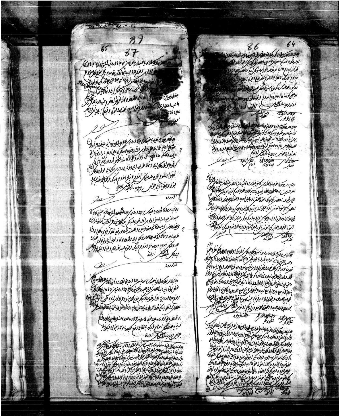
Ayıntâb Şer'îyye Sicili No 4, 64/65.