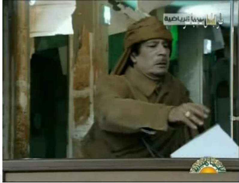
Resim 7. Konuşmanın sonunda, Kaddafi bir kâğıt teslim edildi