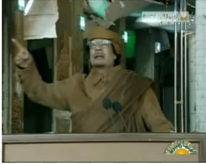
Resim 10. Kaddafi Libya'nın şehitler hakkında konuştuğunda parmağıyla işaret ederken