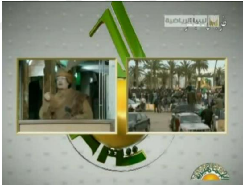
Resim 4. Kaddafi ve paralel olarak yeşil sahada Libyalılar