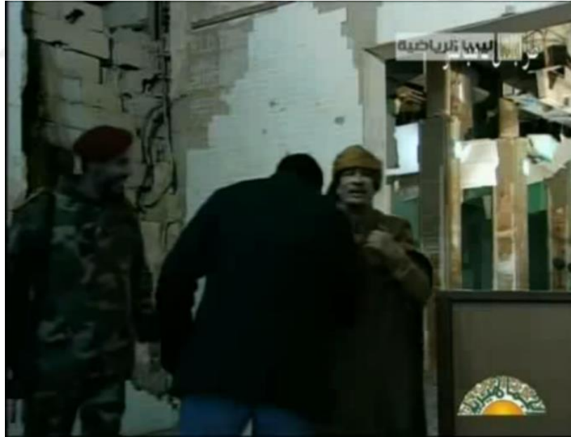
Resim 8. Konuşma bittikten sonra bir adam Kaddafi'nin elini öper