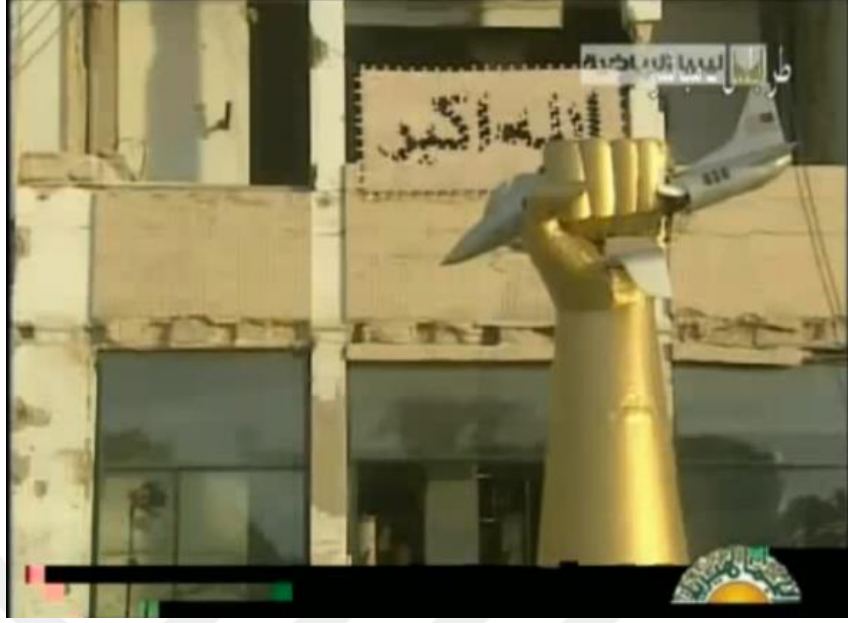
Resim 5. Kaddafi'nin konuştuğu binanın dışı

- Kaddafi'ye su veren bir adam var. Sonunda Kaddafi'ye ifadeleriyle ilgili medyadaki en son güncellemeleri ve yorumları okuduğu kayıt verilmiş.