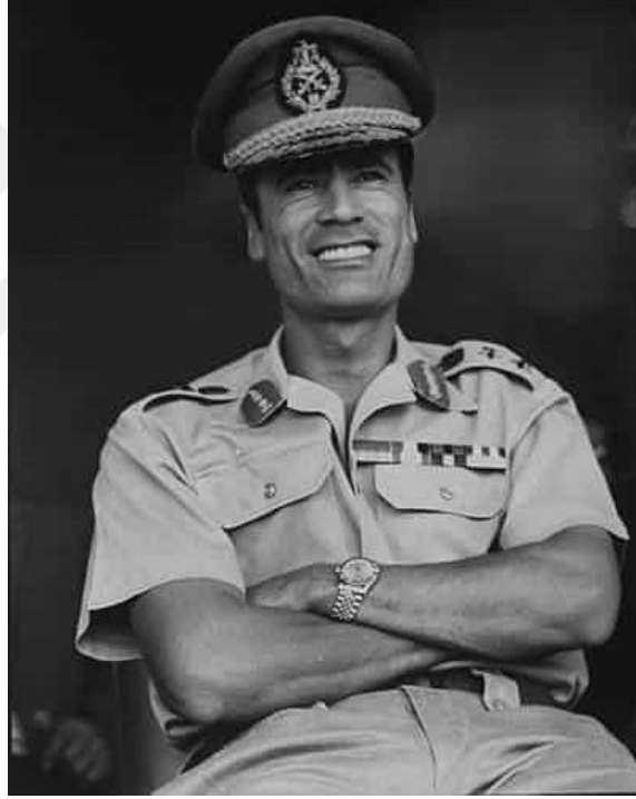
Resim 1. 1971 Ordu kıyafetiyle genç Muammer Kaddafi (Spencer, 2011)