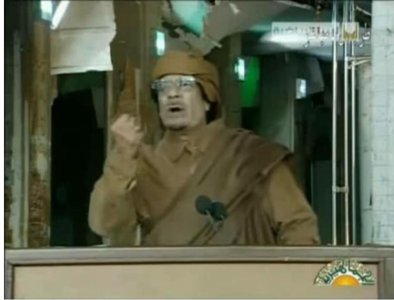
Resim 13. Kaddafi'nin yumruk yaparken