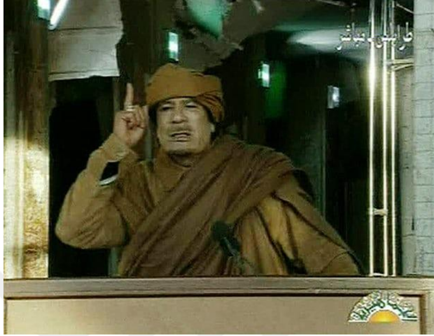
Resim 2. 22 Şubat 2011 Kaddafi, Libya milletini devlet televizyonuna yöneltiyor, protestocularla mücadele etmeye ve şehit düşmesine söz veriyor