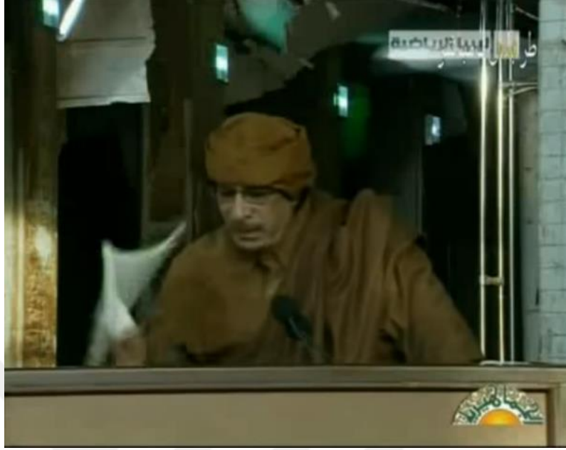
Resim 14. Kaddafi Libya ceza yasasıyla podyuma vurur