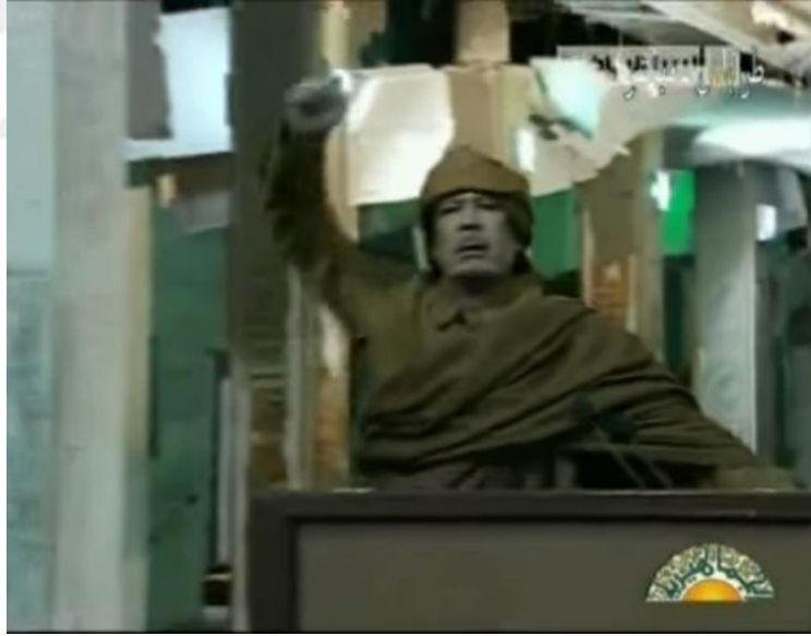
Resim 17. Kaddafi insanları devrime çağırırken yumruğunu yukarıda tutar