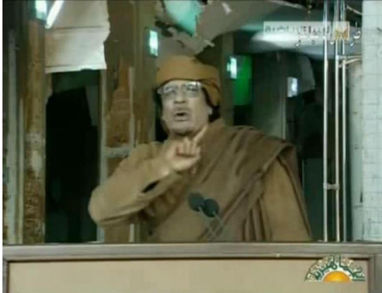
Resim 15. Kaddafi işaret parmağıyla reddetme veya imkansızlığı ifade eder