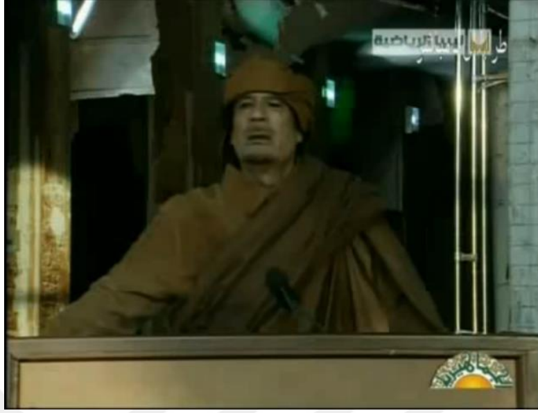
Resim 16. Kaddafi her iki ellerini de podyumda bırakır