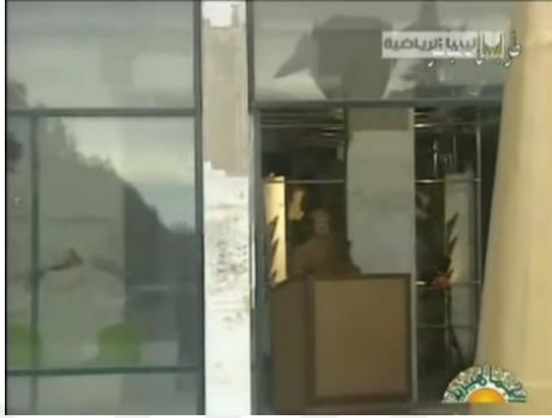
Resim 3. Kamera geniş bir açıdan başladıktan sonra yavaşça Kaddafi'ye odaklanır