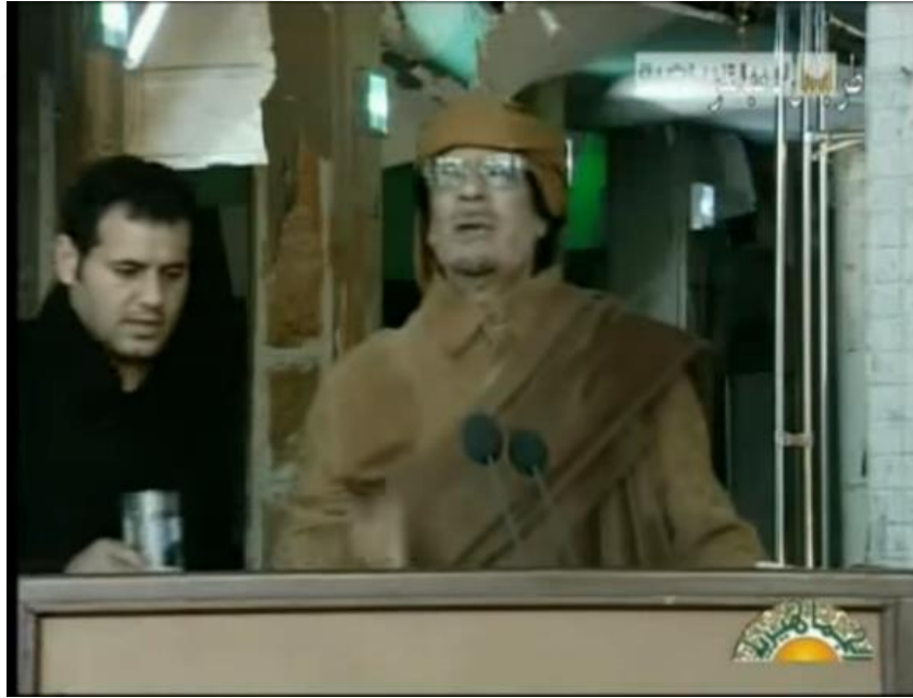
Resim 6. Kaddafi 'ye su vermek için konuşmasında bir adam ortaya çıktı

- Kaddafi'ye su veren bir adam var. Sonunda Kaddafi'ye ifadeleriyle ilgili medyadaki en son güncellemeleri ve yorumları okuduğu kayıt verilmiş.