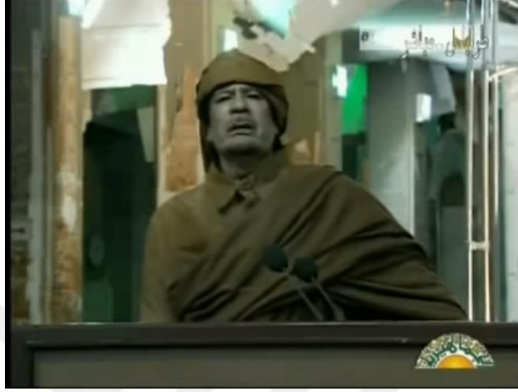
Resim 18. Kaddafi'nin endişelen yüz ifadesi

etmek istediğinde, yüzleştirilen yüz ifadesi kullanıyor. İnsanlarına daha yumuşak bir tonda konuştuğunda yüz ifadesini de değiştirir.