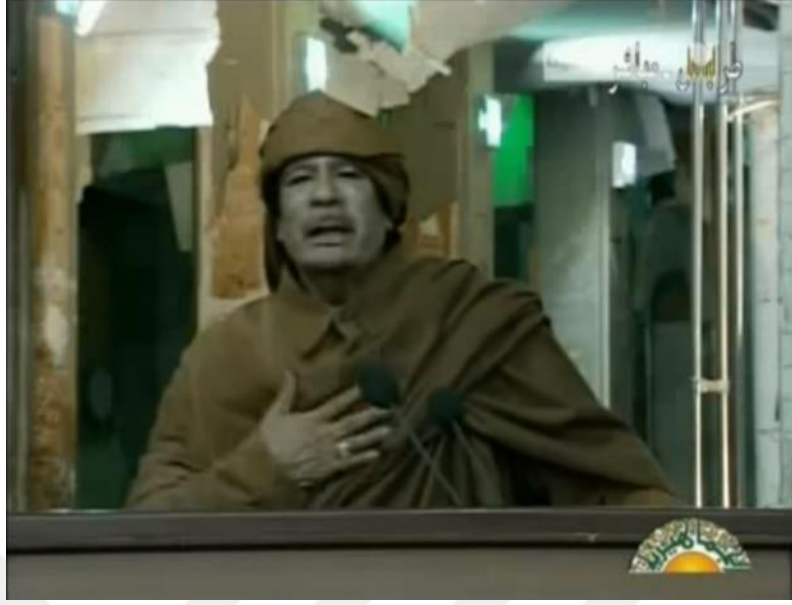
Resim 12. Kaddafi avucunu göğsünde tutar