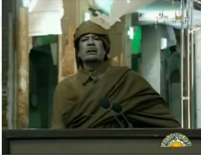
Resim 9. Kaddafi podyuma vururken