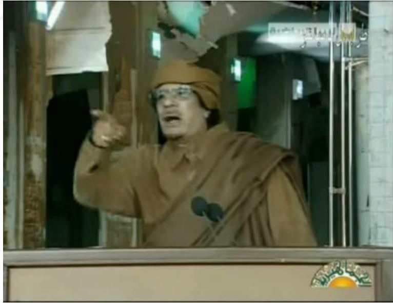
Resim 11. Kaddafi emperyal güçleri suçlamakta parmağıyla işaret ederken