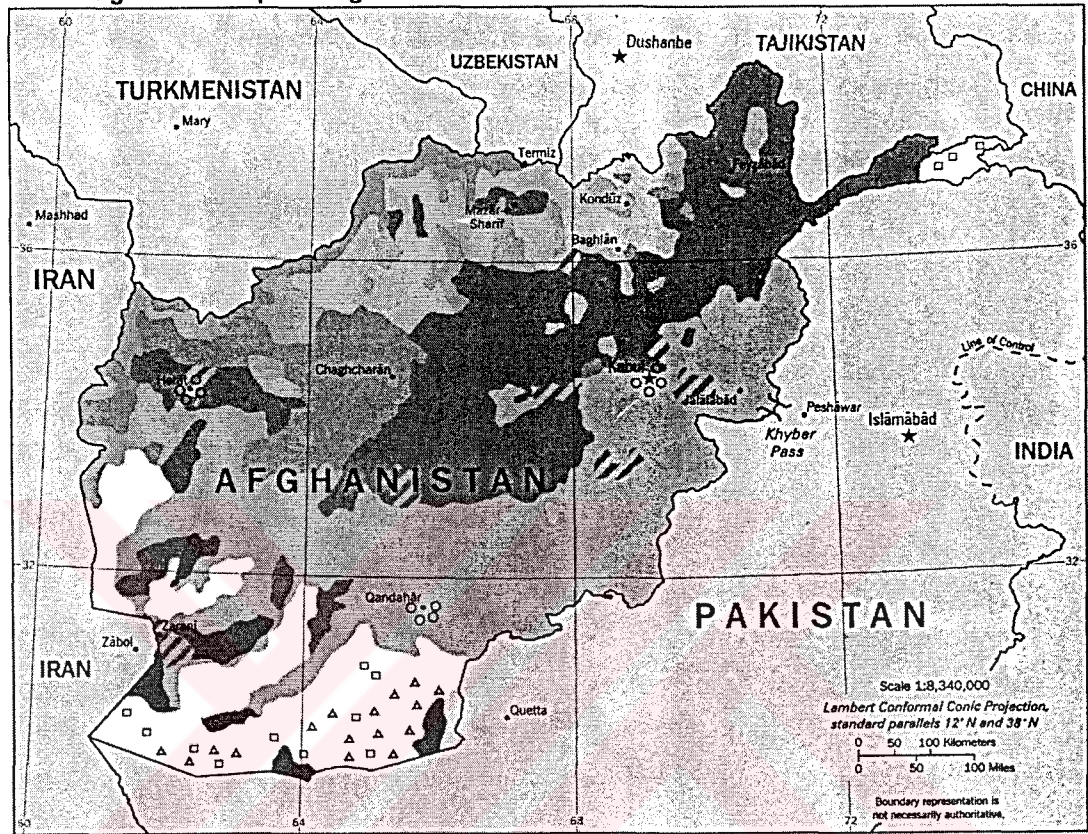
Ethnolinguistic Groups in Afghanistan