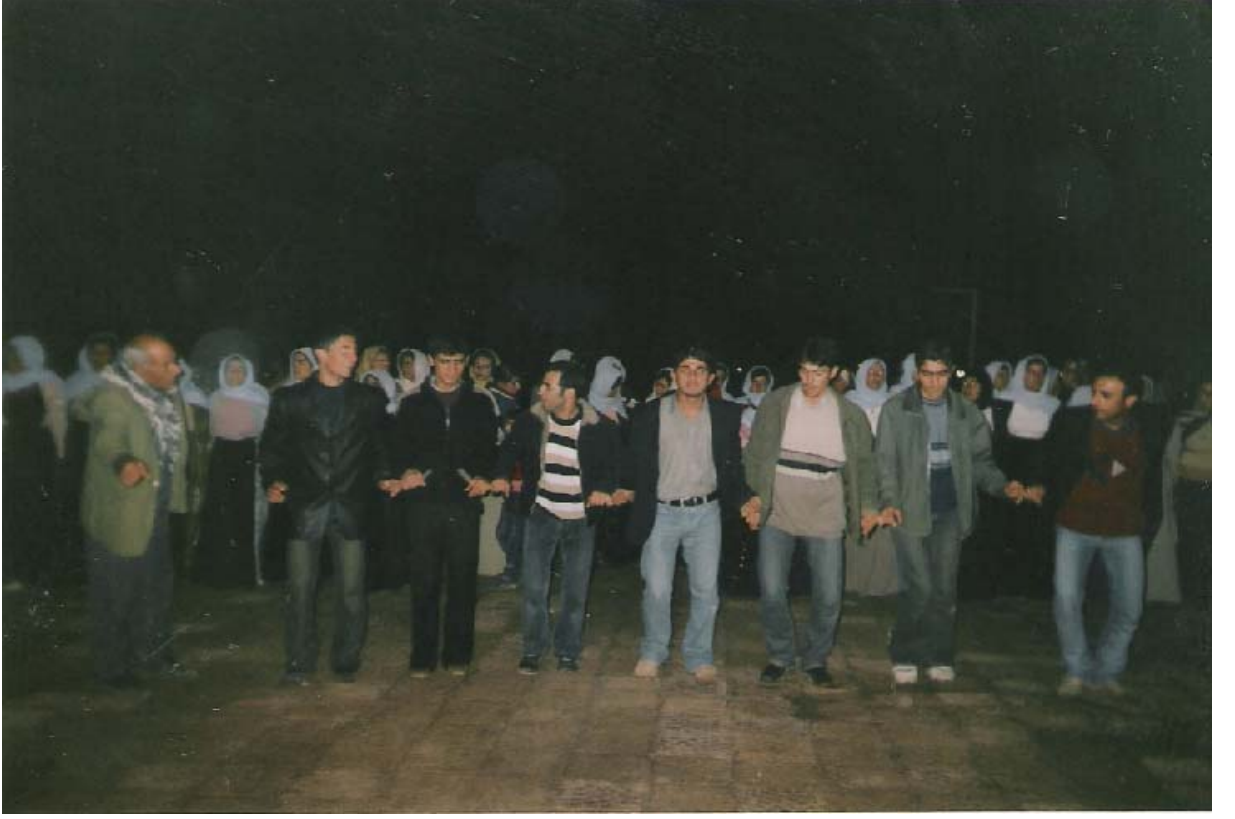
Ek-9 Kına gecesinde halay çekerek eğlenen gençler