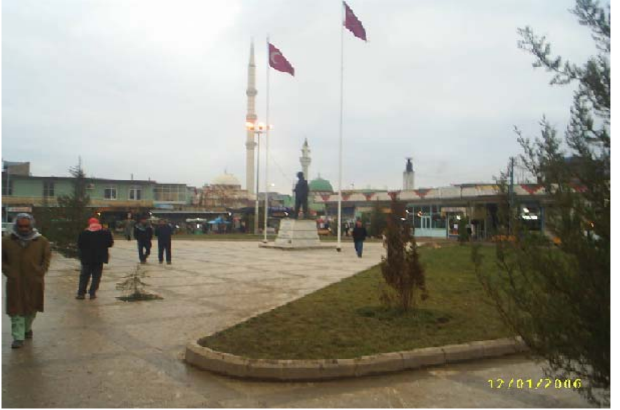
Ek-3 Suruç Cumhuriyet Meydanından görünüm