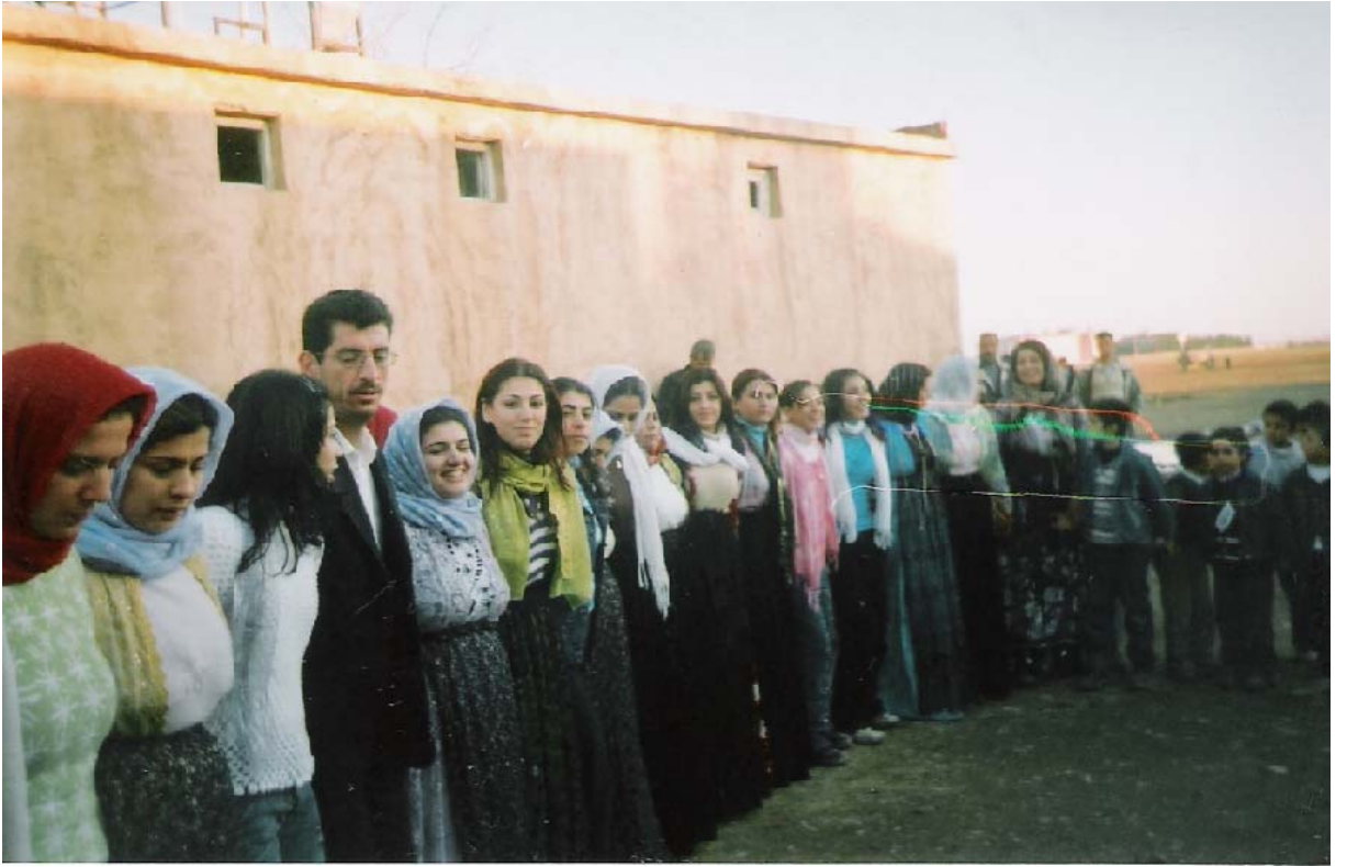
Ek-8 Düğünde halay çekerek oynayan misafirler