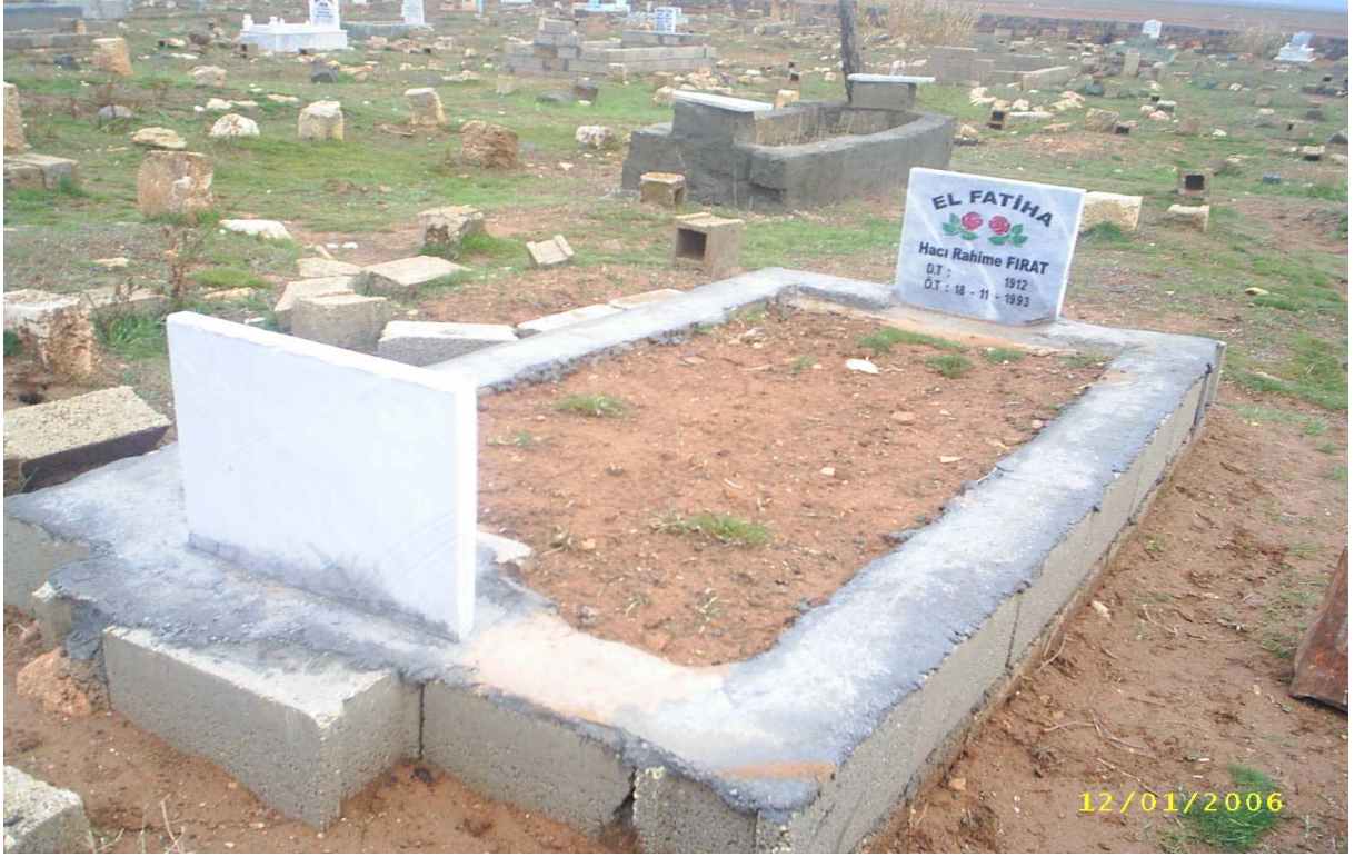
Ek-13 Mezarın baş tarafına dikilen ad, soyad, doğum ve ölüm tarihlerinin yazıldığı mermer