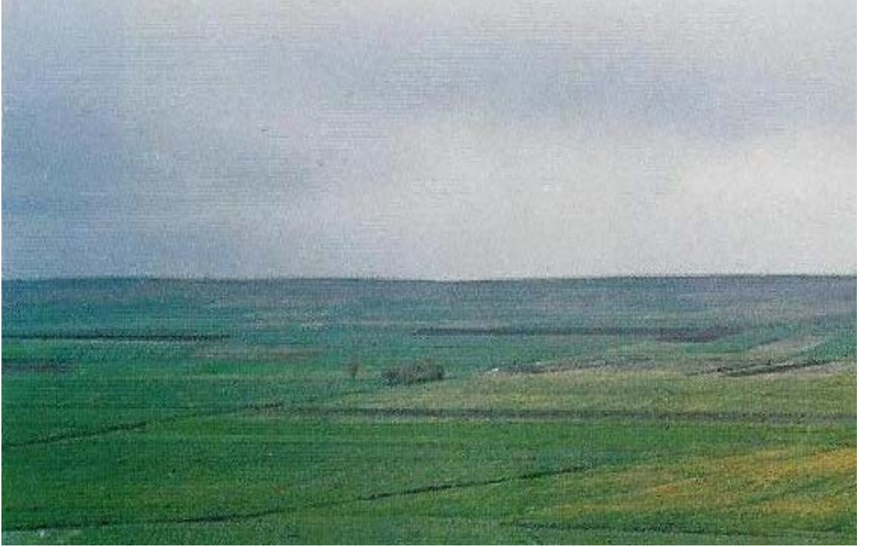
Ek-5 Suruç Ovasından bir görünüm