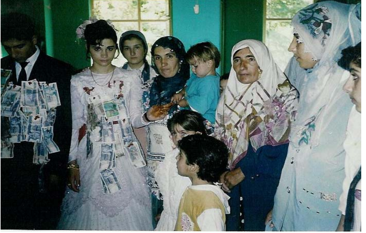
Ek-7 Nişanlanan kız ve erkeğe takı takılırken