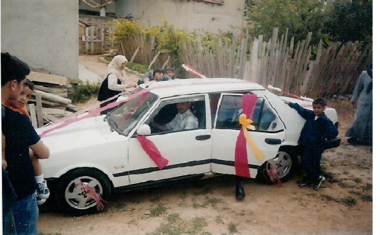
Ek-10 Gelin arabasıyla gelin almaya gidilirken