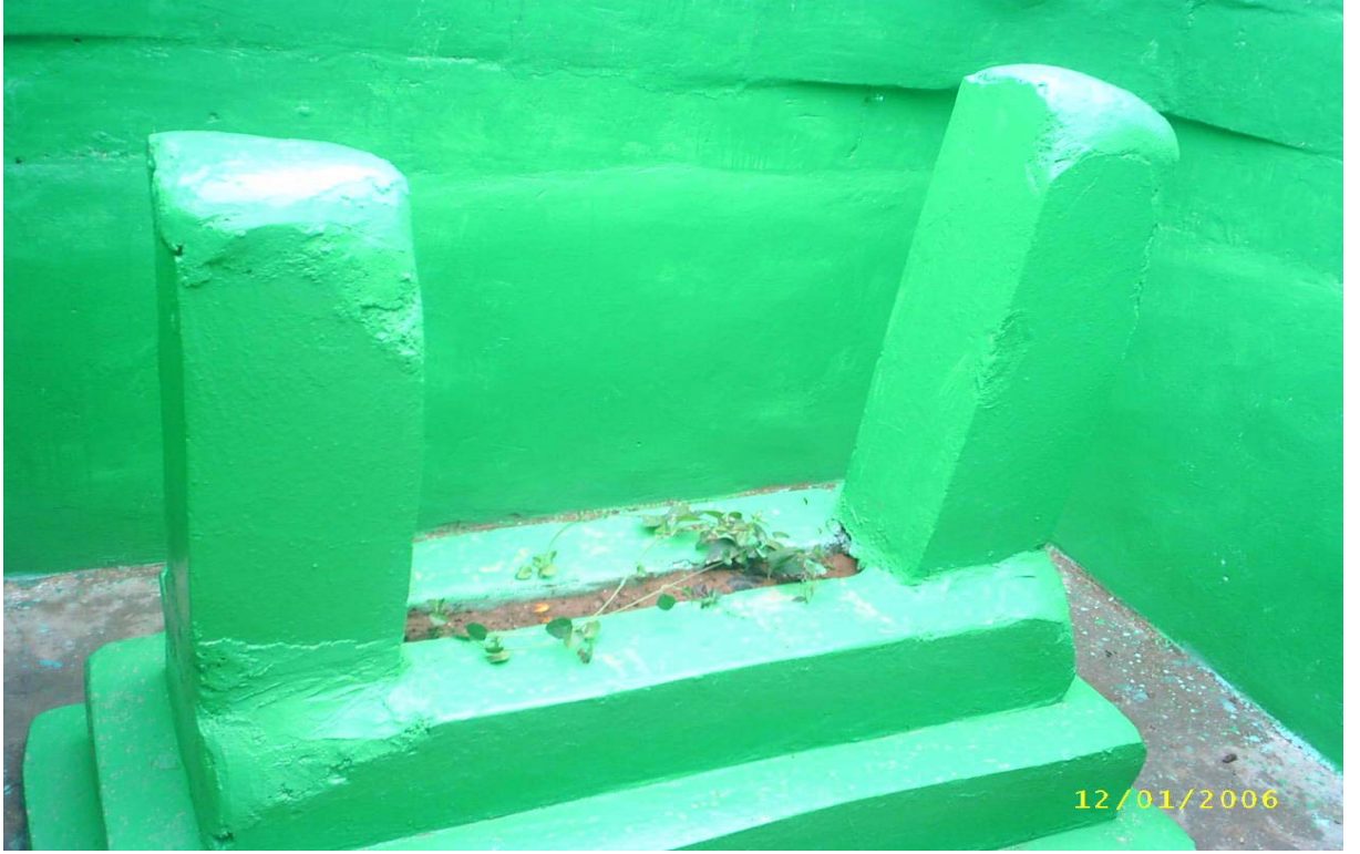
Ek-15 Şeyh Nasır Türbesinin İç Görünüşü