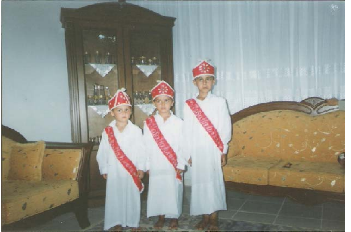
Ek-6 Sünnet elbisesi girmiş çocuklar