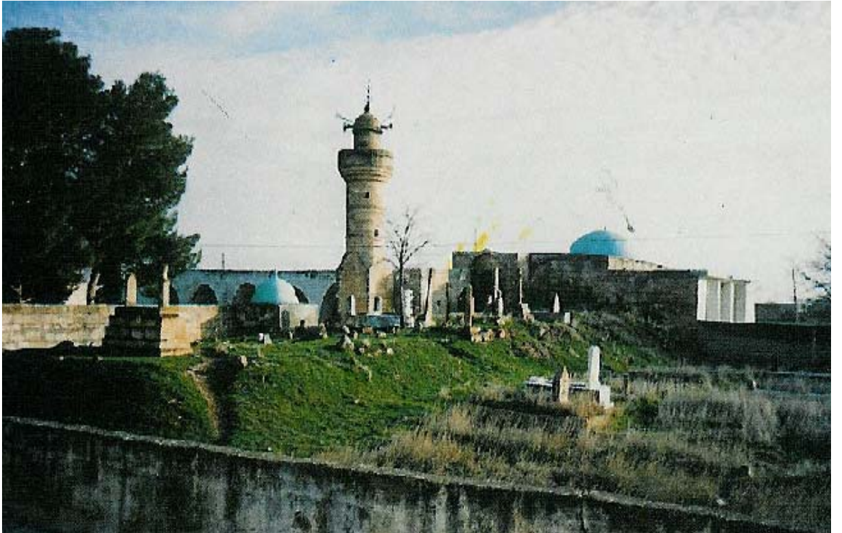
El-14 Şeyh Müslüm Türbesi