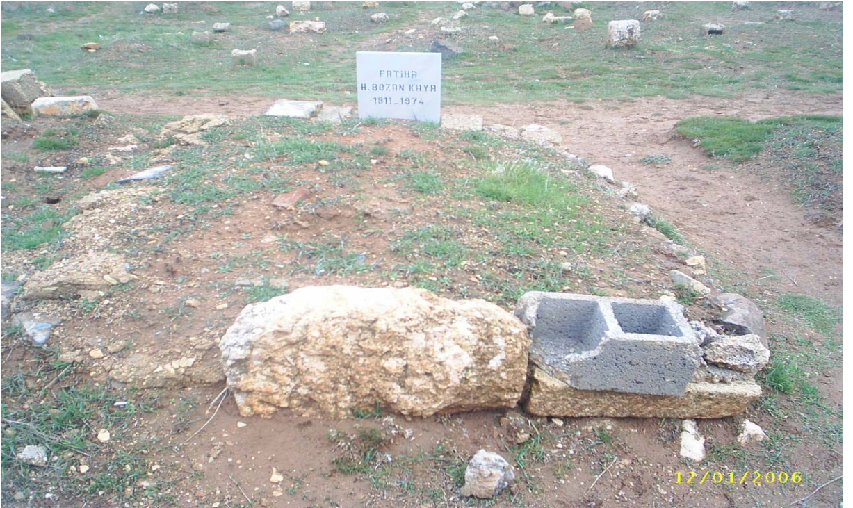
Ek-12 Mezarın baş ve ayak tarafına dikilmiş taş