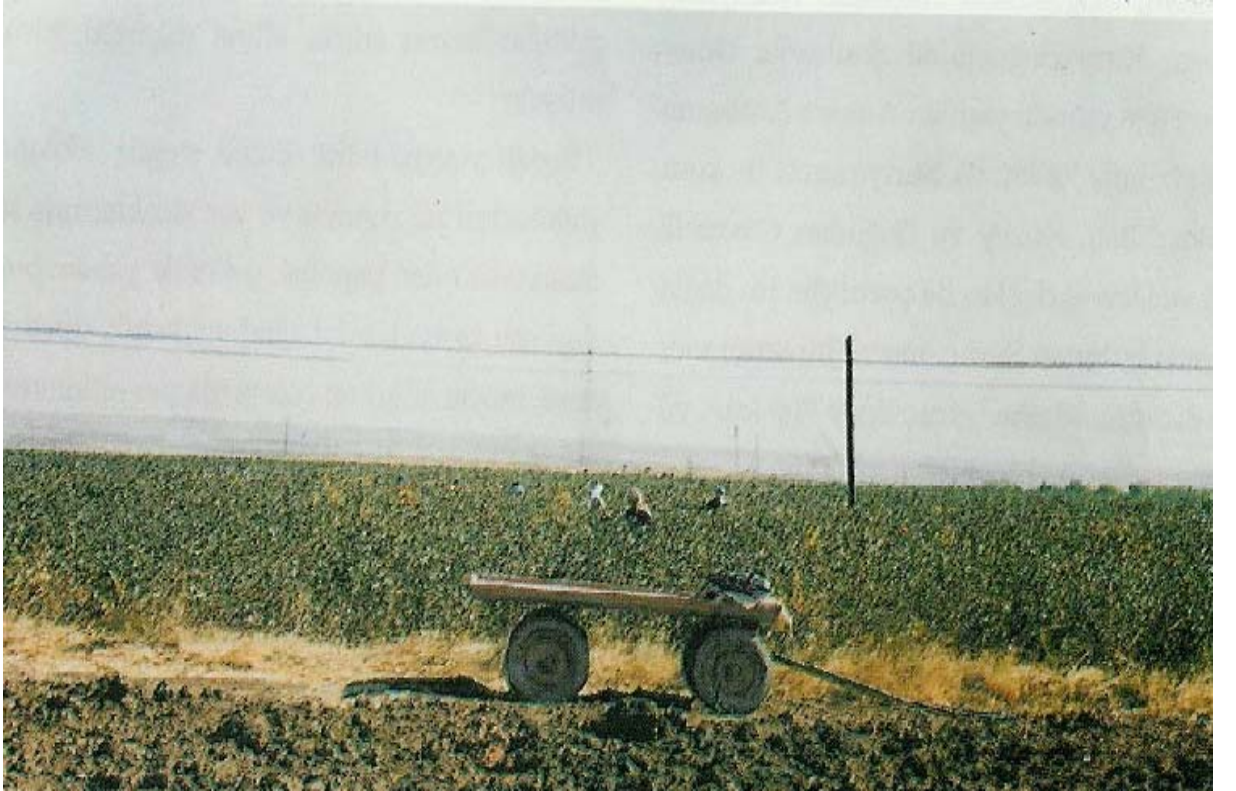
Ek-4 Suruç'ta pamuk toplayan kadınlar