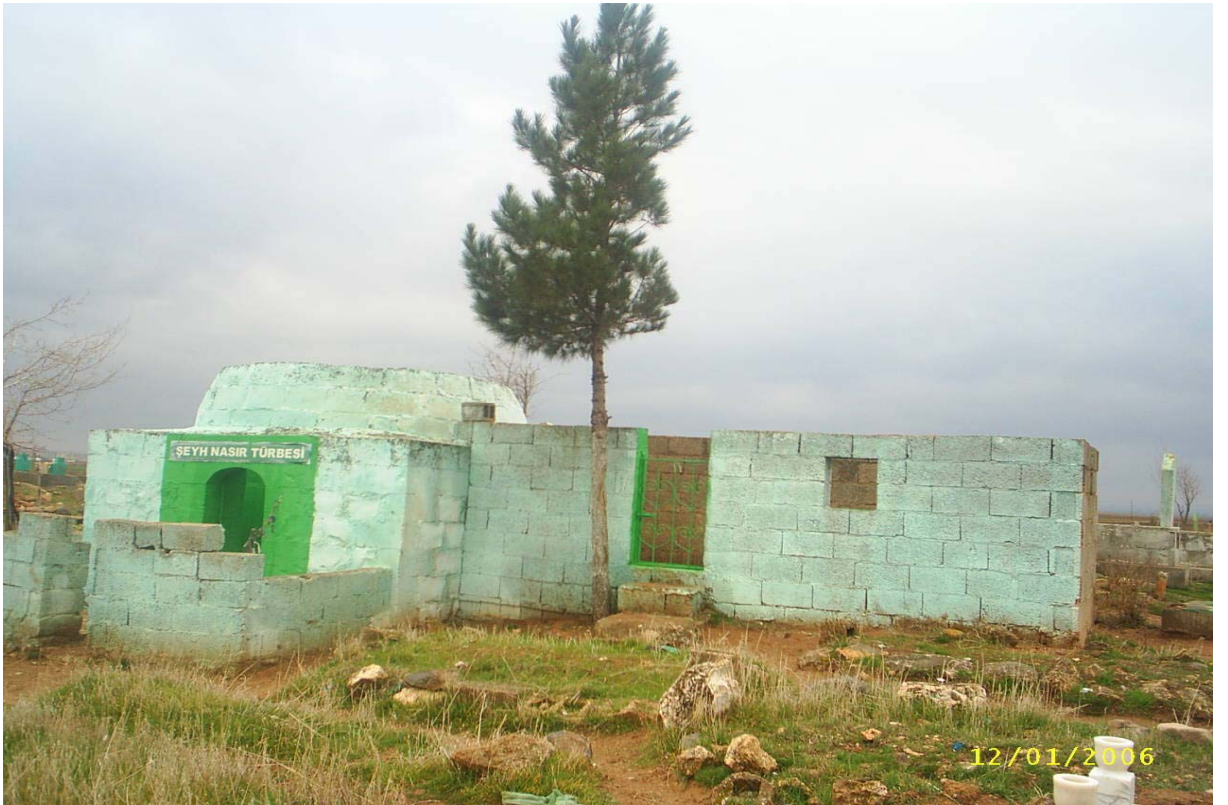
Ek-16 Şeyh Nasır Türbesinin Dış Görünüşü