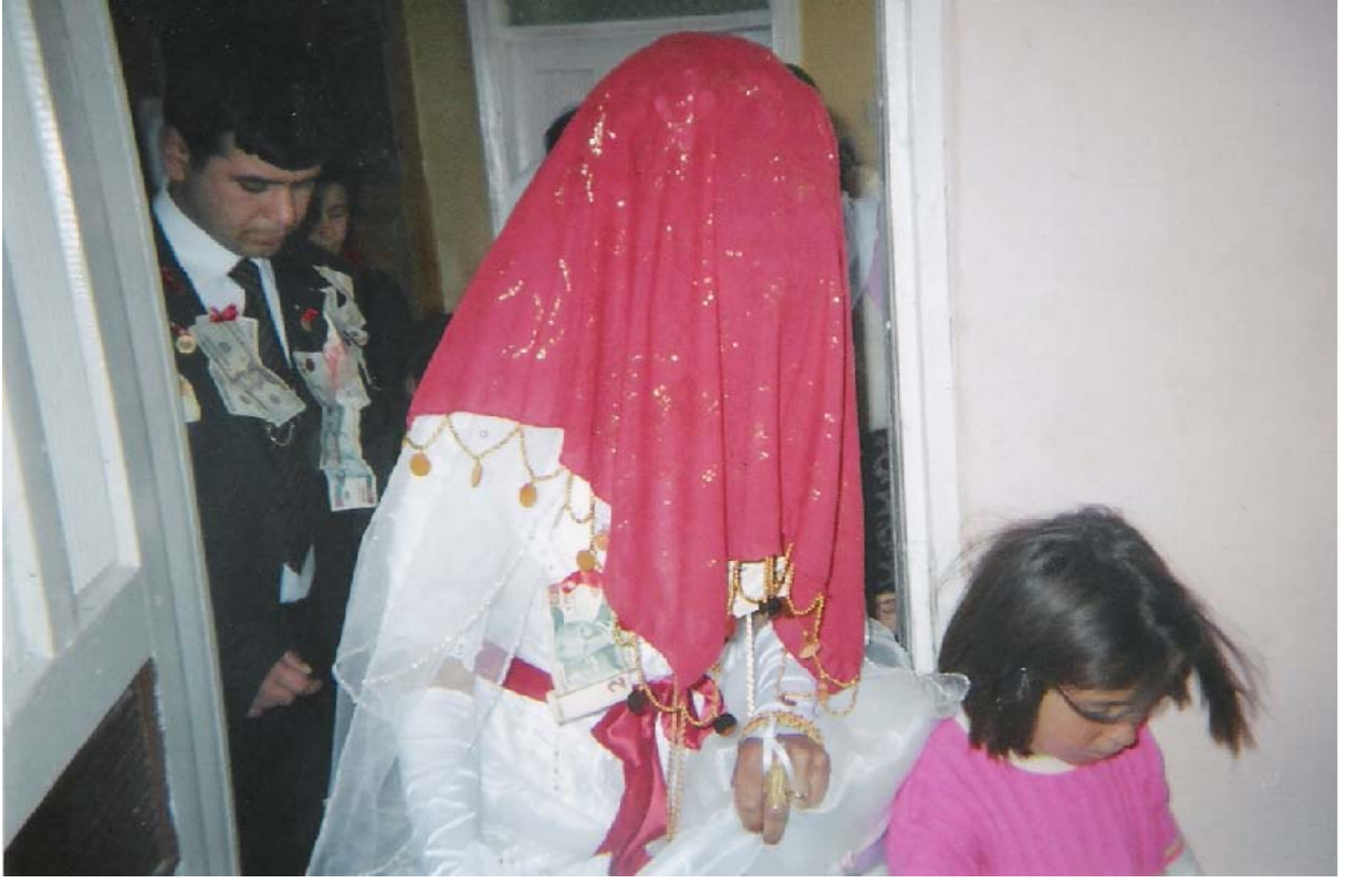
Ek-11 Al duvaklı gelin damat evine getirilirken