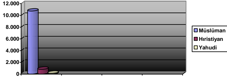
Gazze Sancak Nüfusu