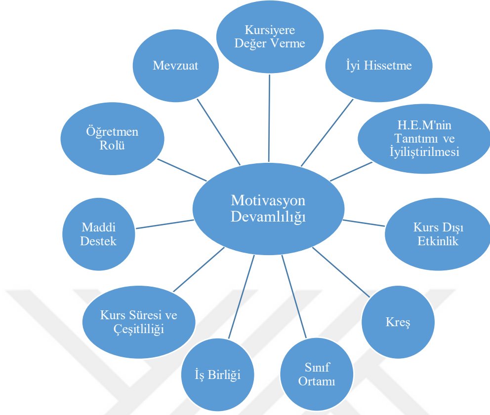
Şekil 3: Kursiyerlerin eğitim sürecinde motivasyonlarının devamlılığını sağlayan ve arttıran unsurlar

Araştırmada alan yazındaki diğer çalışmalardan farklı olarak, kursiyerlerin motivasyonlarının devamlılığını sağlamaya ve arttırmaya yönelik öneriler elde edilmiştir. Araştırma sonucuna göre; kursiyerlerin buldukları ortamda ve etkinliği yaparken kendilerini iyi hissetmelerine önem verilmesi, kursiyerlerle kurs dışı etkinlikler düzenlenmesi, kursta yapılan etkinliklerin kursiyerlerin işine yarayacak türden seçilmesi, kursiyerin kurs sonunda maddi kazanç elde edebilecekleri imkanların sağlanması ve kursiyere kur için maddi destek sağlanması, Halk Eğitim Merkezlerinin fiziki şartlarının iyileştirilmesi ve tanıtımlarının arttırılmasına yönelik öneriler getirilmiştir. Ayrıca alan yazında diğer araştırmalardan farklı olarak ortaya çıkan bir diğer sonuç çocuğu olan kursiyerler için getirilen önerilerdir. Araştırmada çocuğu olan kursiyerler için Halk Eğitim Merkezi bünyesinde kreşler açılması önerilmiştir.