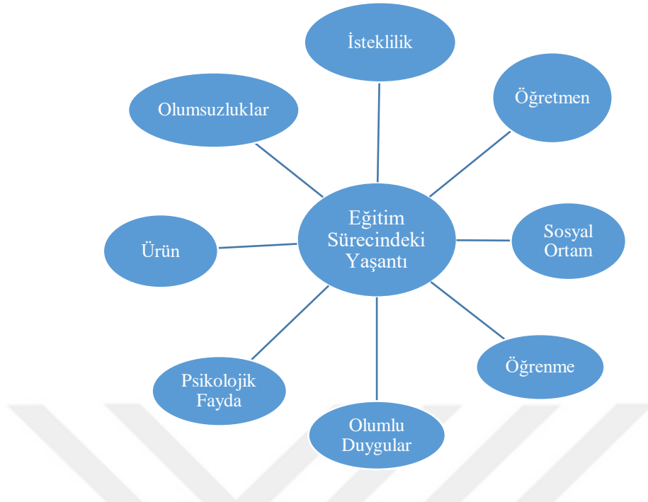
Şekil 4: Yetişkinlerin eğitim sürecindeki yaşantılarına ilişkin görüşleri

Halk Eğitim Merkezlerinde eğitim alan yetişkinlerin, eğitim sürecinde yaşantısına ilişkin görüşleri incelendiğinde; çoğunun isteğinin arttığı, kursla ilgili duygularının olumlu olduğu, öğretmenin kendilerine iyi geldiği ve kendilerini verimli hissettikleri sonucuna ulaşılmıştır. Ayrıca yetişkinlerin katıldıkları kurs sayesinde sosyal bir ortam oluşturmalarının, buradaki arkadaş ortamının ve yeni bilgiler öğrenmelerinin kursiyerlere psikolojik fayda sağladığı ortaya çıkmıştır. Zaman zaman ise karşılaştıkları olumsuzlukların, yetişkinlerin motivasyonlarını olumsuz etkilediği ve kursa devam etmemelerine neden olduğu sonucuna ulaşılmıştır.