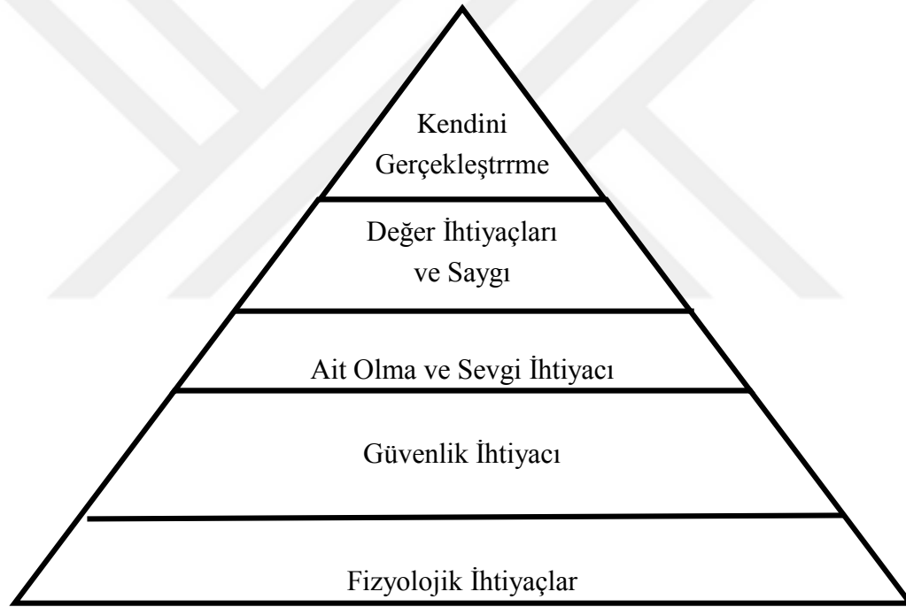
Şekil 1: Maslow'un İhtiyaçlar Hiyerarşisi Piramidi