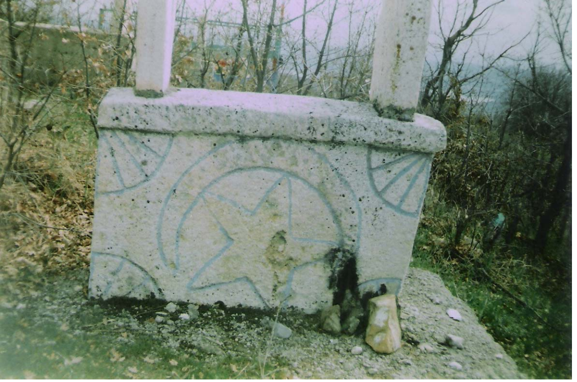
EK-15:Dorutay Köyündeki Ay-Yıldız Motifli Tarihi Mezar taşı