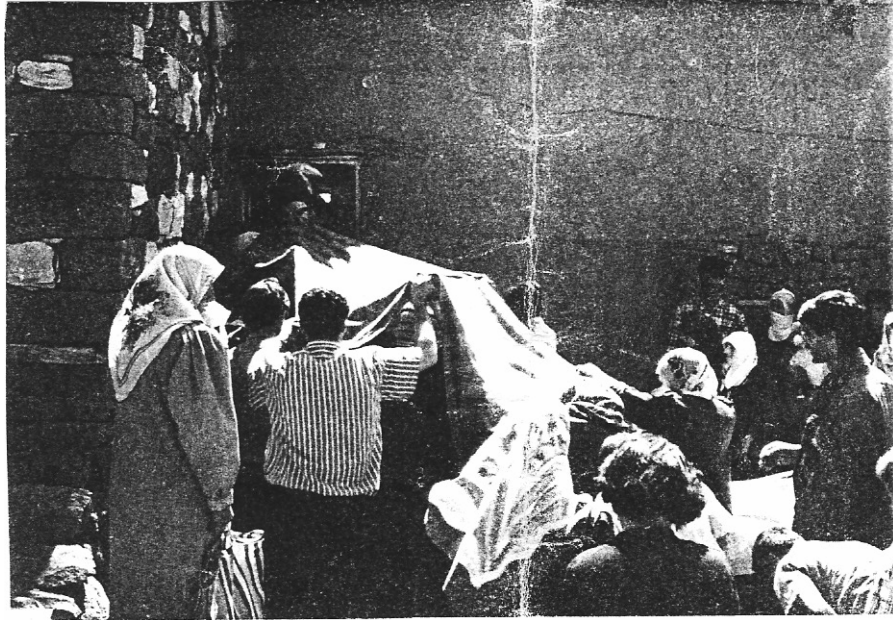
EK-4:Gelin Kayınbaba Evine Girerken