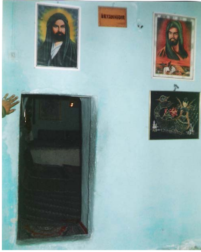
EK-5:Sultan Hıdır Türbesinin İkinci Bölmesinin Kapısı