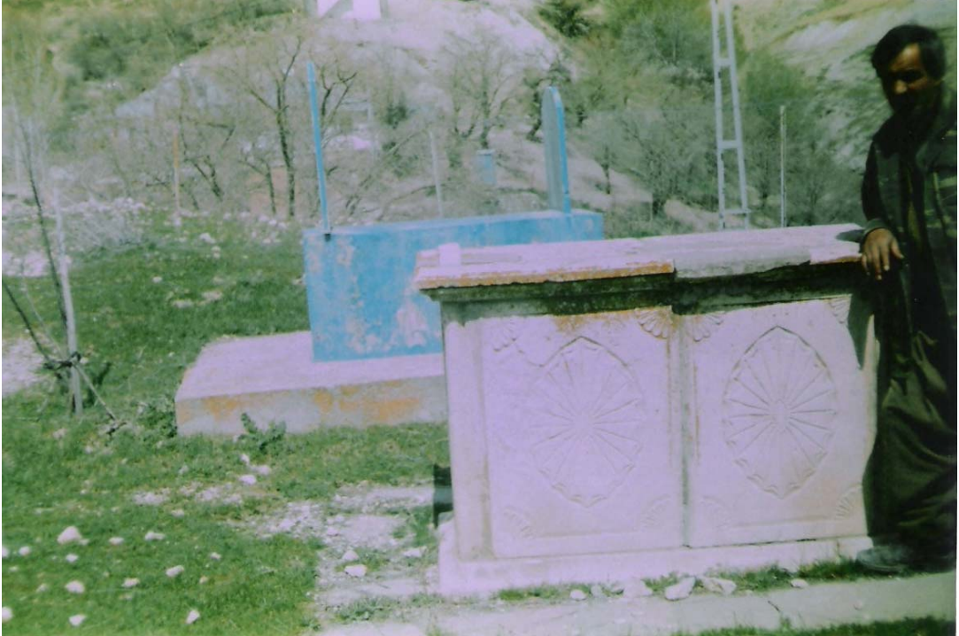
EK-14:Dorutay Köyündeki Güneş Motifli Mezartaş