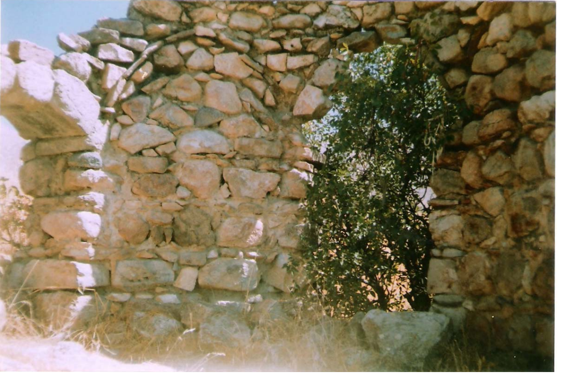
EK-9:Masume Hatun Türbesinin Kısmen Ayakta Kalabilen Üst Kümbeti