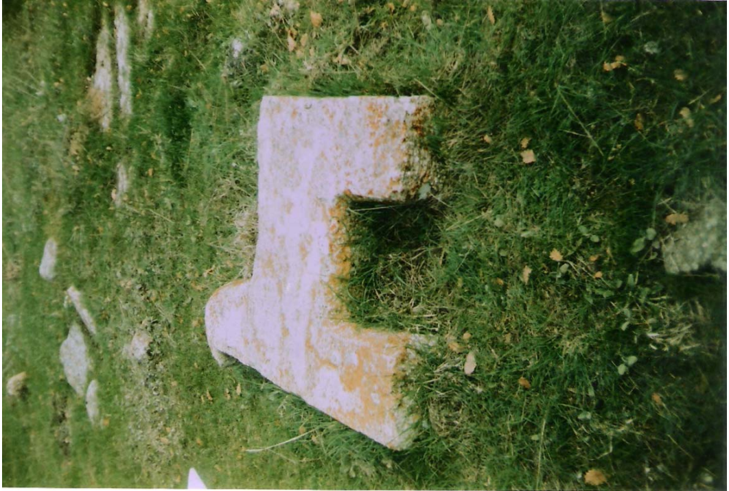
EK-12:Dorutay Köyündeki At yada Koç Heykelli Tarihi Mezar taşı