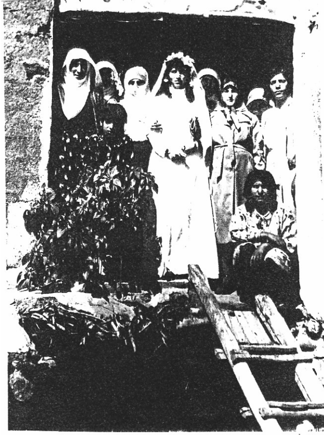
EK-3:Gelin Baba Evinden Çıkarken