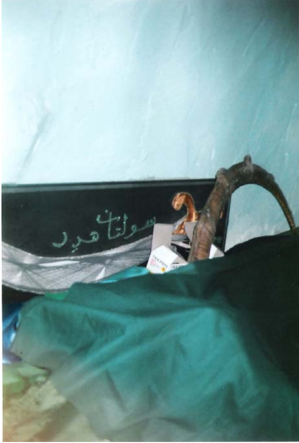
EK-7: Sultan Hıdır Türbesinde Şifa Amaçlı Kullanılan Geyik Boynuzu ve Yatırlardan Görünüm