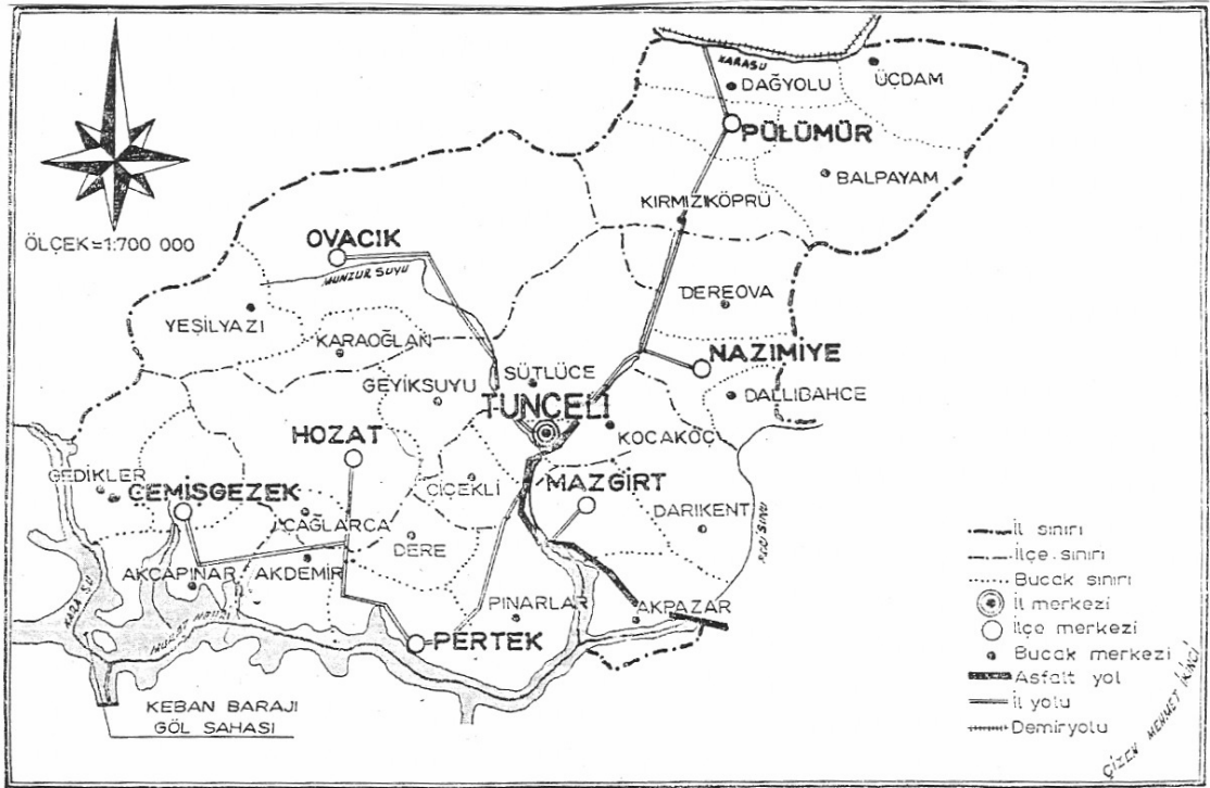
EK-1: Tunceli İl Haritası