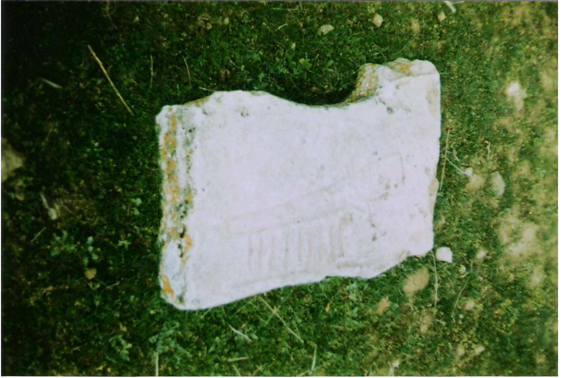
EK-13:Dorutay Köyündeki Kılıç Motifli Tarihi Mezartaş