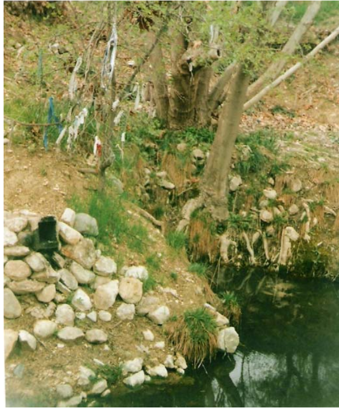
EK-10:Masume Hatun Türbesi ile İlişkilendirilen Kutlu Su ve Ağaç Ziyareti