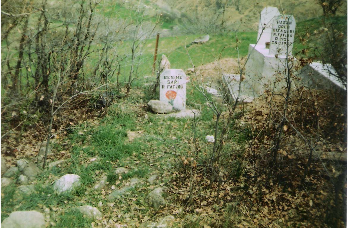
EK-16:Dorutay Köyündeki Gül Motifli Günümüz Mezar Taşları