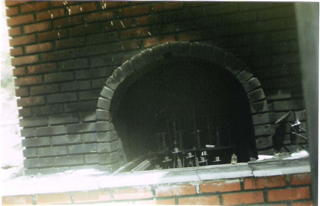
EK-6:Sultan Hıdır Türbesinde Şamdanlı Mum Yakma Yeri