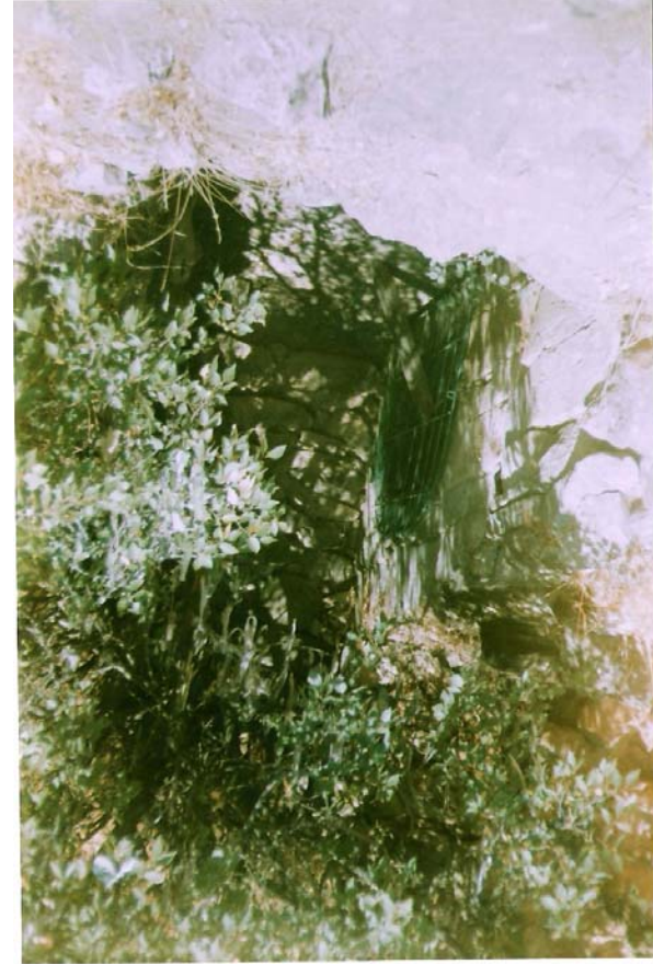
EK-8: Masume Hatun Türbesi Yatırının Bulunduğu Alt Bölme