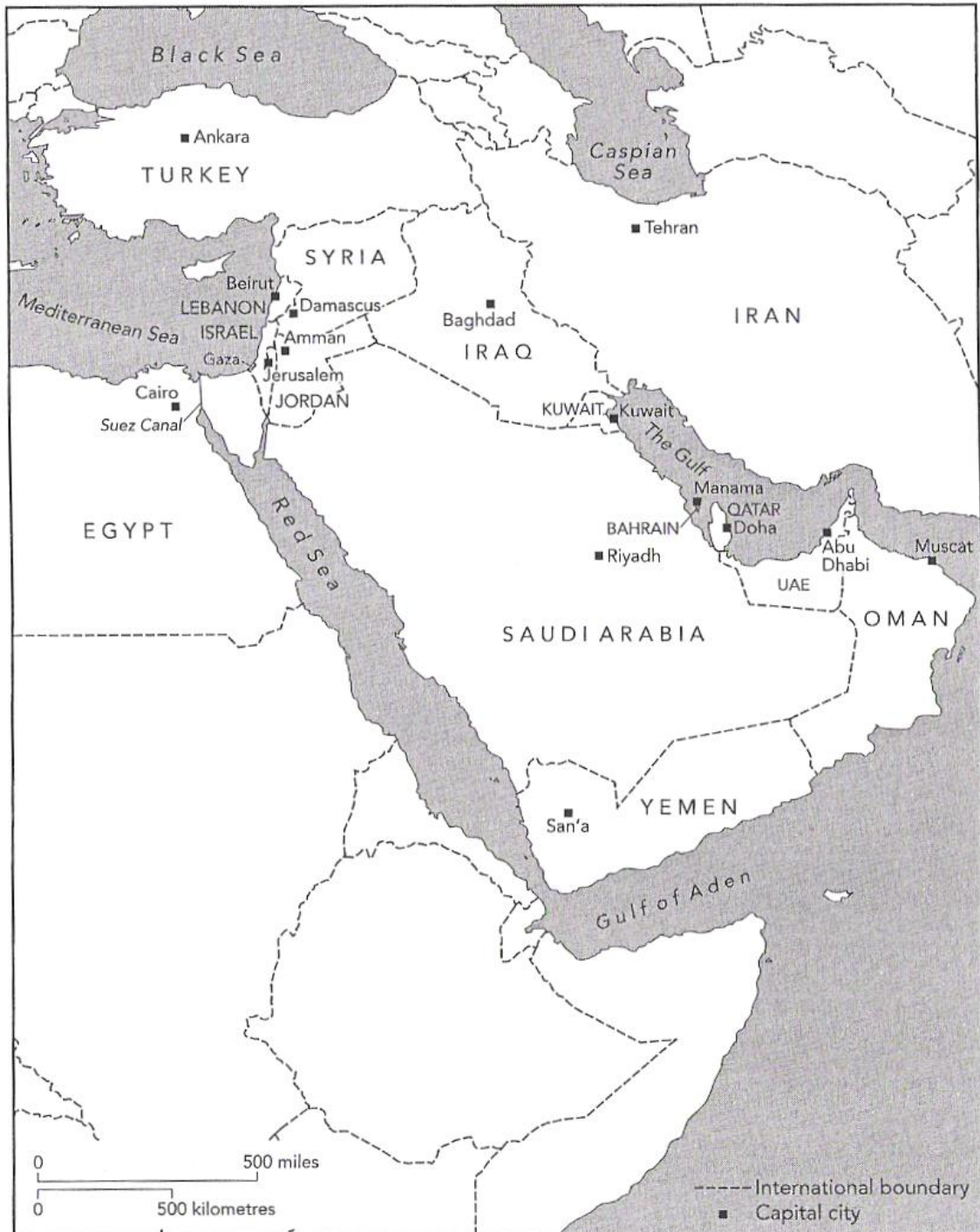
The Middle East

Yazid, SAYIGH, Avi SHLAIM, The Cold War ant the Middle East, Oxford, 1977