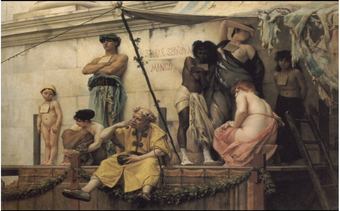
Erken ortaçağ döneminde Bizans Topraklarında bir köle pazarı