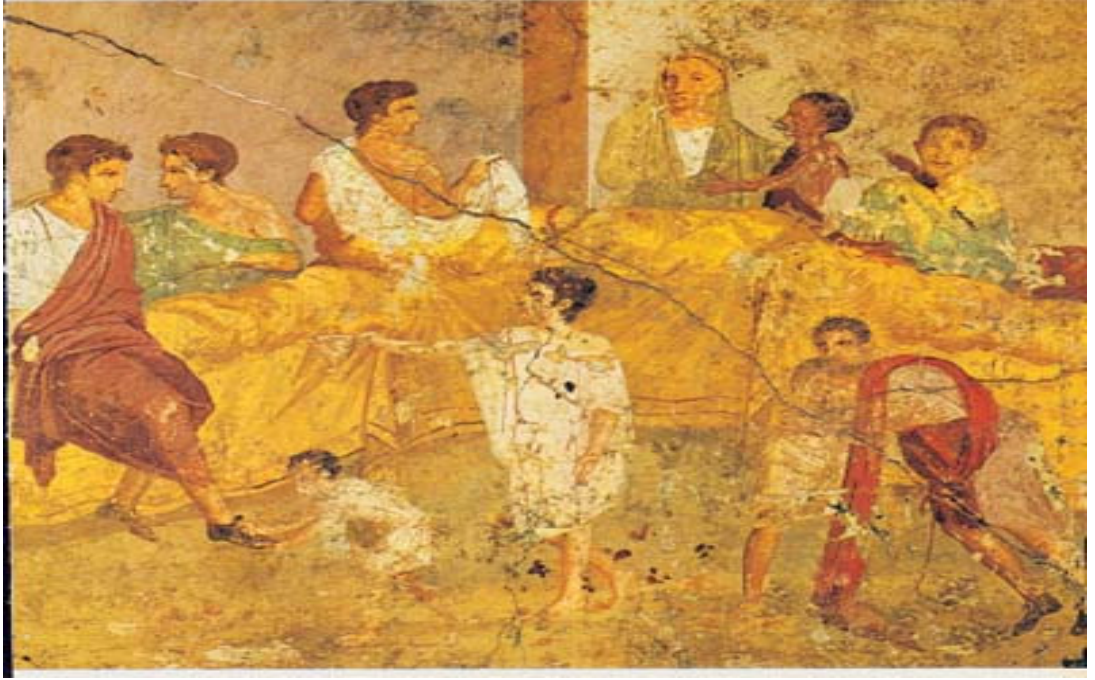
Miladi IV.yüz yıldan kalma bir duvar resminde köleler ve efendiler.