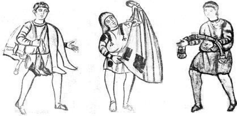
Miladi 3. Asırda Bir Romalı Köle.

Köle efendisine pantolonunu getiriyor. Ayrıca iğneli pelerinini, mücevherli askeri kemerininide efendisine getirmek için bir köle taşıyor. Silistre'de (Bulgaristan) bir mezarın freskleri.