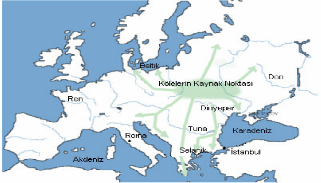
Miladi VI. yüzyılda Avrupa topraklarında köle alım yerleri