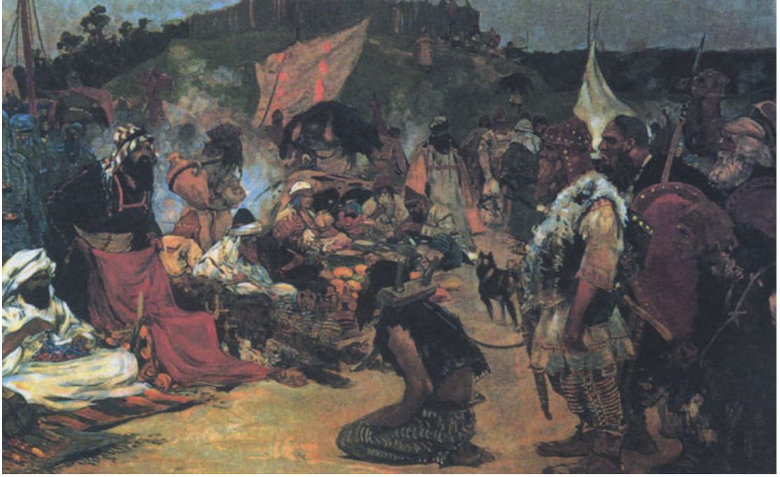
Erken ortaçağ döneminde Kuzay Avrupa Topraklarında bir köle pazarı.