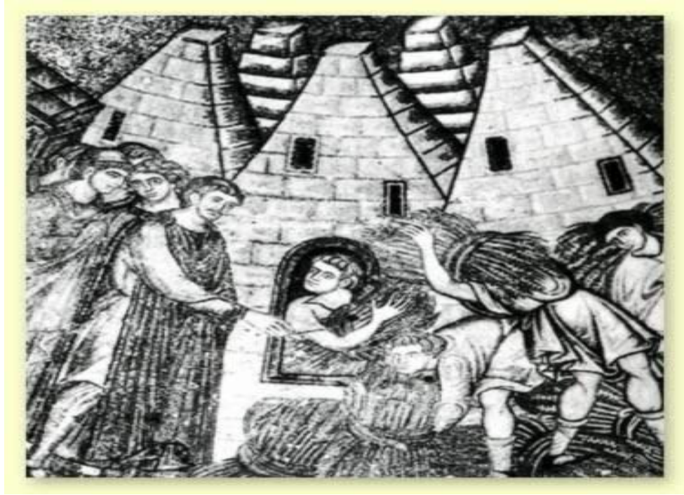
Kölelerin günlük çalışmalarına ait bir gravür.