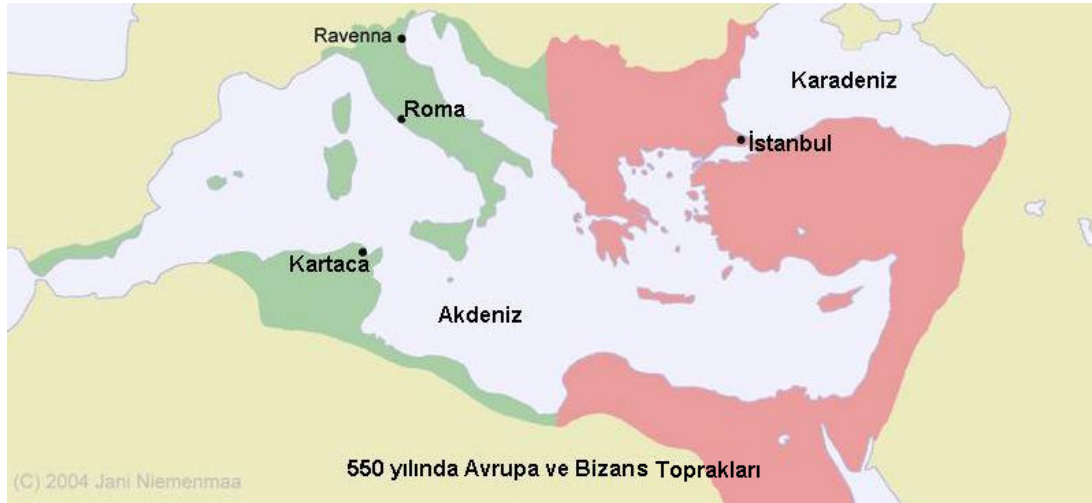
550 yılında Avrupa ve Bizans Toprakları