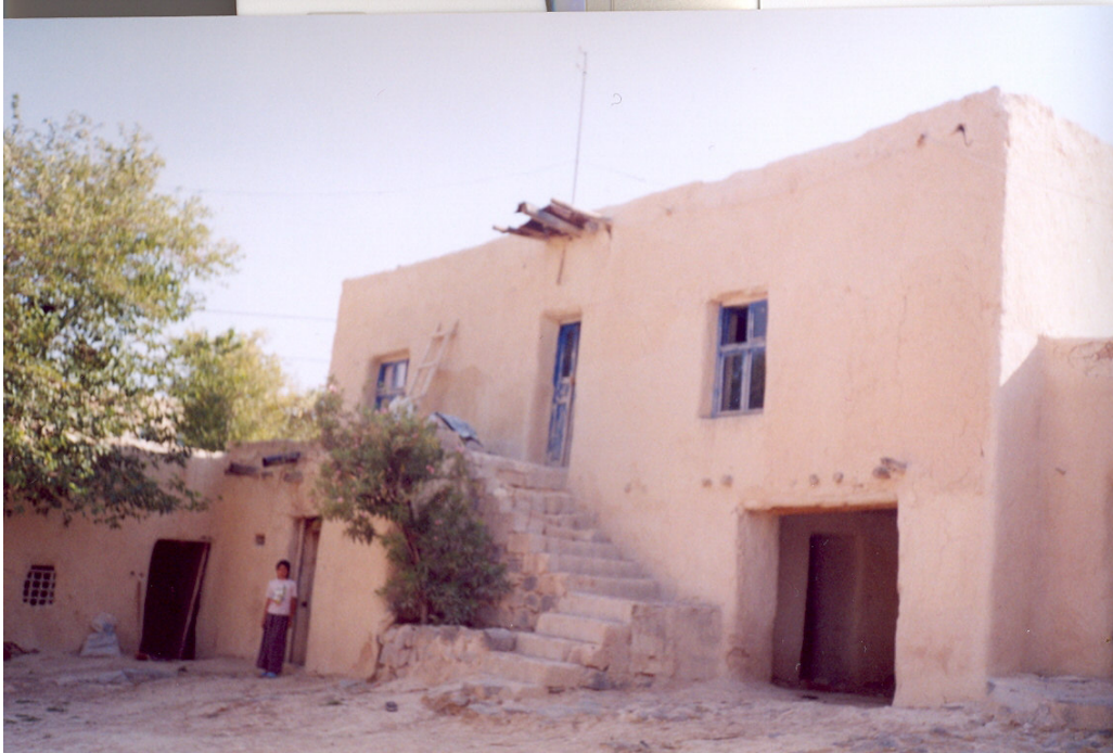
EK D.2. Gerektiğinde cenaze yıkama işleminin de yapıldığı avlu (Oğuzeli, Kılavuz Köyü)