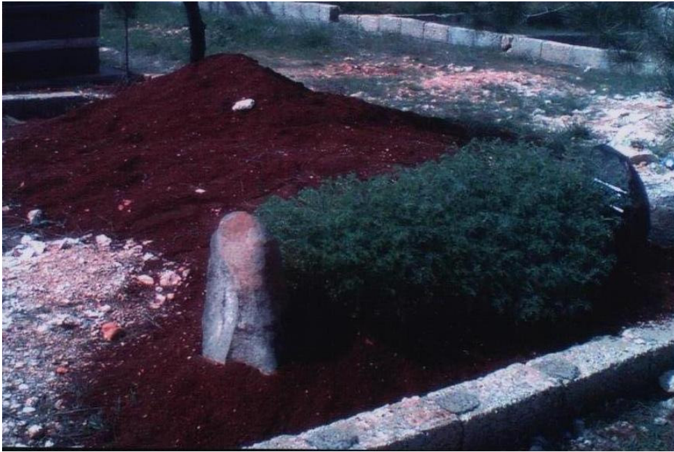
EK D.6. Defin sonrası mezar görüntüsü