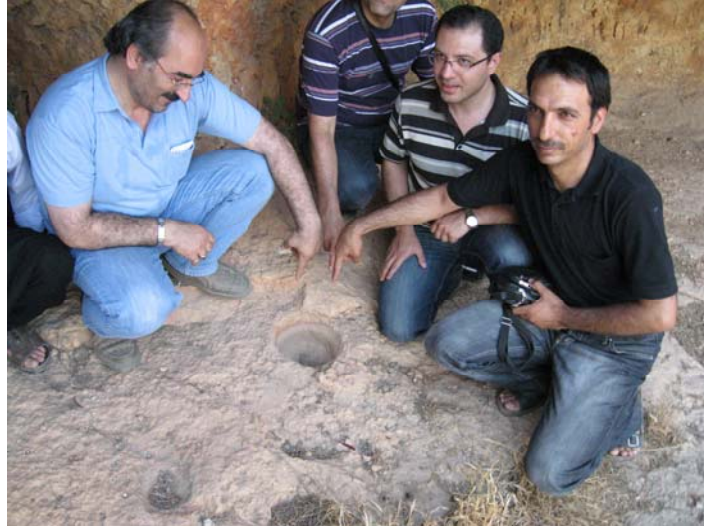
İbn-i Hacer'in baş ucunda uyuduğu taş Kızılin Köyü