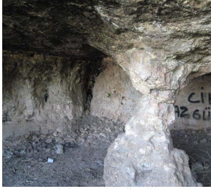
Evren'in kızı yuttuğu Dikmeli Mağara Çatalca Köyü