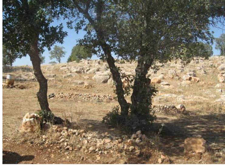
Taş baş Tepesi’nde kan akıtan ağaç ve taşa kesen yedi kız kardeşin mezarları