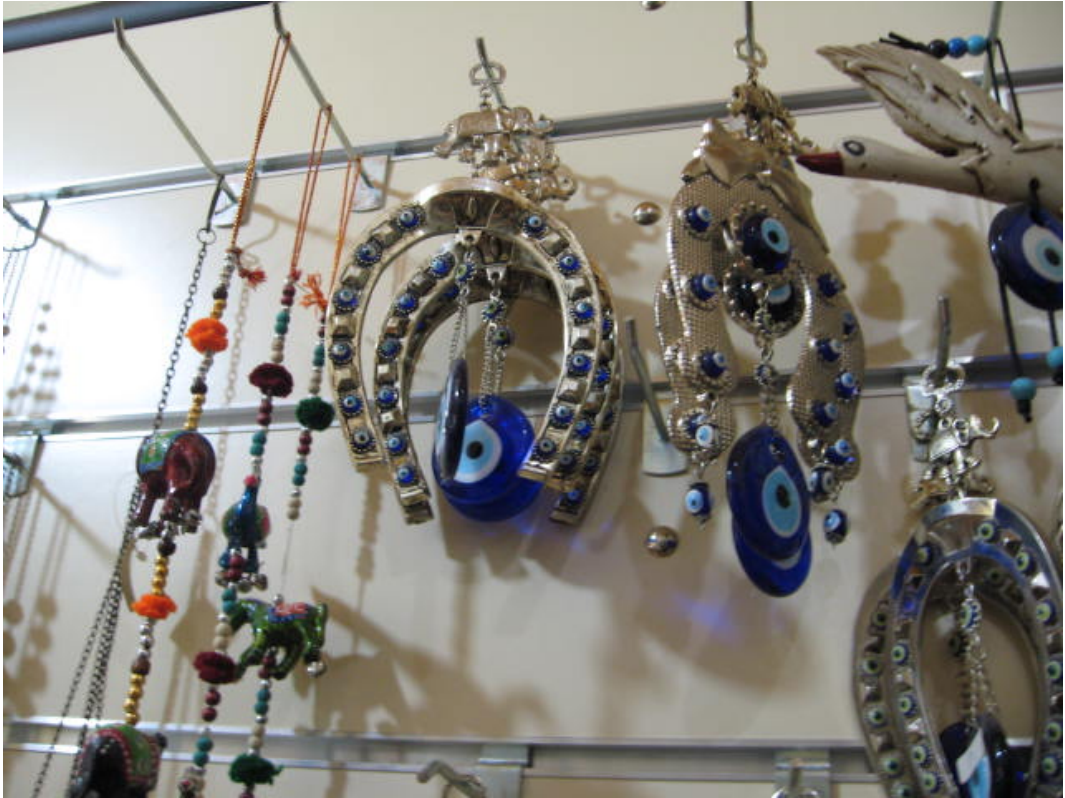
Resim 46: At nalı ile birlikte mavi boncuk