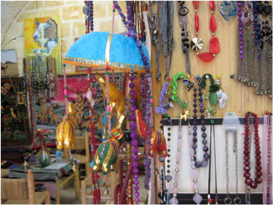
Resim 36: Çeşitli nazarlıklar