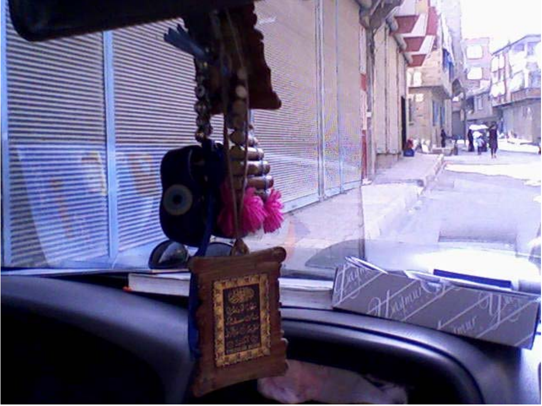
Resim 1: Arabanın Aynasında Asılı Çeşitli Nazarlıklar