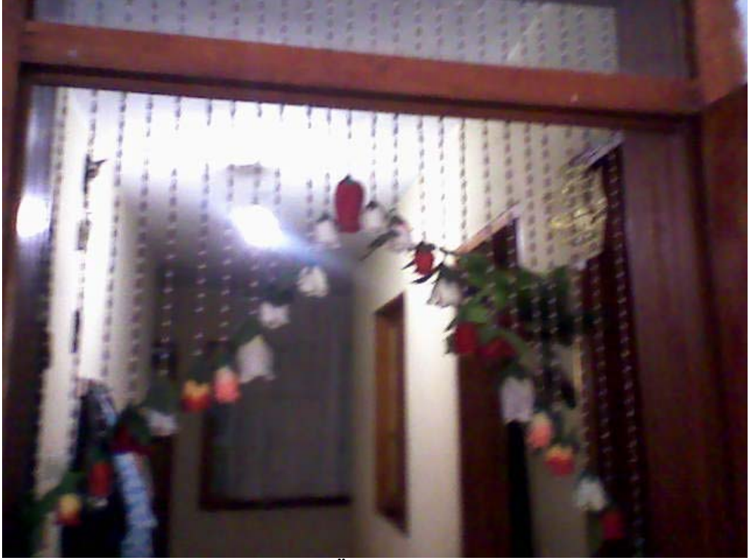
Resim 25: Kapının Girişinde Asılı Üzerlik