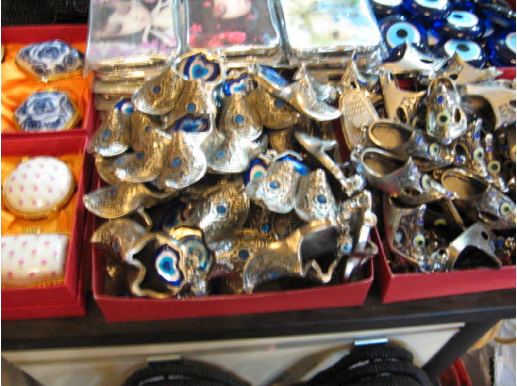
Resim 43:Çeşitli nazarlıklar