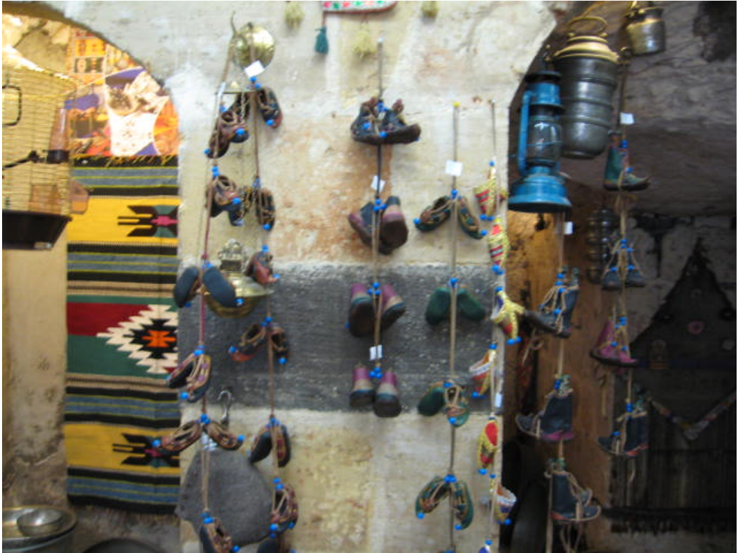
Resim 34: ayakkabı şeklindeki nazarlıklar