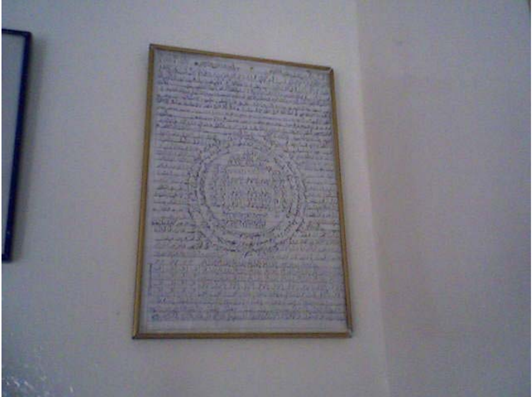
Resim 14: Evin Duvarında Asılı Nazar Duası