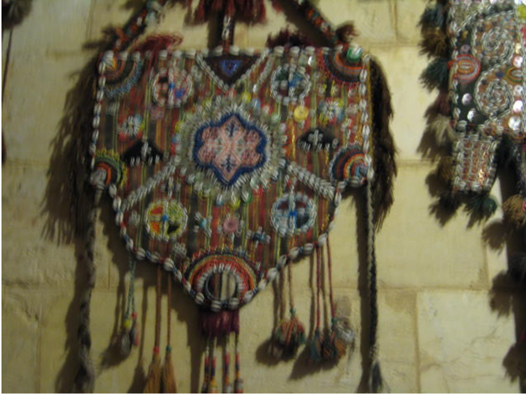
Resim 59:Aynalı çengil