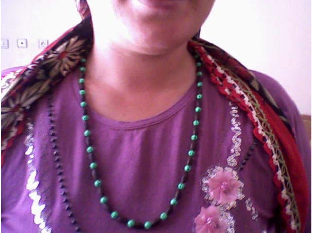
Resim 20: İğde ve Mavi Boncuktan Yapılan Kolye