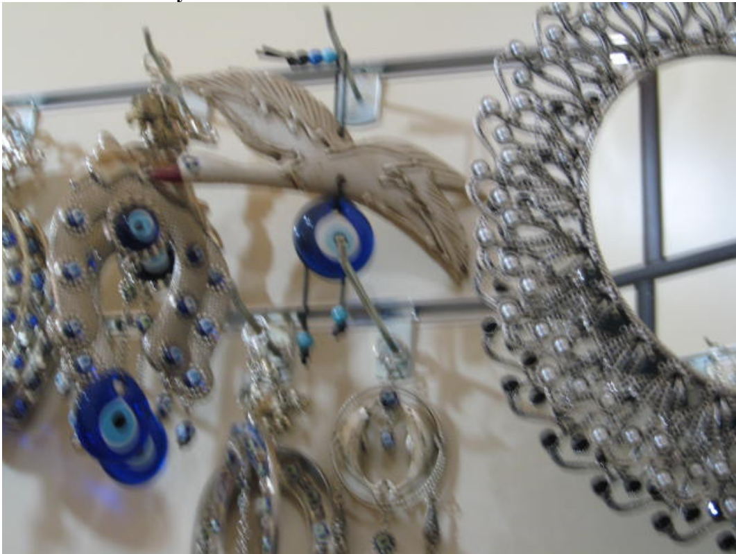
Resim 48: Çeşitli nazarlıklar