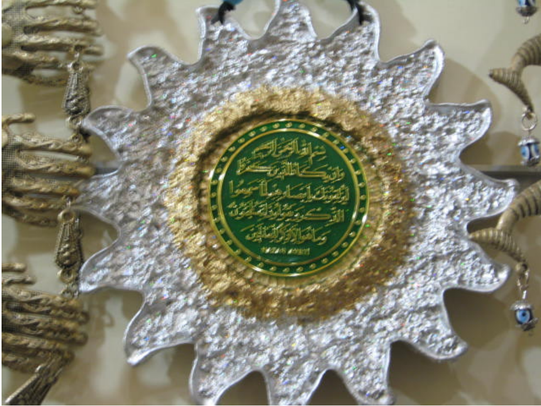
Resim 47: Nazar ayeti