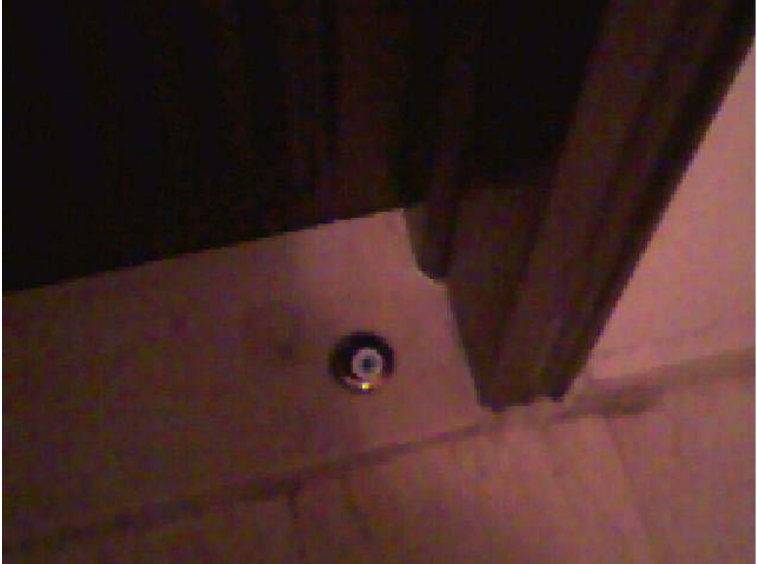
Resim 24: Kapı Önündeki Nazarlık