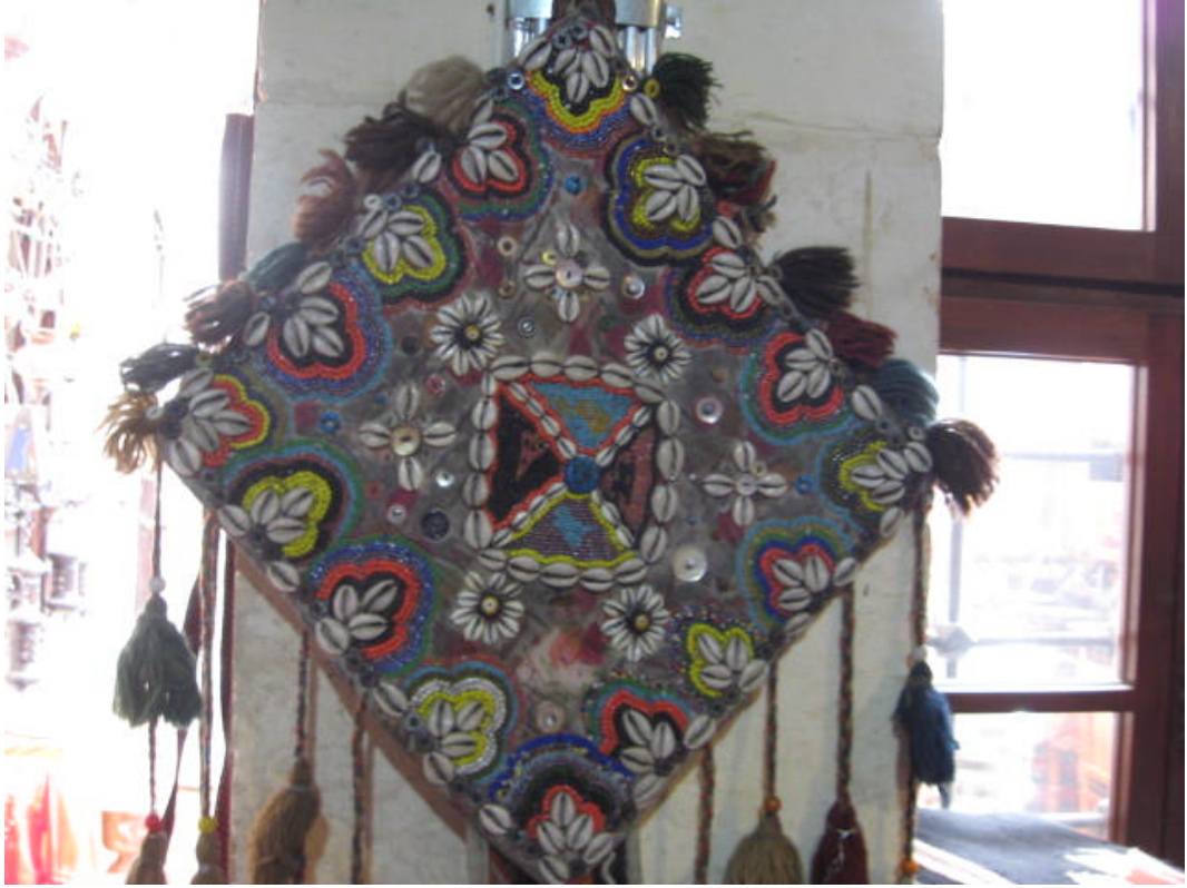
Resim 55: Aynalı çengil