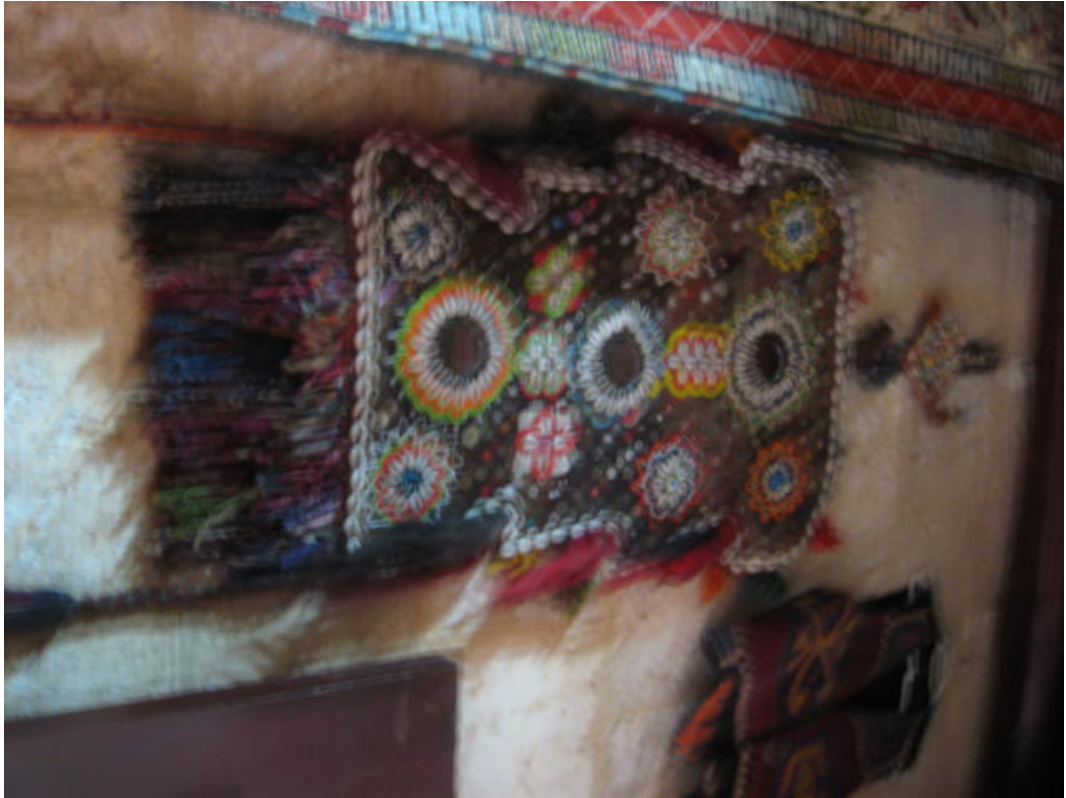
Resim 56: Aynalı çengil