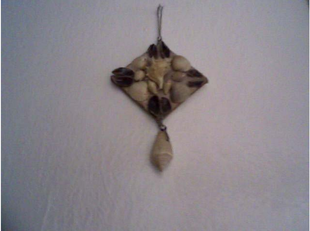
Resim 8: Dikkatleri Őzerinde Toplamak İđin Deniz Kabuklarından YapılmıŐ Nazarlık