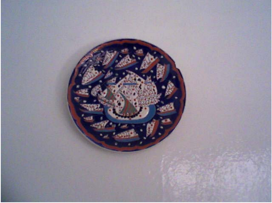
Resim 9: Duvarda Asılı Bir Nazarlık