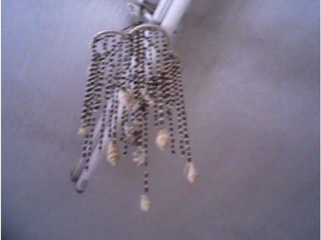
Resim 28: Tavana asılı üzerlik