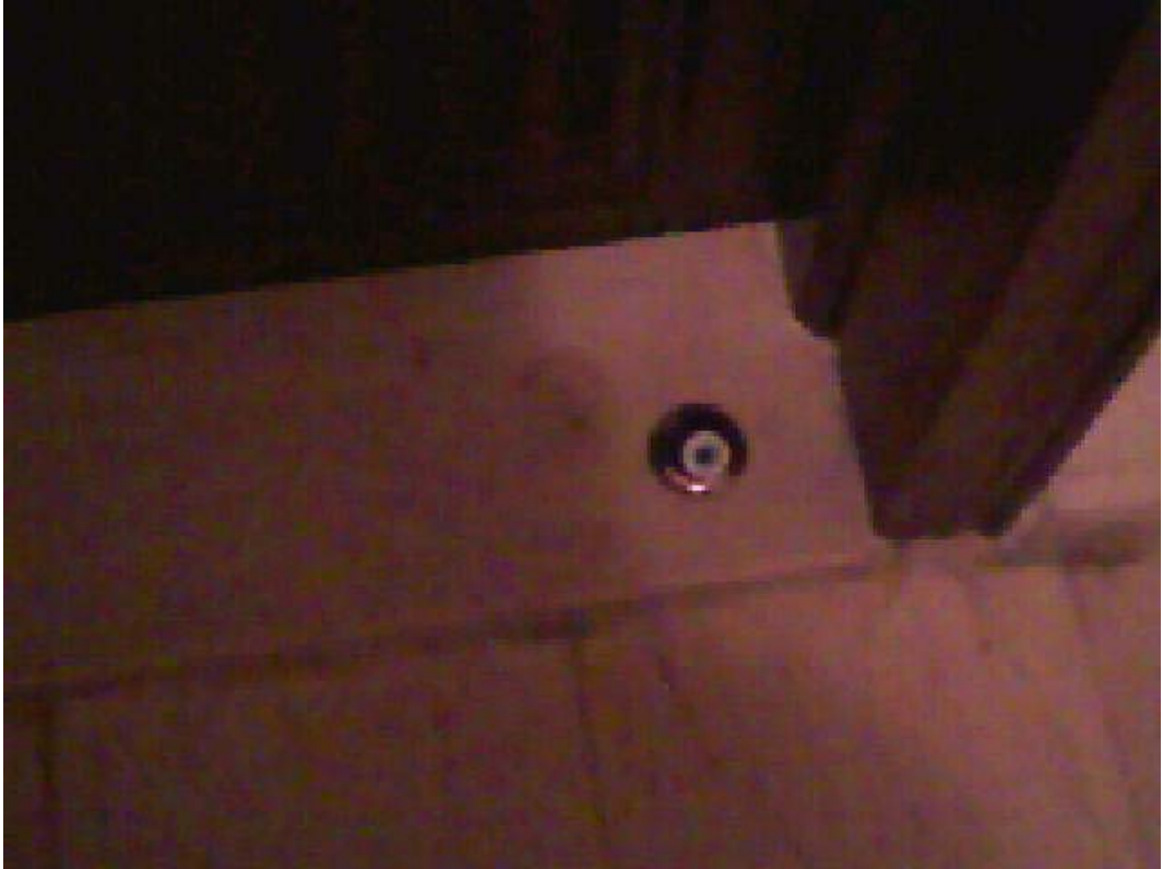
Resim 18: Gelenlerin Olumsuz Etkisini Dışarıda Bırakmak İçin Kapı Önündeki Nazarlık