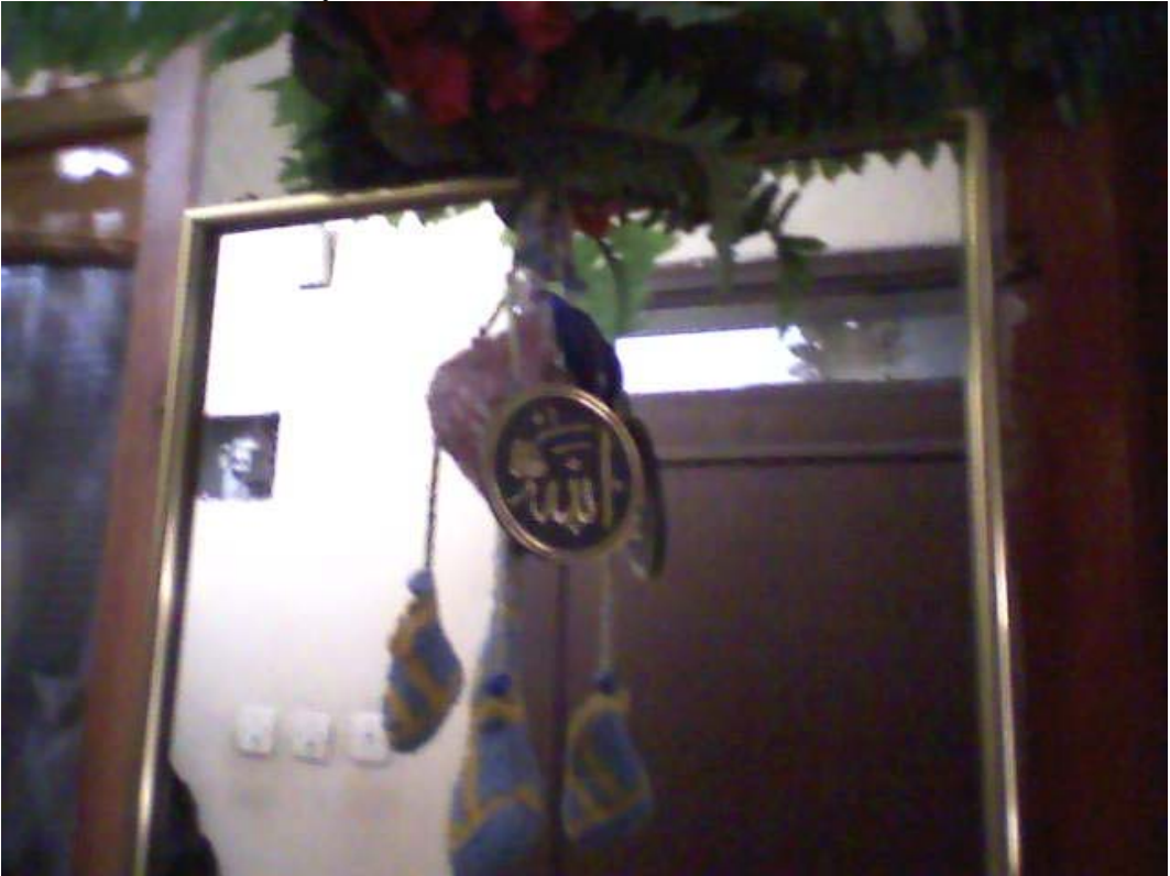
Resim 2: Ayna Önüne Asılı Çeşitli Nazarlıklar