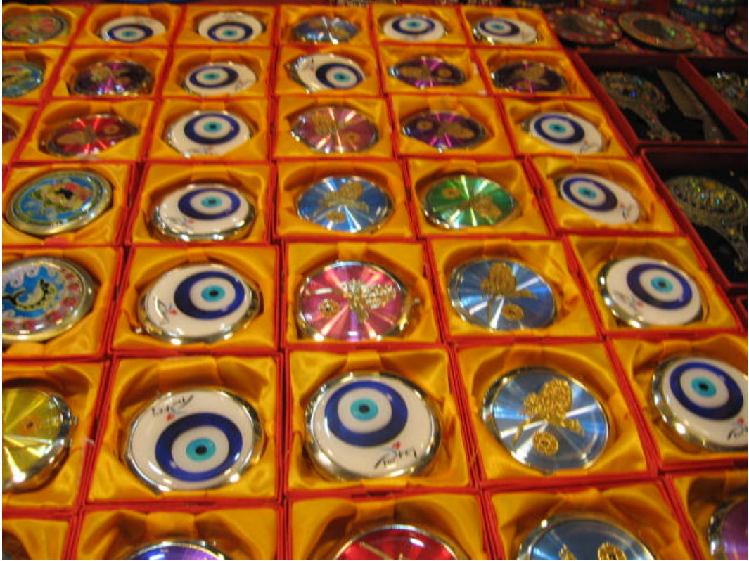
Resim 42: Nazarlıklar