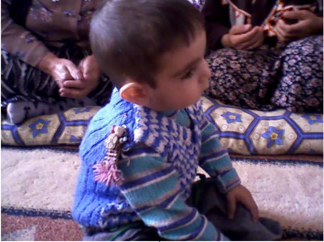
Resim 7: Çocuđu Nazardan Koruyan İđde, Őeb vs.