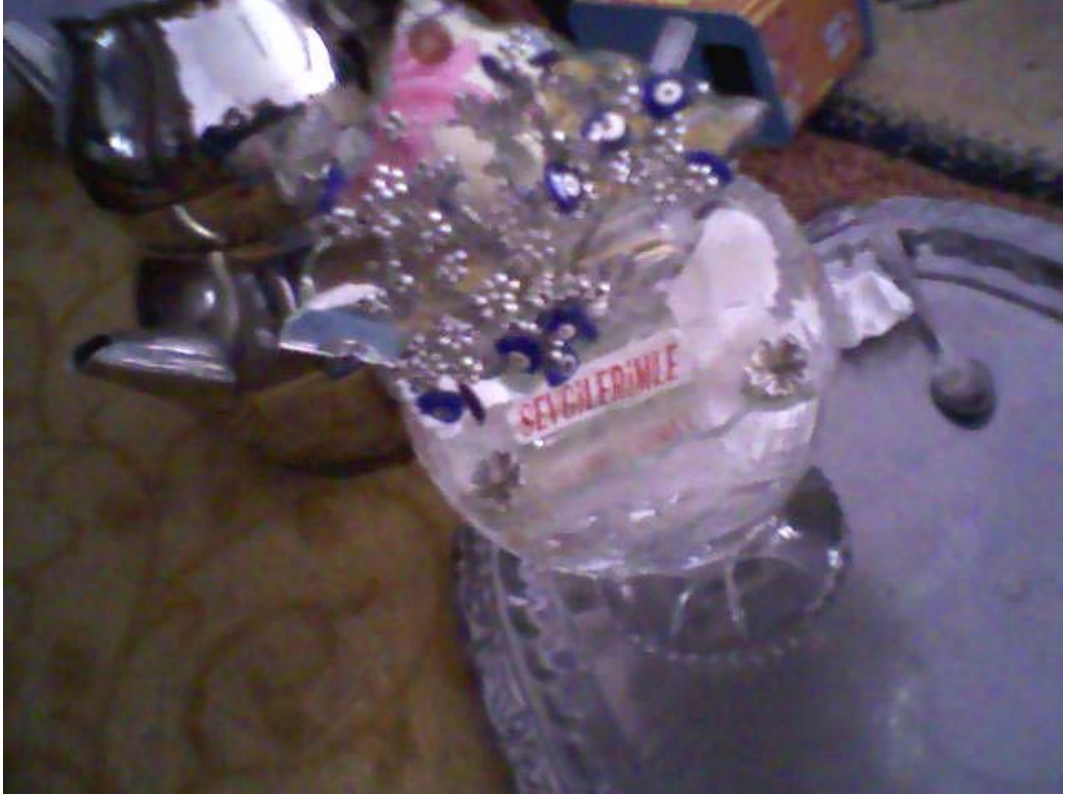
Resim 16: Evlerin Çeşitli Yerlerinde Bulunan Nazarlıklar