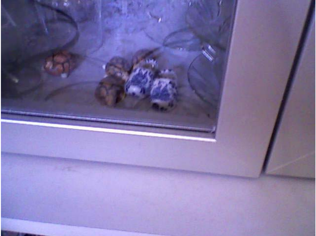
Resim 4: Camedan İçindeki Nazarlık