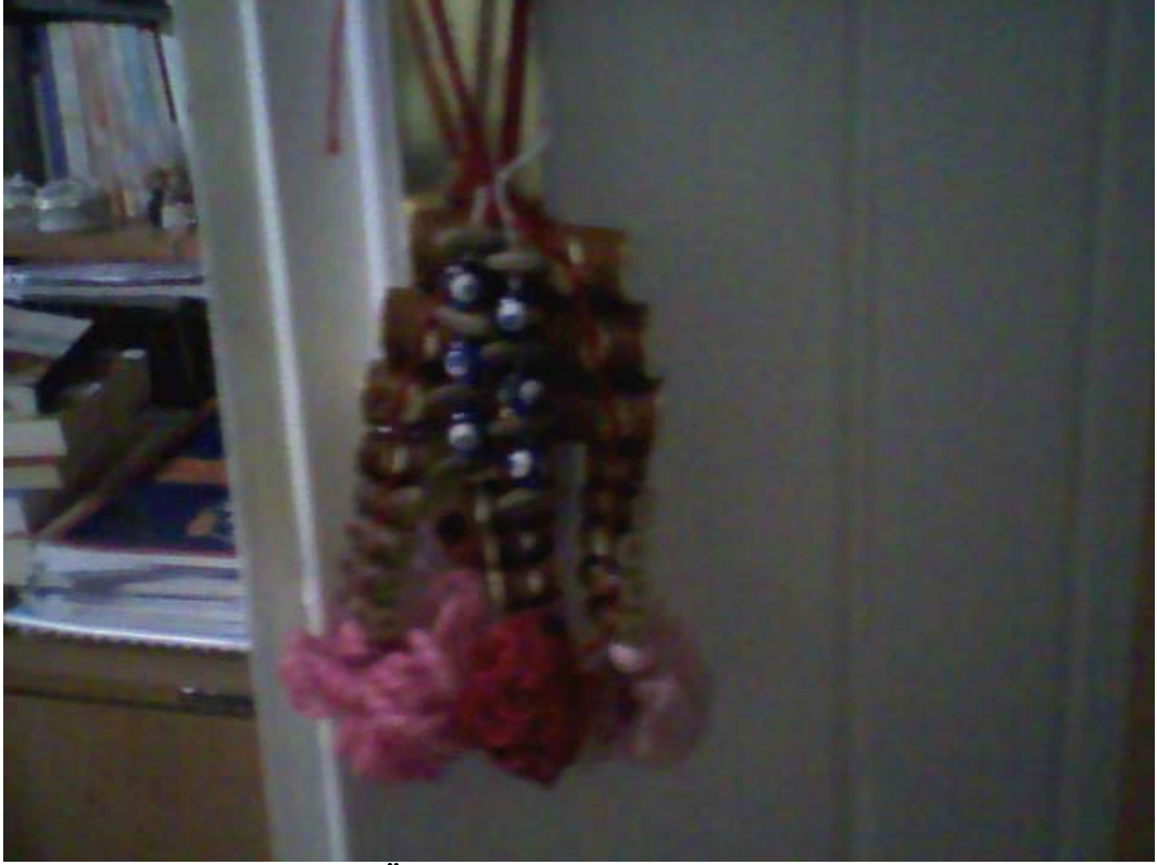
Resim 23: Kapı Kolunda Üzerlik ve Mavi Boncuk