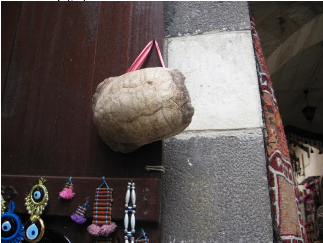
Resim 54: Koruyuculuğuna inanılan kaplumbağa kabuğu