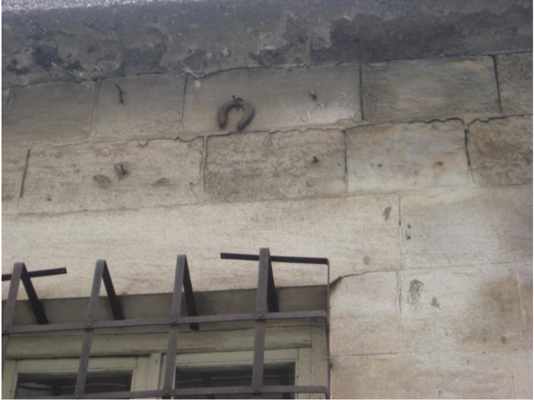
Resim 32: Evin dış yüzüne asılmış “at nalı”