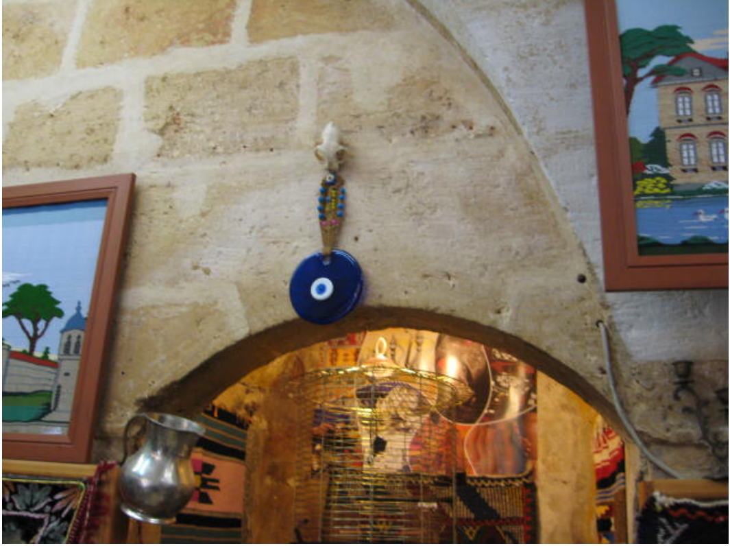
Resim 35: Mavi boncuk