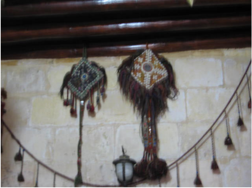
Resim 57:Aynalı çengil