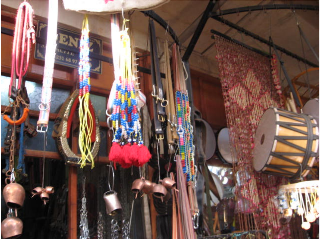
Resim 50: Mavi renge vurgu yapan nazar inancı