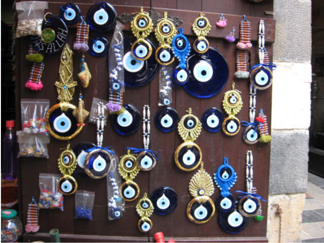
Resim 53: Kapı girişinde satılan nazarlıklar