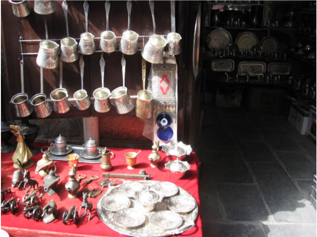
Resim 52: mağazaya asılı nazar boncuğu