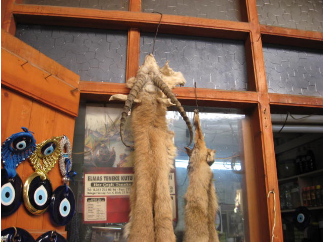
Resim 60: Mavi boncuk