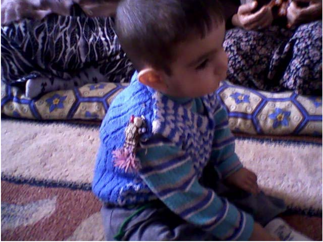
Resim 5: Çocuęu Nazardan Koruyan Nazarlıklar