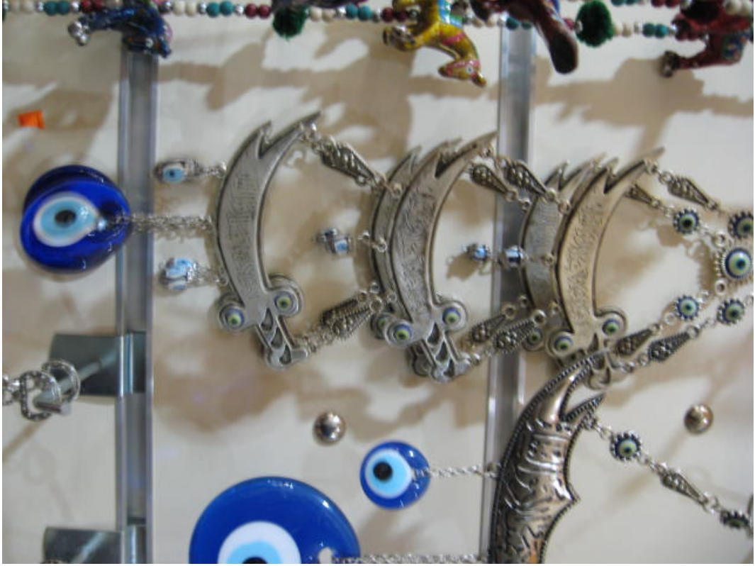
Resim 45: Mavi boncuk