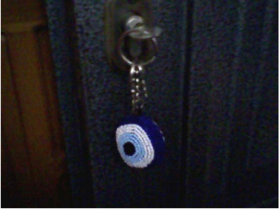
Resim 21: Kapı Anahtarlığı Şeklinde Nazarlık