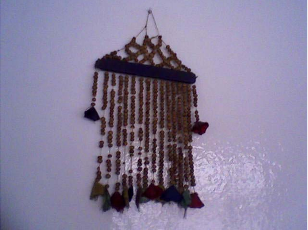
Resim 12: Evin Duvarında Asılı İpe Geçirilmiş Üzerlik