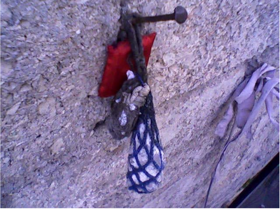
Resim 11: Evin Duvarına Asılı Şeb, Hamaili vs.