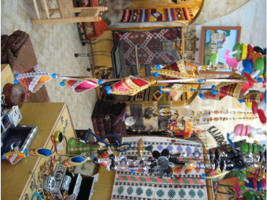
Resim 38: Ayakkabı biçimindeki nazarlıklar