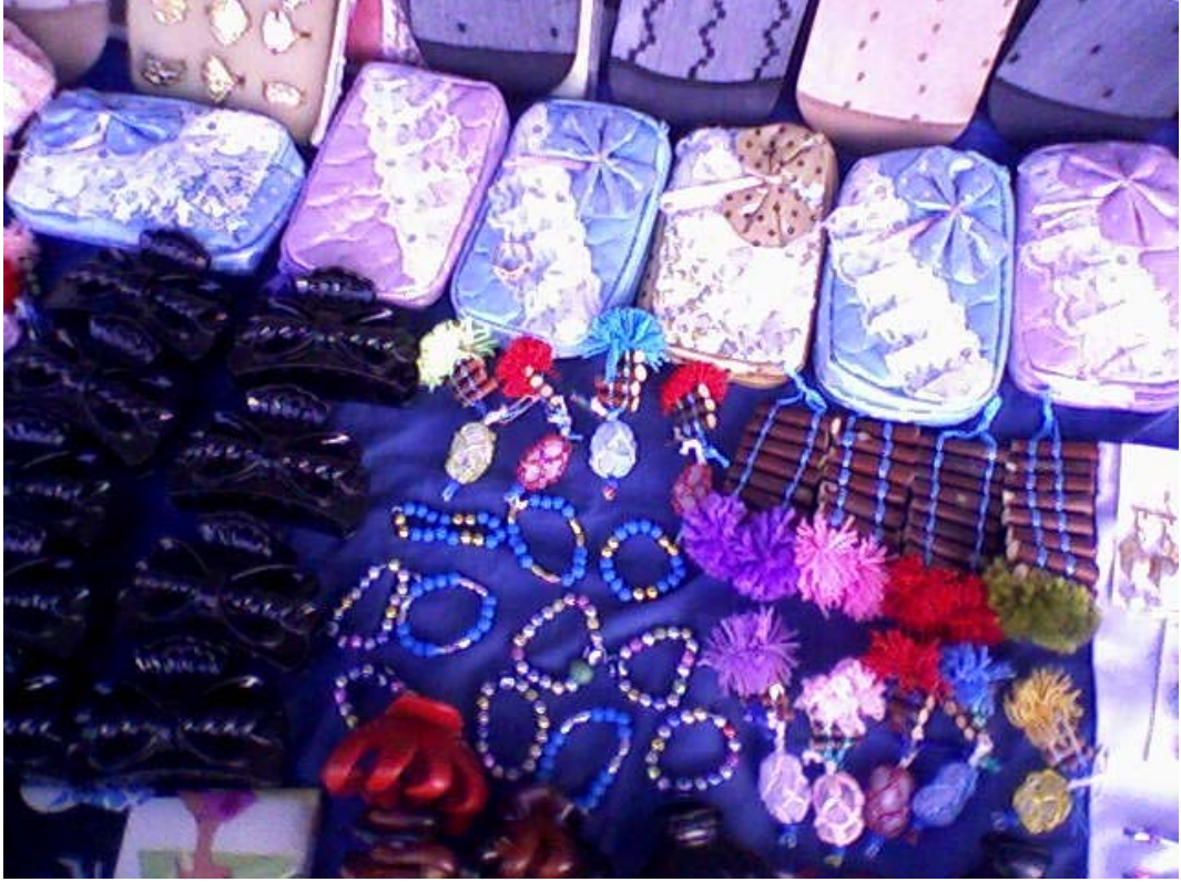
Resim 17: Yol Kenarında Satılan Şeb, vs. Nazarlıklar