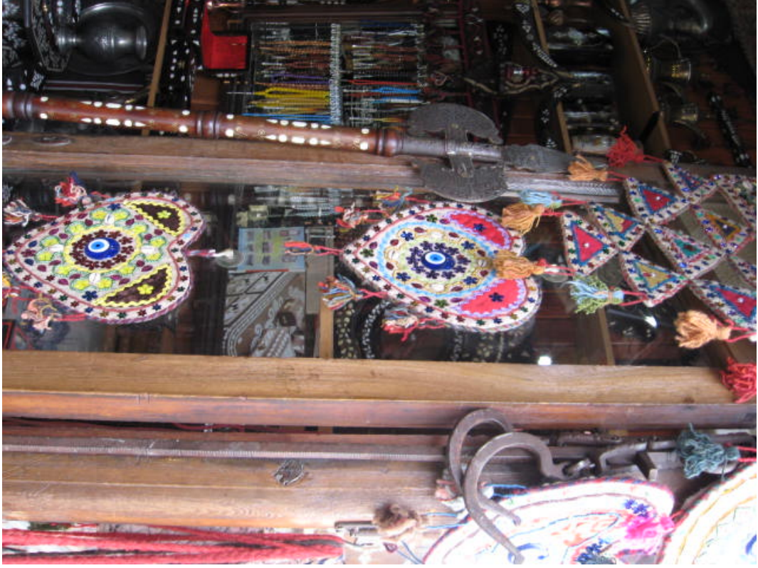
Resim 31:Aynalı çengil