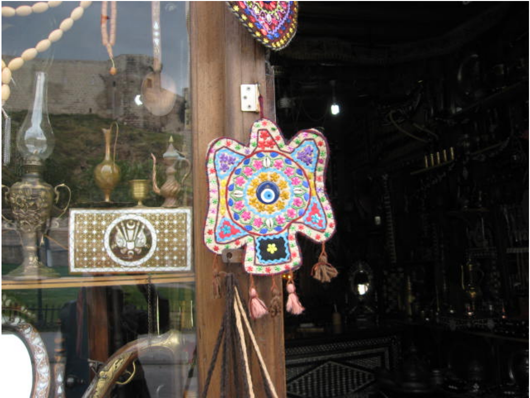
Resim 30: Gaziantep'te genç kızlar tarafından İşlenen "aynalı çengil"