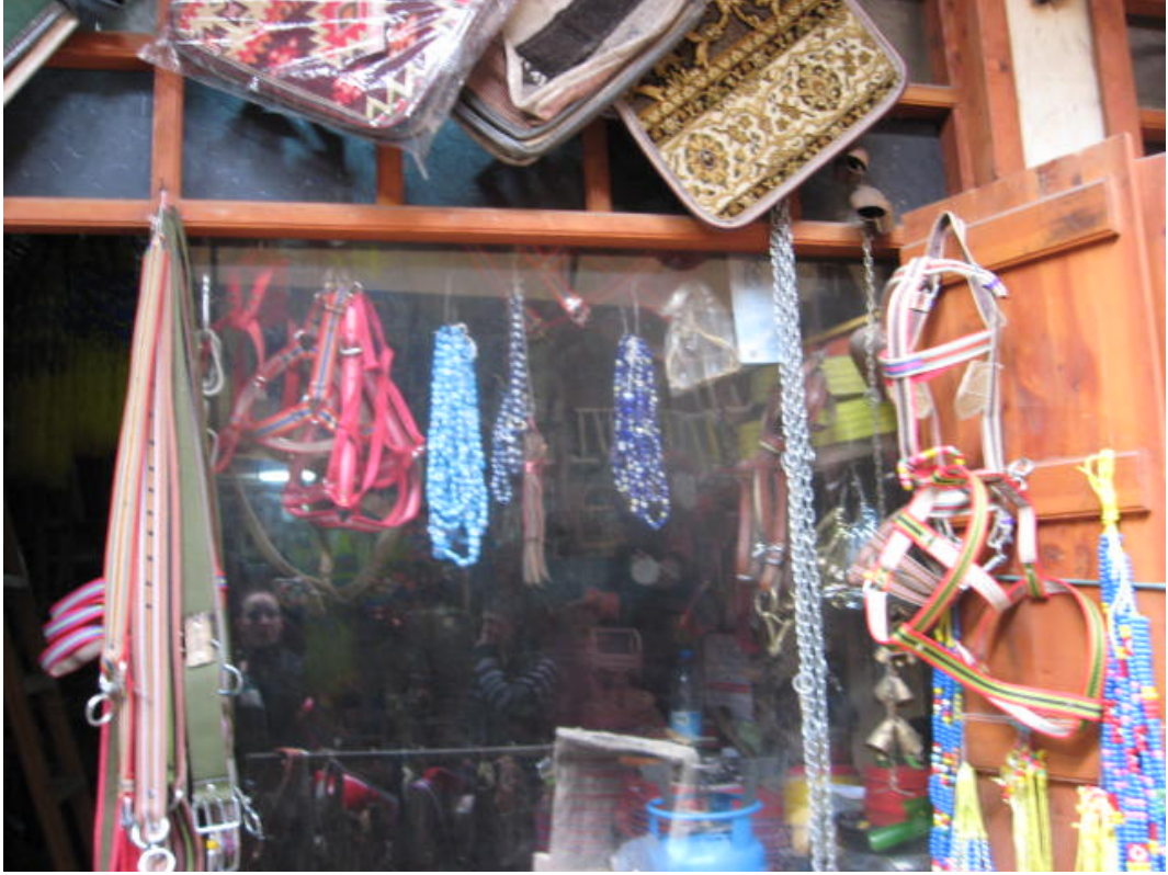
Resim 51: Nazar boncukları