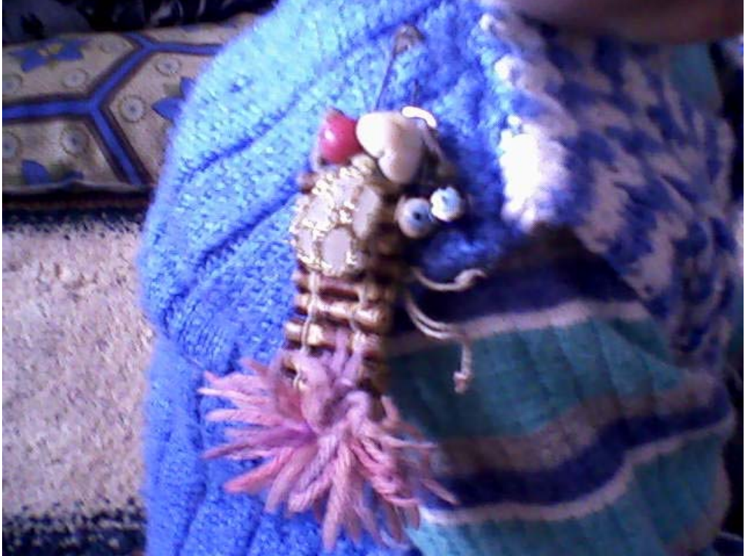
Resim 6: Çocuęun Saę Omzunda Görölmektedir