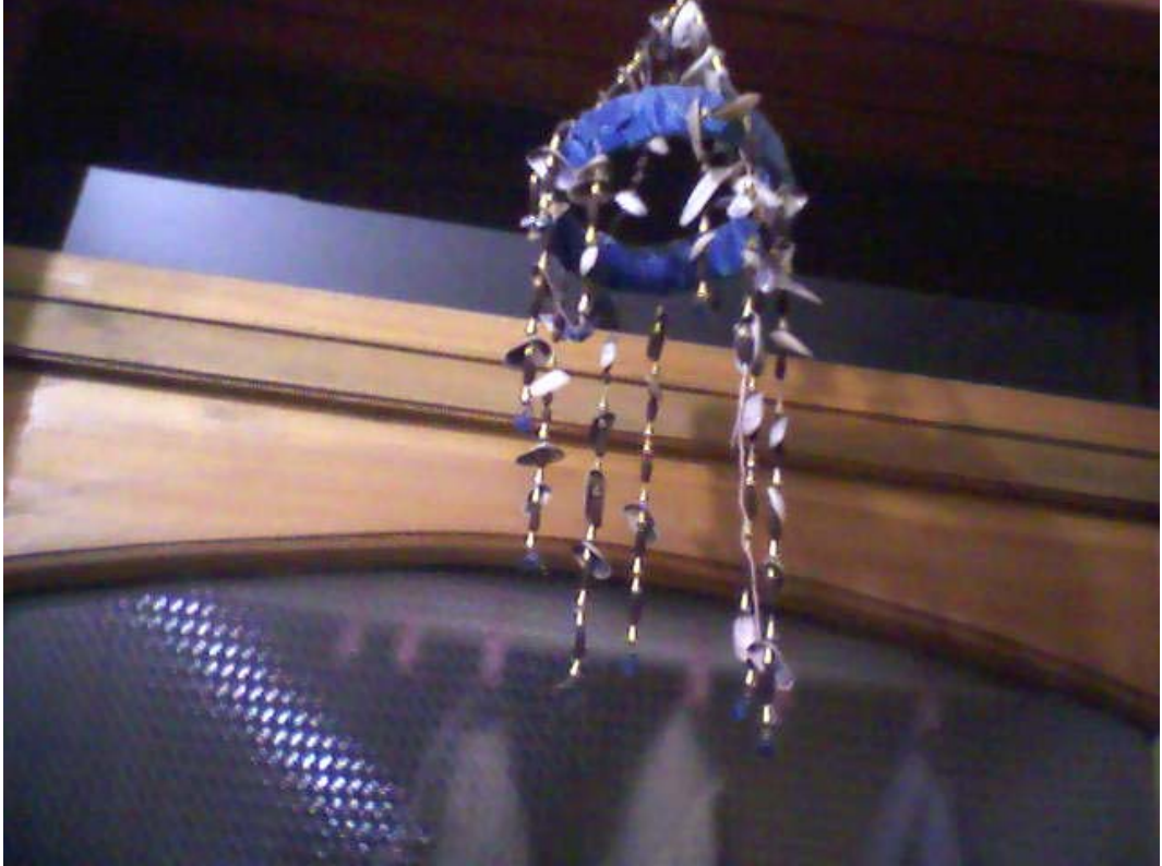
Resim 22: Kapı Duvarına Asılı Nazarlık