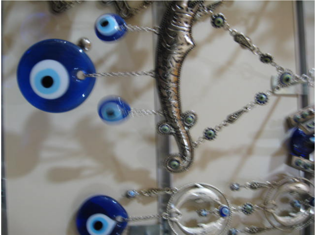
Resim 44: Mavi boncuk