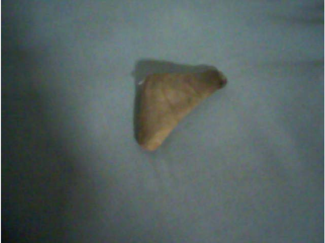
Resim 10: Elbise İçlerinde Taşınan Hamaili