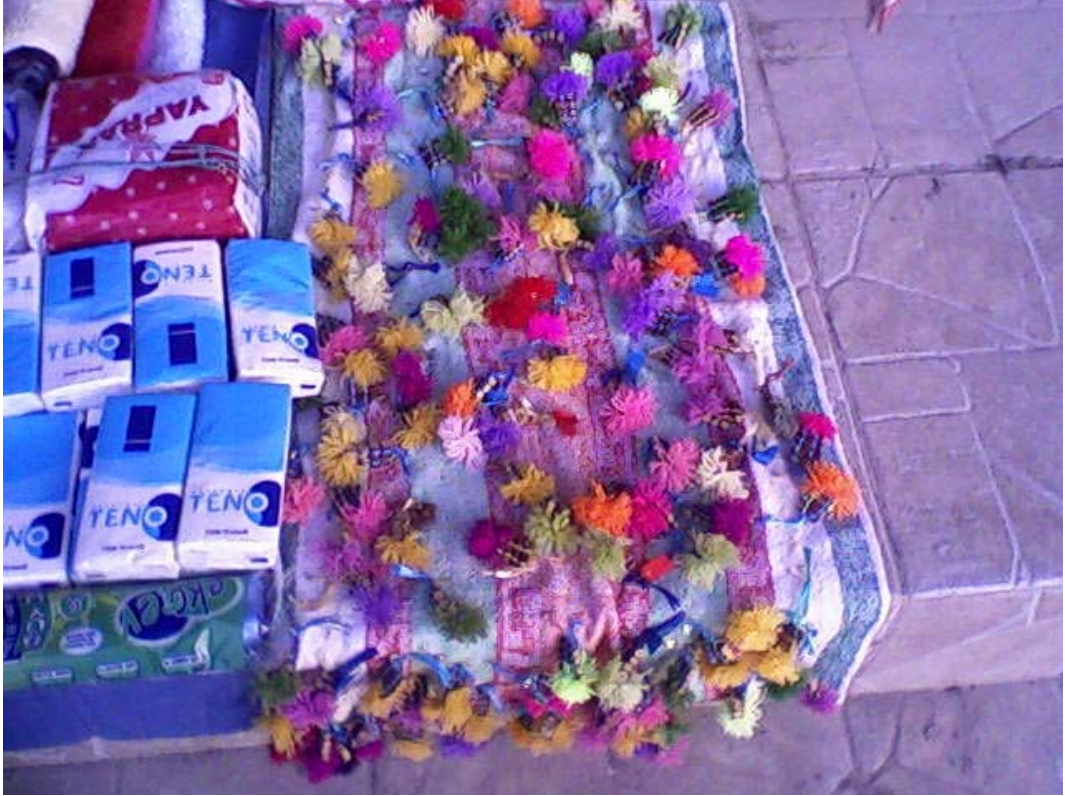
Resim 29: Yol Kenarında Satılan Nazarlıklar