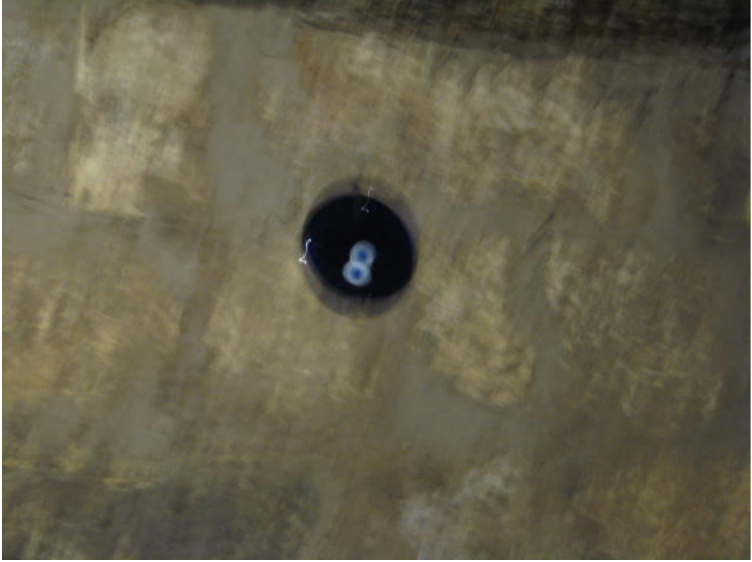
Resim 39: Duvara asılı “mavi boncuk”