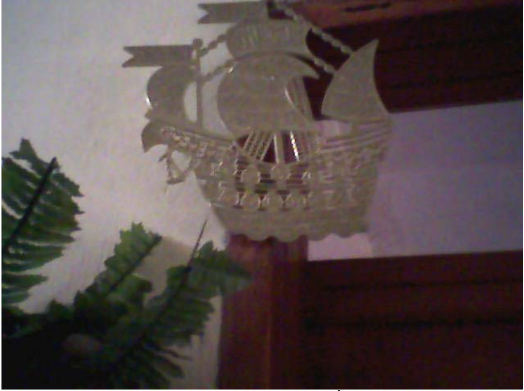
Resim 27: Metal Nesnelerin Nazardan Koruduđu İncanın Göstergesidir