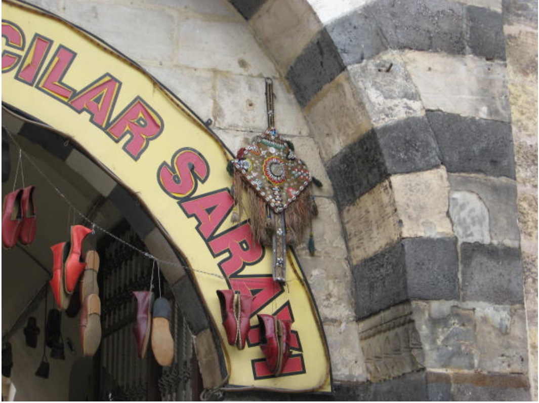
Resim 33: Aynalı çengil