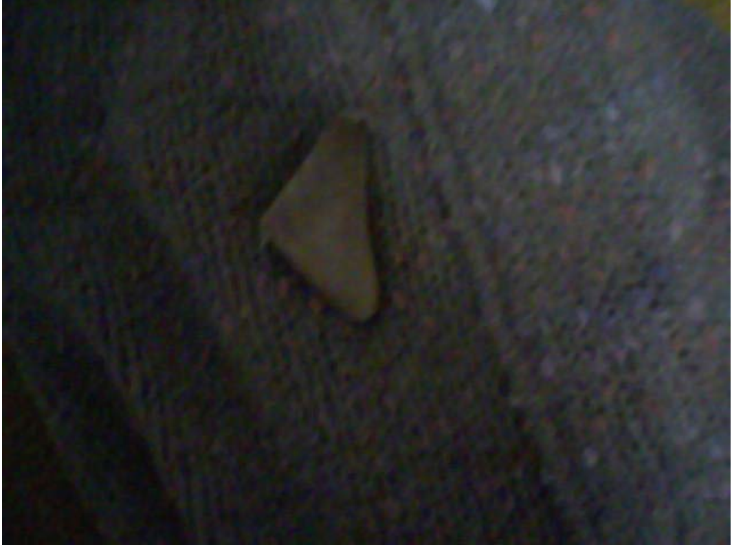
Resim 19: Hamaili