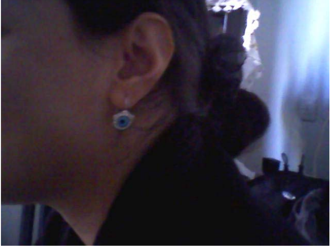
Resim 3: Bayanlar Çeşitli Aksesuarlarında Kullanmaktadır