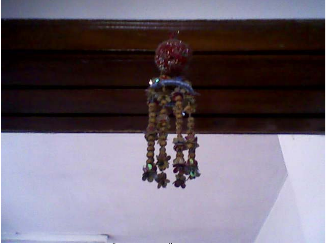
Resim 15: Evin Kapısının Üzerine Asılı Üzerlik