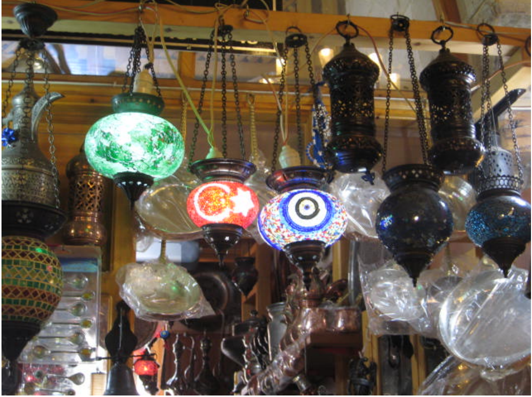
Resim 49: Nazarlıklar