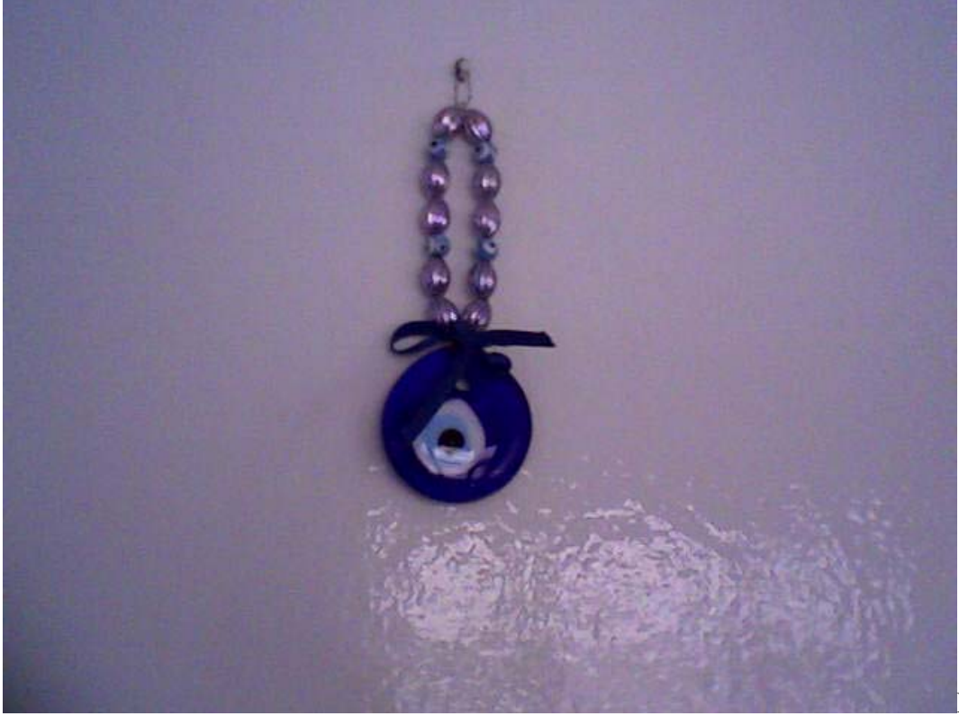
Resim 13: Evin Duvarında Asılı Mavi Boncuk