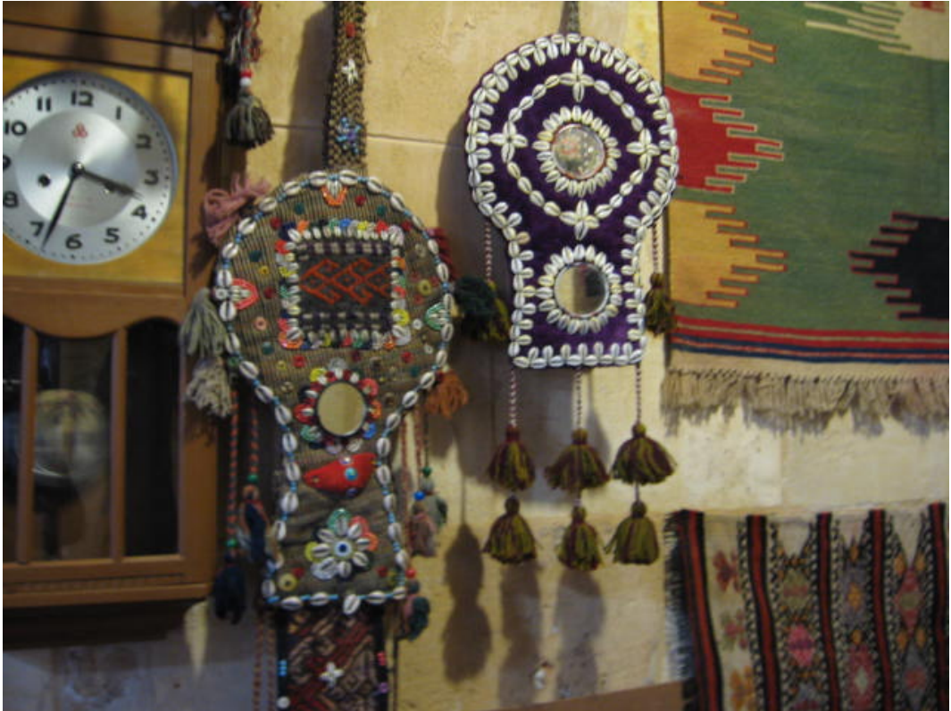
Resim 58:Aynalı çengil