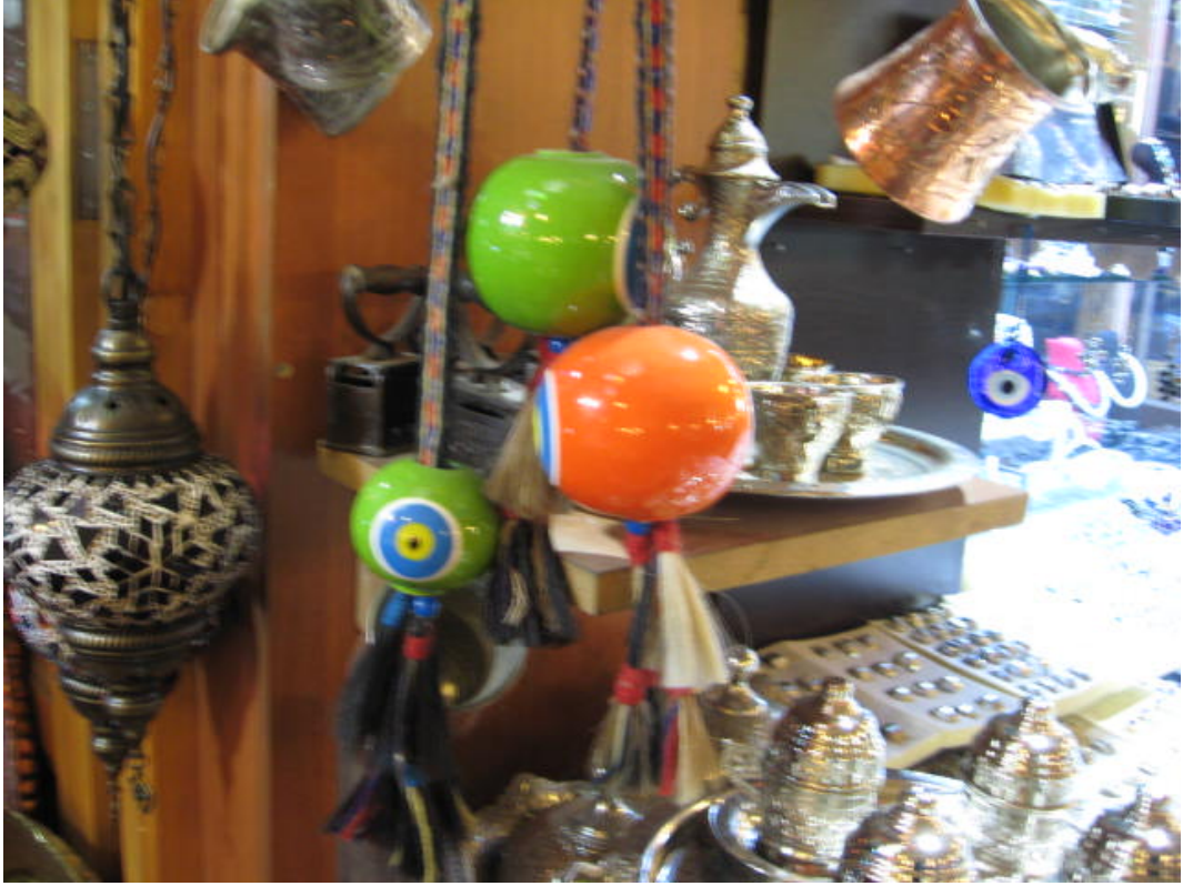
Resim 41: Çeşitli aksesuarlarda nazarlıklar