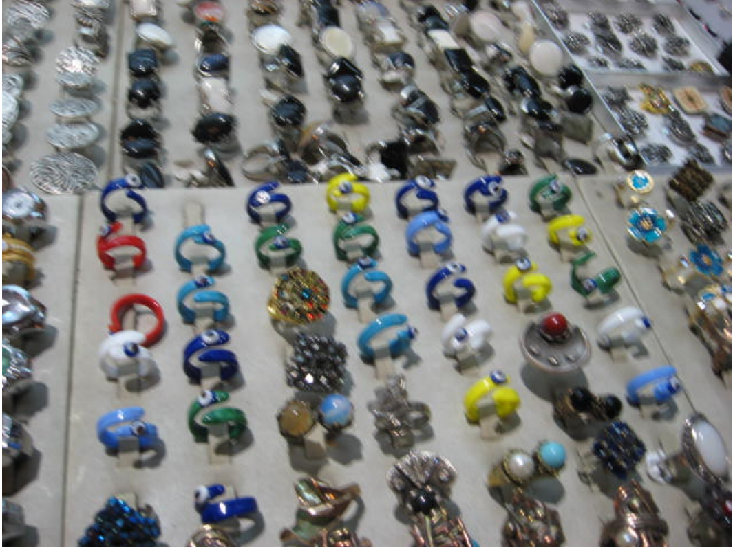
Resim 40: Aksesuar olarak satılan nazarlıklar