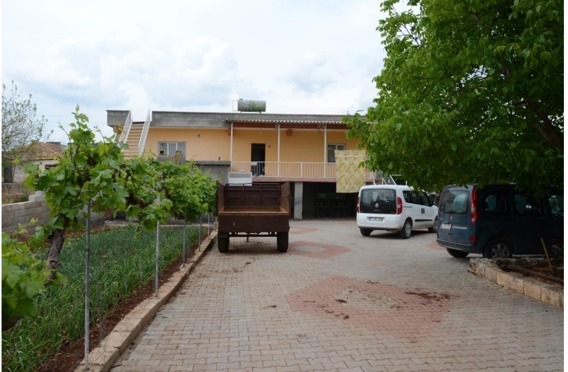
(Nadir Keskin'in evi)