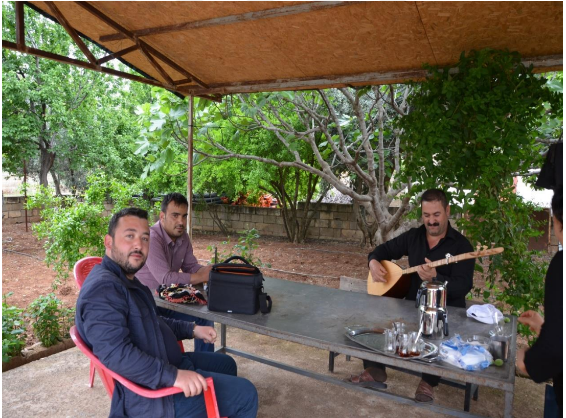
(Derlemeler sırasında çekilen bir fotoğraf-2 )