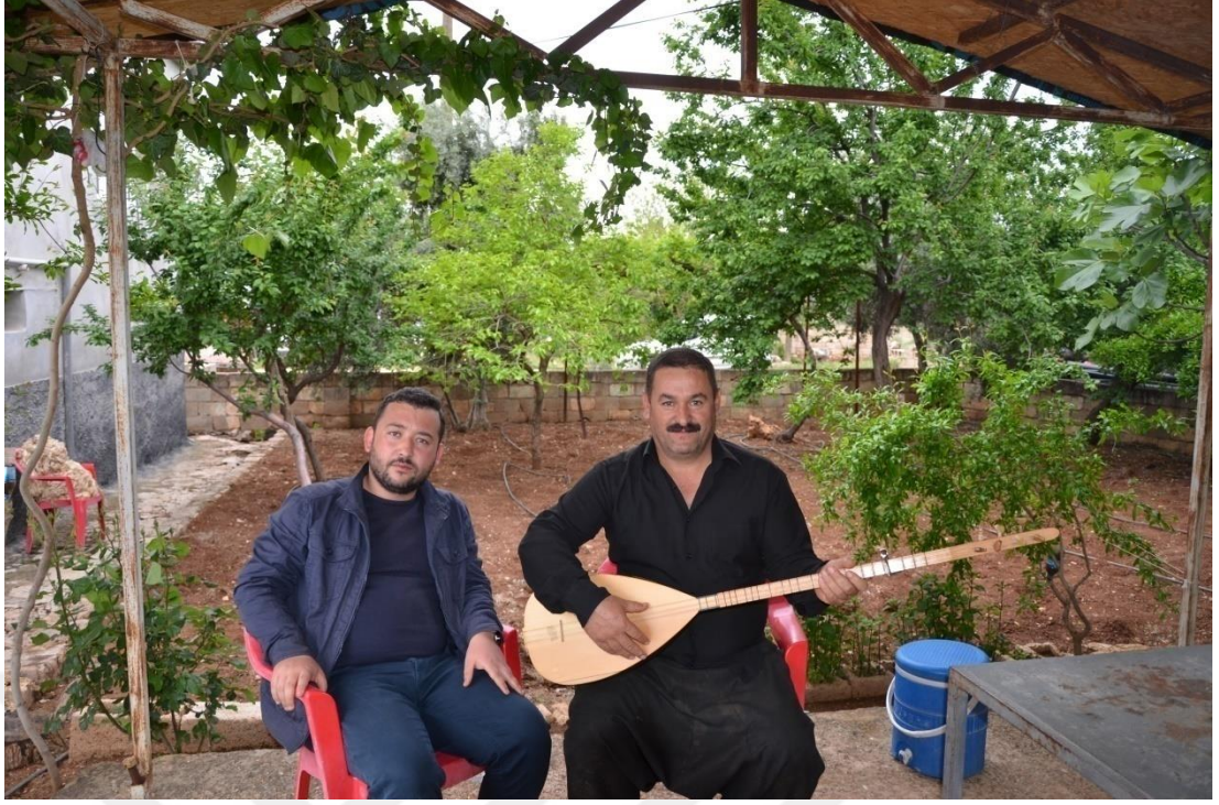
(Derlemeler sırasında çekilen bir fotoğraf -1)