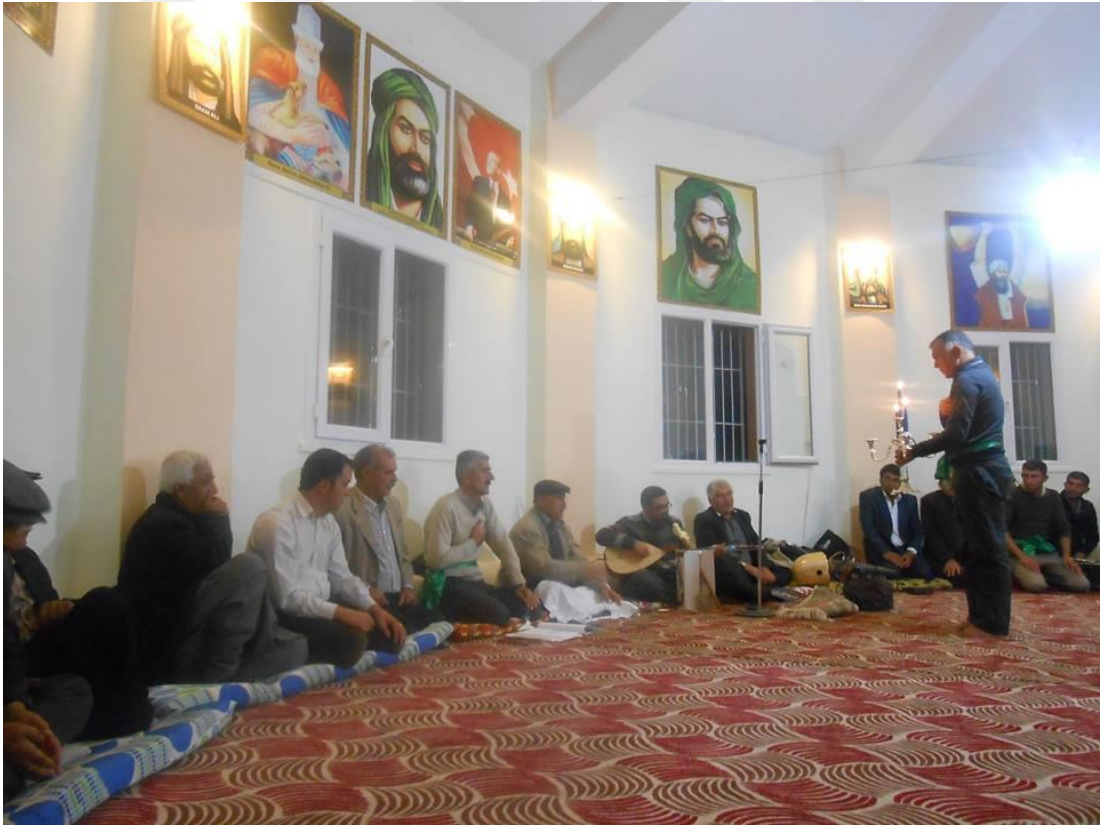
(Gaziantep Çepnilerin cem töreni)