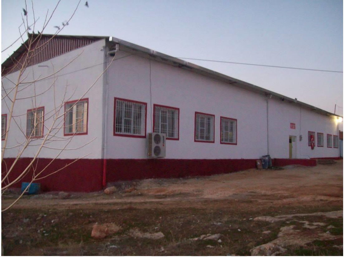
(Kuzuyatađı köyü cemevi)