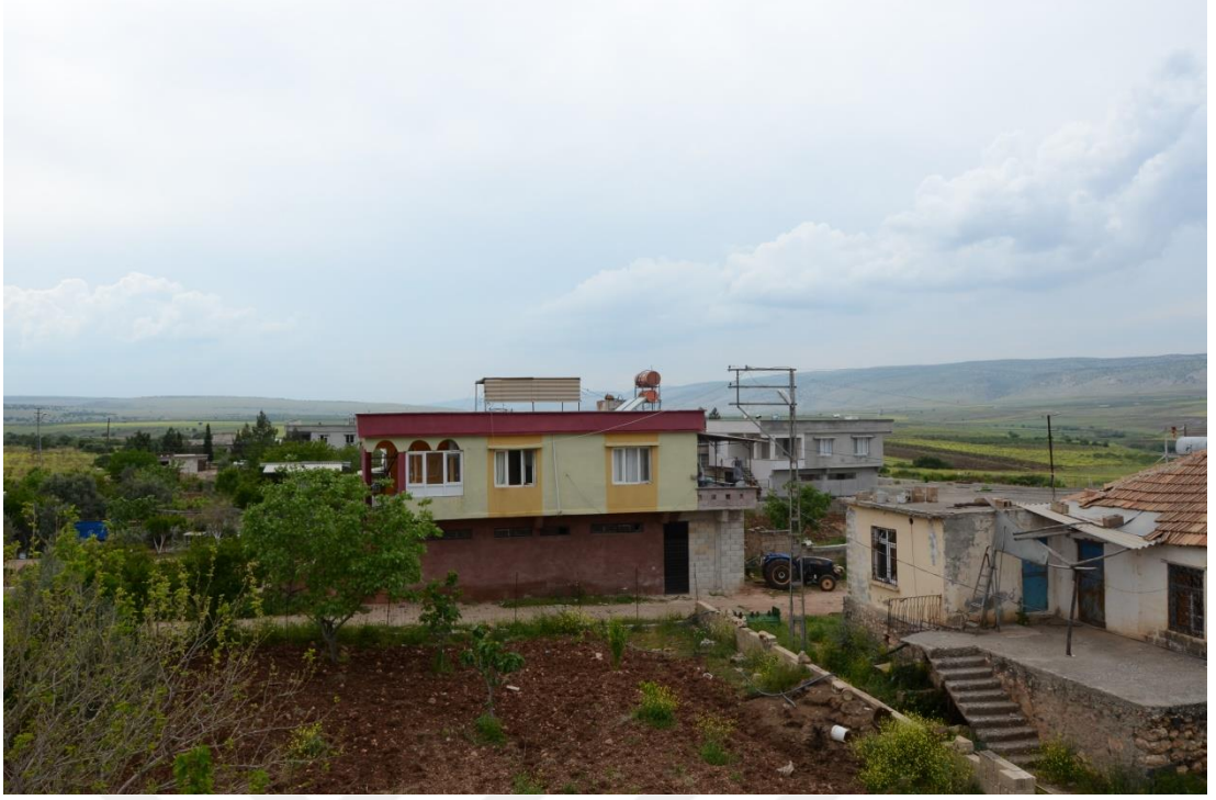
(Nadir Keskin'in Köyü)