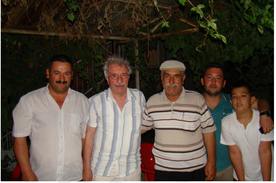
(Derlemeler sırasında çekilen bir fotoğraf-2 )