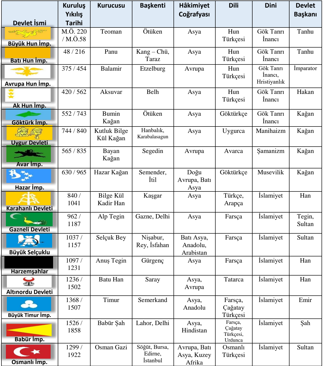
Tablo 1: Tarihteki 16 Türk Devleti 101