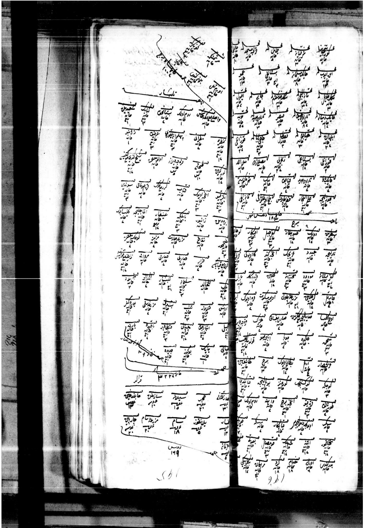
Ek 2: 68 Numaralı GŞS, s. 195-196