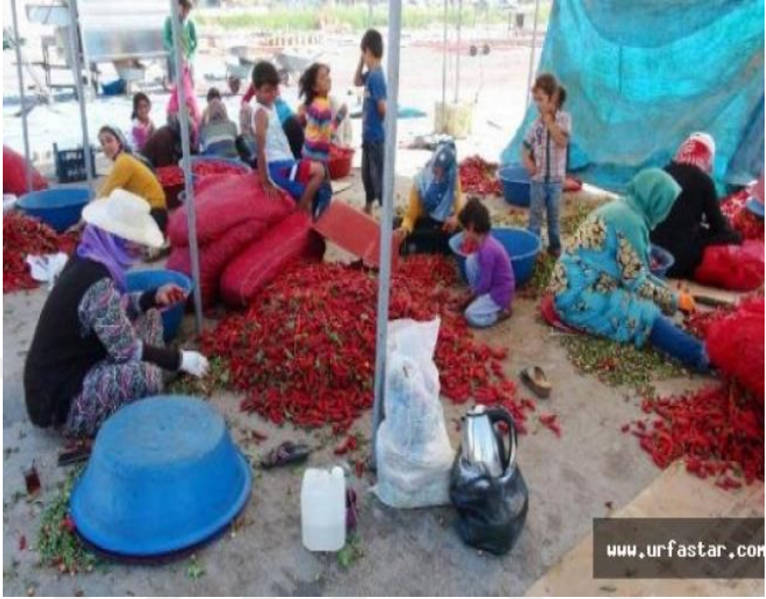
Resim 4: Haberde mevsimlik kadın işçiler ve kız çocuklarının bulunduğu bir adet fotoğraf kullanılmıştır.