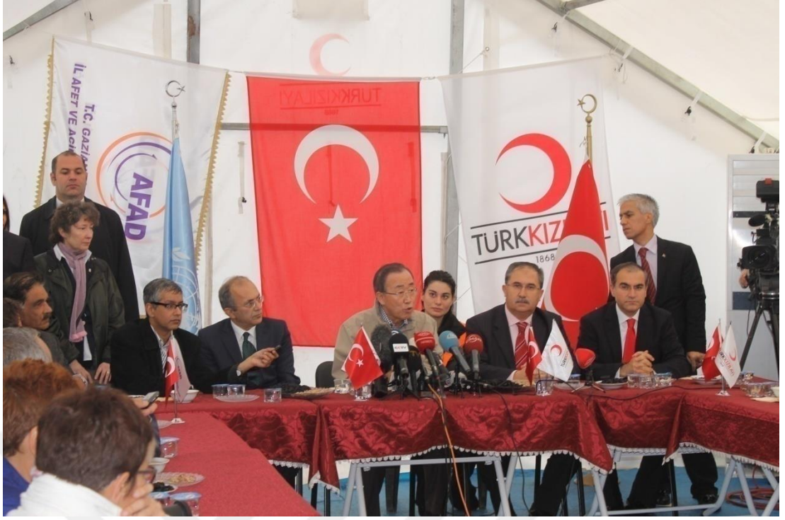
07.12.2012:Ban Ki Moon İslahiye Ziyareti