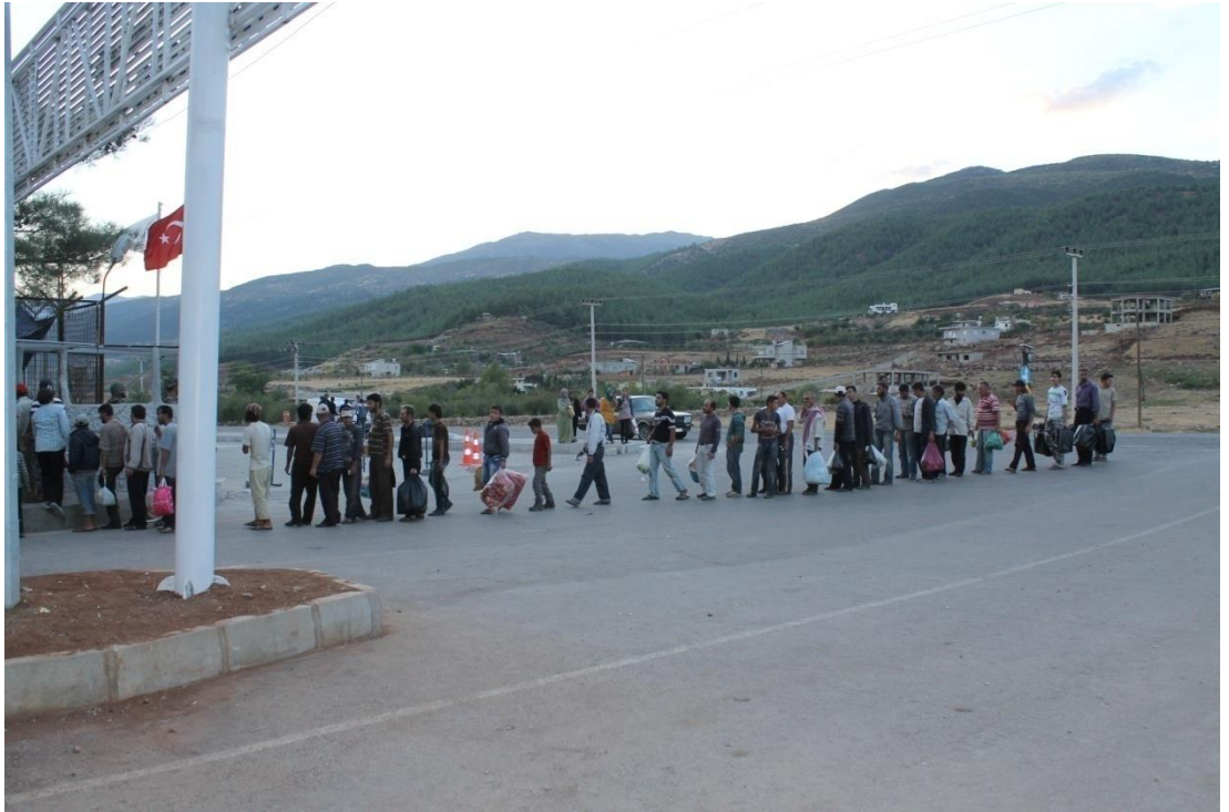
19.10.2012: 1 Nolu Çadırkent