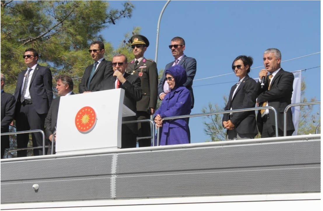
07.10.2014: Cumhurbaşkanı Recep Tayyip Erdoğan islahiye Ziyareti