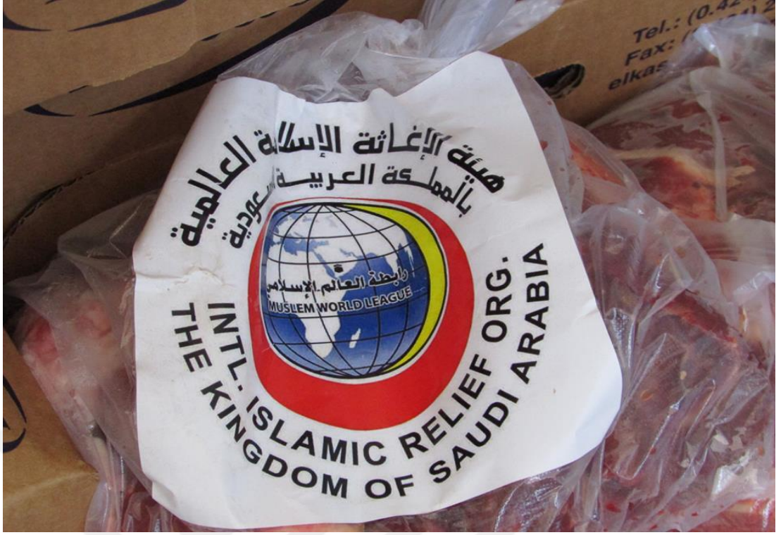
2013: Uluslararası Yardımlar Stk (Zekeriye Şimşek)