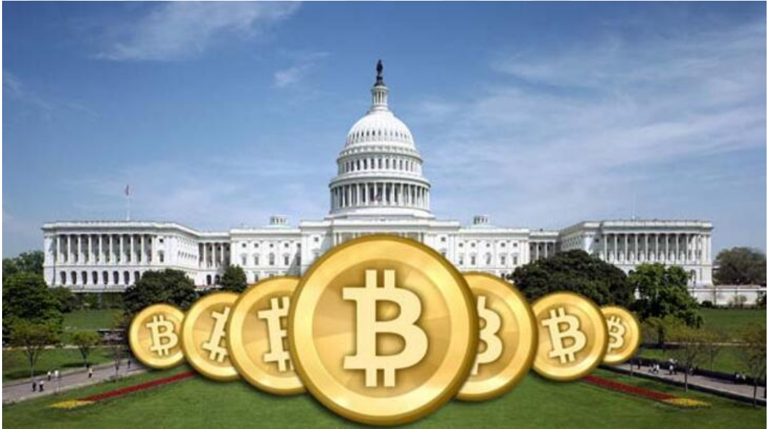
Görsel 4.3.: "ABD'nin hamlesi Bitcoin'i uçurdu!" (Milliyet.com, 20 Ocak 2018).

"Dünyanın en popüler sanal para birimi Bitcoin'in değeri iki günde yaklaşık yüzde 15 düşüş gösterdi. Bitcoin'in değeri 6 bin 273 dolara kadar gerilerken günlük kaybı ..." (Milliyet.com, 07 Eylül 2018). Bitcoinin yüzde 15 değer kaybettiği haberi aktarılırken, haberde arka planda Dolar ön planda ise Bitcoinin simgesinin kullanıldığı görsel ile beraber servis edilmesi dikkat çekicidir. Bitcoin adına olumsuz bir gelişmenin aktarıldığı haberde bu görselin kullanılmasının Bitcoin rakibi/rakipleri olan 'klasik para' karşısında konumlandırmakta olduğu varsayılmaktadır. Görselde, dolarla birlikte verilen Bitcoin'in okuyucuya tanıdıkları/bildikleri yani klasik para ile Bitcoin'in aynı ortamı paylaştığı bilgisi verilmektedir. Bu görsel Bitcoin hakkında hiçbir fikri olmayan bir okuyucuya, görseldeki simgenin tıpkı dolar gibi bir 'değer'e karşılık geldiğini işaret etmektedir.