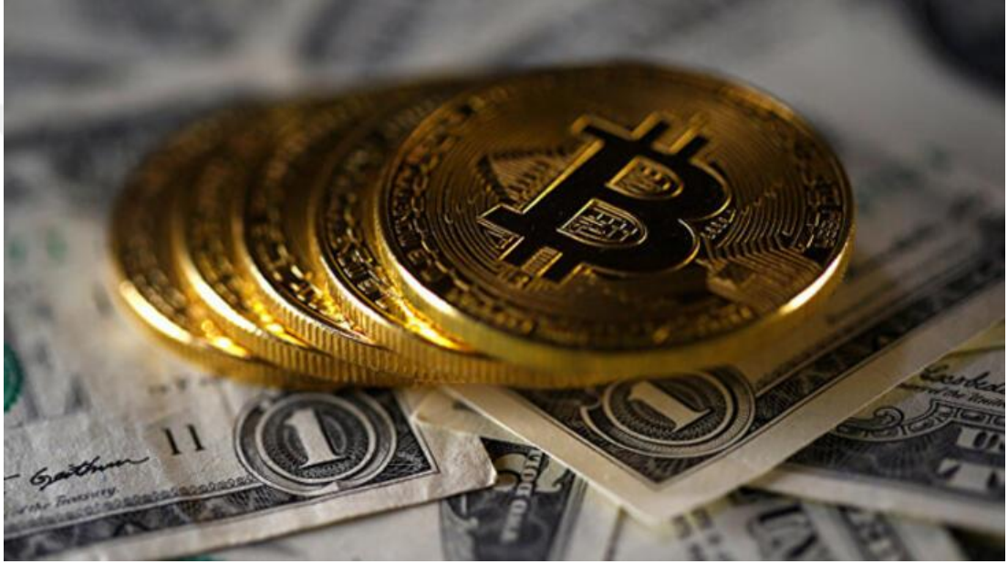
Görsel 4.1: "Flaş açıklama! Altı milyon Bitcoin kayıp" (Milliyet.com, 05 Temmuz 2018).

Görsel 4.1’de Bitcoin’in simgesi dolarların üzerine yerleştirilerek hem dolarla aynı kategoriye koyulmuş hem de okuyucuya tanıdıkları/bildikleri bir şeyle yani klasik parayla ilişkilendirilerek sunulmuştur. “Altı milyon Bitcoin kayıp” haberinde kullanılan görsel, Bitcoin’in diğer değer taşıma araçları gibi kaybolan-çalınan bir şey olduğunu anlatmaktadır. Ayrıca görselde altını anımsatan Bitcoin simgesi yıpranmış 1dolarlık banknotların üzerine koyulmuştur. Bu şekilde Bitcoin’in daha yeni ve cezbedici görüntüsü ön planda tutulmuştur. Burada görsel, Bitcoin’in iktidarlığına atıf yapmıştır.