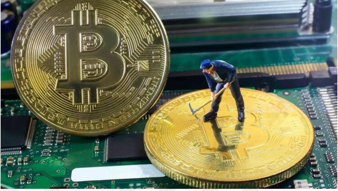
Görsel 4.8.: "Bitcoin'in değeri 20 günde fırladı" (Hürriyet.com, 21 Ağustos 2017).

Bitcoin`den ayrılarak Bitcoin Cash adıyla piyasaya çıkan sanal paranın 20 günde yüzde 133'e çıkmasını konu eden haberde söz konusu görsel kullanılmıştır. Haberde kullanılan görsel bir önceki haber görselindekine benzer bir anlamı/anlatısı vardır. Ancak bu görselde Bitcoin sembolü üzerinde kazma ile çalışan bir insan figürü dikkat çekmektedir. Elektronik kart aksamı üstünde yer alan ve Bitcoin üzerine kazı çalışması yapan kişi madencilğe işaret etmektedir. Madencilik işlemleri yazılım vasıtasıyla geliştirilen yeni algoritmalar anlamına gelmektedir. Madencilik işlemleri arttıkça Bitcoin sayısının arttığı bilinmektedir; sayısı artan Bitcoin ise taleple bağlantılı şekilde fiyatına yansımaktadır. Dolayısıyla görsel, haber metninde oluşturulan söylemi destekler şekilde kurgulanmıştır.