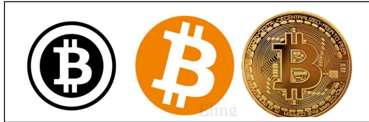
Şekil 2.2: Bitcoin sembol ve şekilleri

Bitcoin (sembolü: ₿, kısaltma: BTC) herhangi bir merkez bankası, resmi kuruluş, otorite vs. ile ilişkisi olmayan kripto para birimidir (wikipedia, 2018).