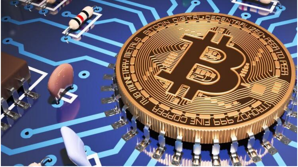
Görsel 4.7.: "Bitcoin nedir? Nasıl alınır? Daha ne kadar yükselecek?" (Hürriyet.com, 19 Aralık 2017).

Söz konusu haber görselinde elektronik devre işlemlerinde kullanılan kartta; kondansatör, direnç, entegre vs. gibi teknik malzemelerle birlikte Bitcoin simgesinin de kullanılmasının Bitcoin'in dijitalliğine gönderme yaptığı düşünülmektedir. Mevcut ekonomik sistemde Bitcoinin önemli bir işlevi olduğu hissi de verilmeye çalışılmıştır. Başlıktaki 'Bitcoin nedir?' sorusuna görsel bir ön cevap verilmektedir. Görselden yola çıkarak haberde, Bitcoin'in dijital bir olgu olarak tasvir edildiği düşünülmektedir. Görseldeki bitcoin simgesi, diğer bileşenlere nazaran daha büyük ve bu bileşenler vasıtasıyla tamamlanan bir olgu olarak tasarlanmıştır. Ayrıca bu görsel ile bitcoin, bir yapının ana parçası olarak gösterilmeye çalışılmıştır.