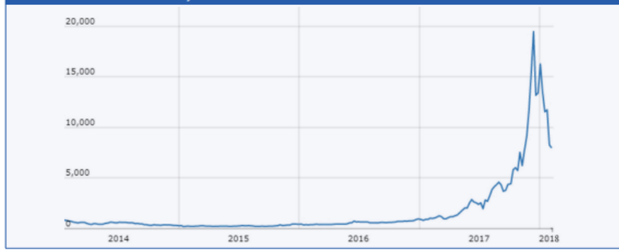
Şekil 2.3: İşleme girdiği tarihten 2018 yılına kadar Bitcoin değeri (USD) 1

Cambridge Üniversitesinin 2017 tarihinde gerçekleştirdiği araştırmaya göre; “2,9 milyon ile 8 milyon arasında kişi dijital para cüzdanına sahiptir” ( https://tr.wikipedia.org/wiki/Bitcoin , E.T:28.11.2018). Araştırmaya göre en çok kullanılan ‘dijital para’nın ise Bitcoin olduğu saptanmıştır. Ayrıca araştırmaya göre bu parayı etkin biçimde kullananların sayısı 2013 yılından bu yana ciddi manada artış göstermiştir ( https://tr.wikipedia.org/wiki/Bitcoin , E.T:28.11.2018).