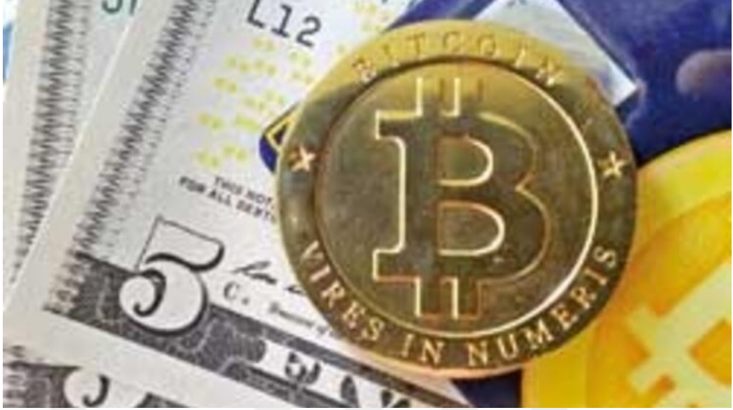
Görsel 4.6.: "Yok böyle bir para!" (Hürriyet.com, 11 Nisan 2013)

"Bitcoin'in değeri 1 ayda 7 kat artıp 218 dolara yükselirken, piyasa değeri 1.1 milyar dolara ulaştı. 10 milyon 'Bitcoin' 100 bin kişi tarafından kullanılırken, her 10 dakikada bir 25 'Bitcoin' piyasaya sürülüyor" (Hürriyet.com, 11 Nisan 2013).