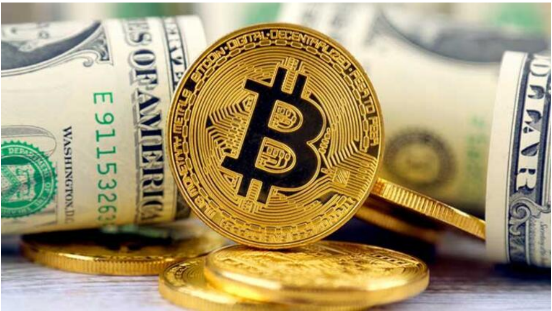
Görsel 4.2: "Bitcoin iki günde yüzde 15 değer kaybetti" (Milliyet.com, 07 Eylül 2018).