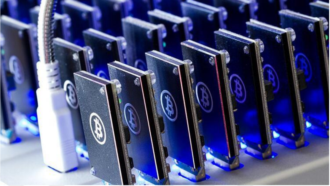
Görsel 4.5.: "Bu haber uçurabilir" (Hürriyet.com, 2 Aralık 2017).

ABD Vadeli Emtia İşlemleri Komisyonu (CFTC) Başkanı Chris Giancarlo'nun iki özel şirket ile "Bitcoin kontratlarını denetleyebilmek için standart oluşturmaya çalıştıklarını söylemesi" ve buna bağlı olarak Bitcoin'in değerlendirileceğini konu alan haberde; kullanılan görsel ve başlık birlikte düşünüldüğünde, görselin olayın bir yüzünü yansıttığı düşünülmektedir. Görselde Bitcoin'in sadece teknolojik yönü ön planda tutulmuştur. Haberin detayını okumayan ve Bitcoin ile ilgili bir malumata sahip olmayan bir okuyucu için görsel ve başlık, Bitcoin'in varlığına işaret etmektedir. Bu işaret ise; Bitcoin'in dijital-teknolojik bir olgu olmasına yöneliktir. Ancak haberin detayında değerinin on katı kadar artacağı yönünde bilgiler yer almasına rağmen, görselin tam anlamıyla ne başlığa ne de haberin detaylarına karşılık gelmediği görülmektedir.