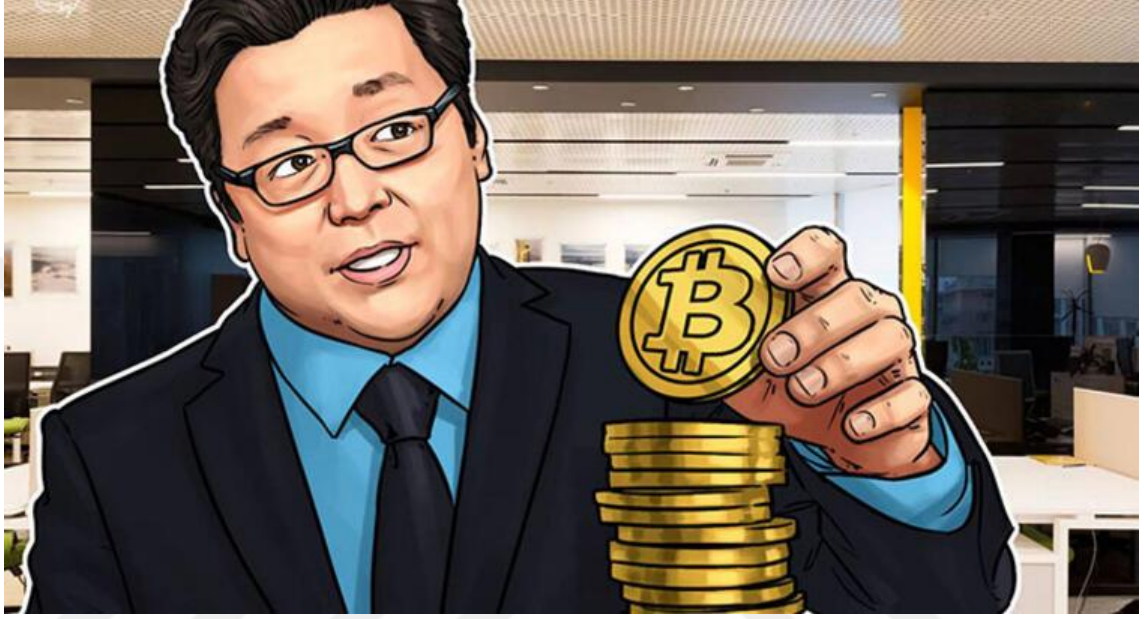
Görsel 4.4.: "Bitcoin, yıl sonuna kadar 25 bin dolar olacak" (Milliyet.com, 11 Temmuz 2018).

vermektedir. Haber metni ve görsel aynı argümanları ‘konuşmak’tadır. Haber metninde bazı ülkelerin bitcoin’e yasaklamalar ya da kısıtlamalar getirdiği vurgulanmıştır. Görsel ise Bitcoin’in Beyaz Saray dolayısıyla ABD tarafından desteklediğini okuyucuya iletmektedir.