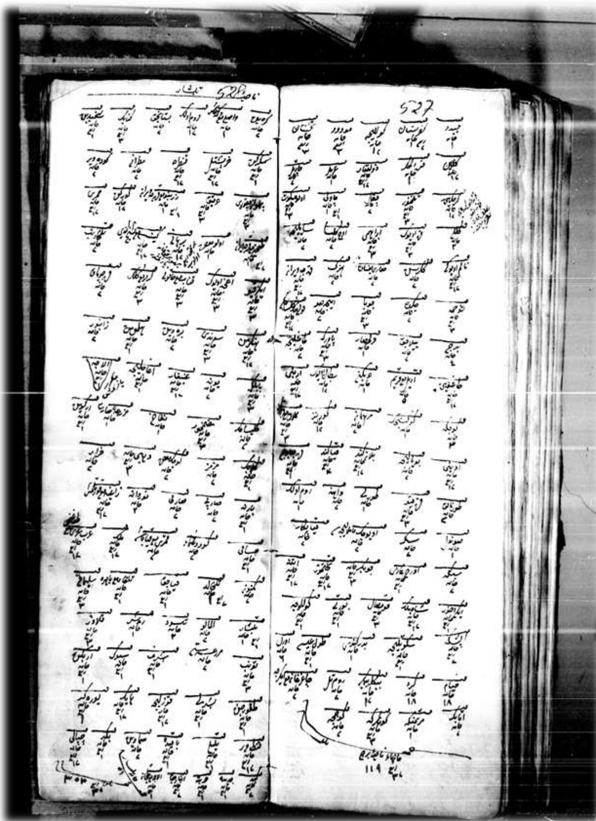
Ek 6: 68 Numaralı GŞS, s.527-528