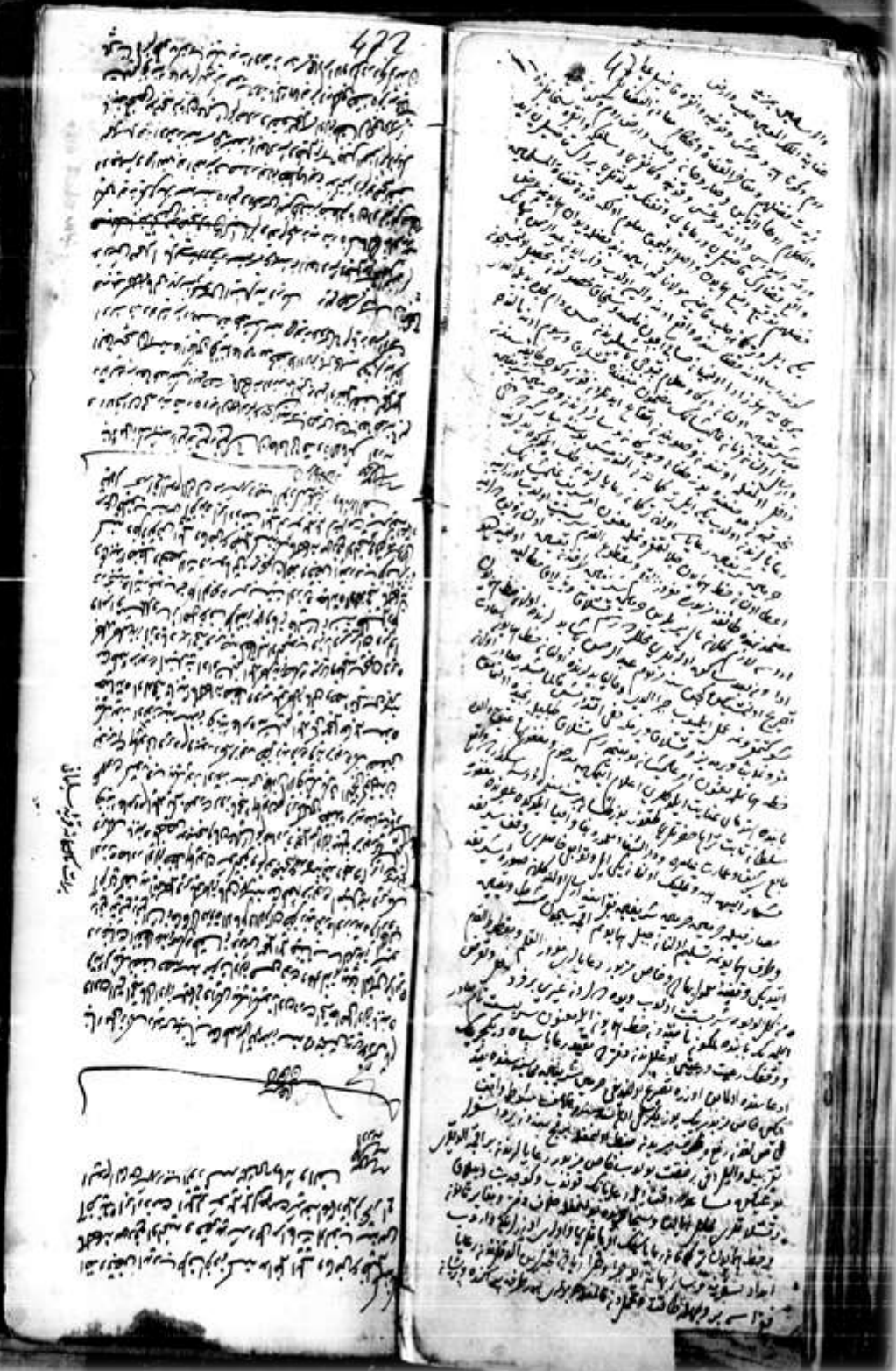
Ek 4: 68 Numaralı GŞS, s.472-471