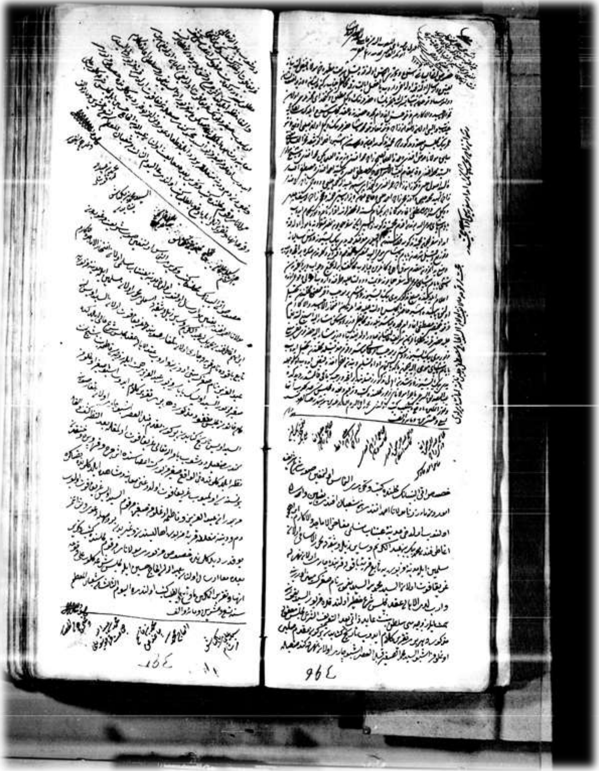
Ek 1: 68 Numaralı GŞS, s.395-396