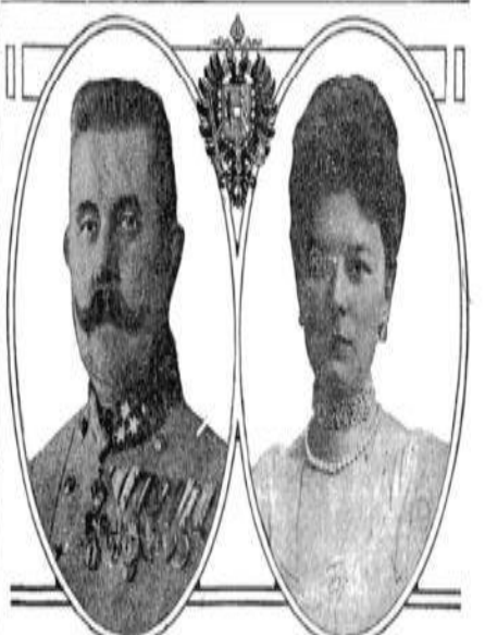
Archduke Francis Ferdinand and his consort, the Duchess of Hohenberg, slain by assassin's bullets.