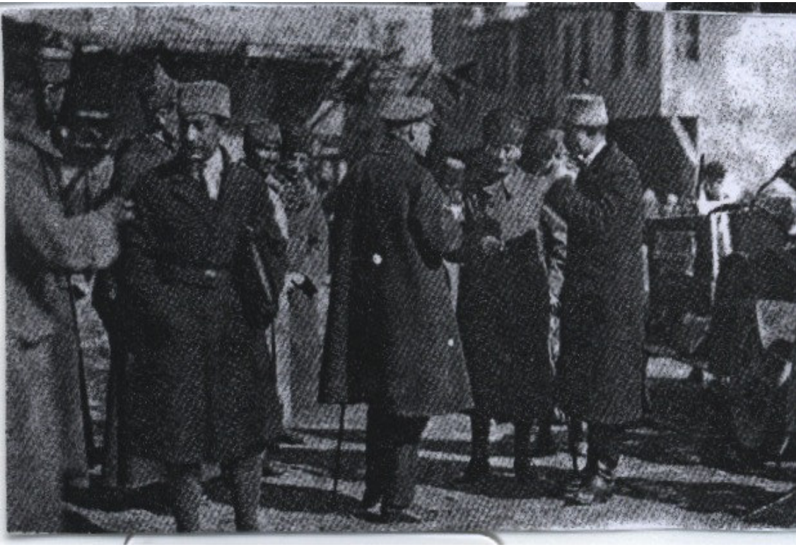
EK-7: Mustafa Kemal Paşa tam yetkili Sovyet elçisi Aralov'la Akşehir'de. (Tuğlacı, 1987: 564).