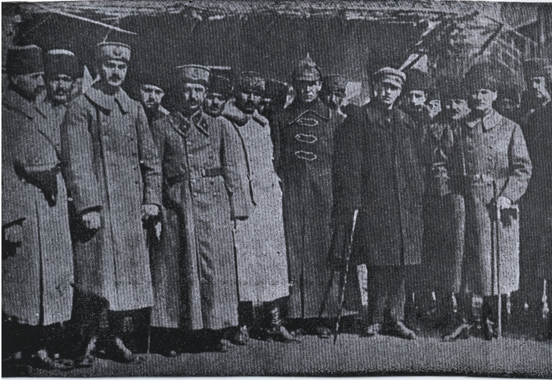
EK-6: Atatürk, Batı Cephesi Komutanı İsmet İnönü, Genelkurmay Başkanı Asım Gündüz ve Sovyet Elçiliği mensupları ile (1922) (Gürsel, 1968: 184).