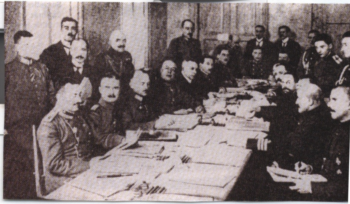
EK-3: I. Dünya Savaşı'nda Ruslarla barışı sağlayan Brest - Litovsk Antlaşması'nın görüşmeleri sırasında Türk ve Sovyet heyetleri bir arada (Orhan Koloğlu, (2001): Türk - Sovyet ilişkileri , Popüler Tarih Dergisi, Şubat, Sayı: 9, s. 38).