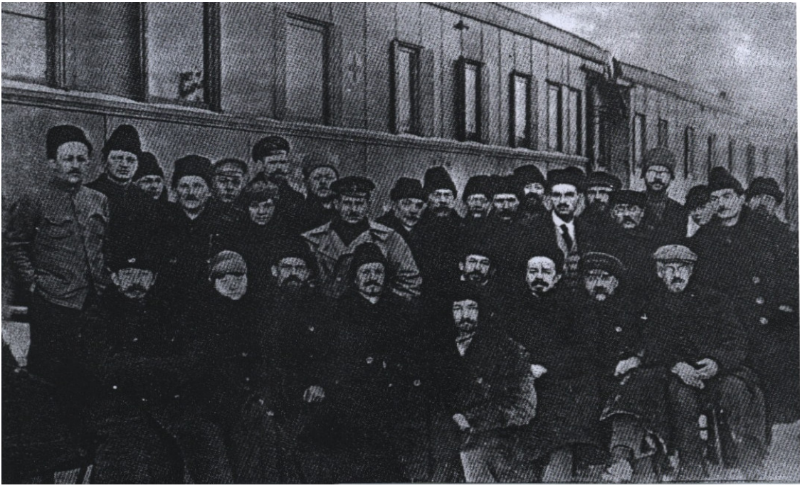
EK-5: Herhangi bir saldırıya uğramaması için üzerinde Kızılhaç bulunan vagonlarla Sovyetler tarafından Türkiye'ye yardım olarak gönderilen külçe altınları Kars istasyonunda teslim alan Türk heyeti ve yardım getiren Rus görevlileri bir arada (Tuğlacı, 1987: 558).