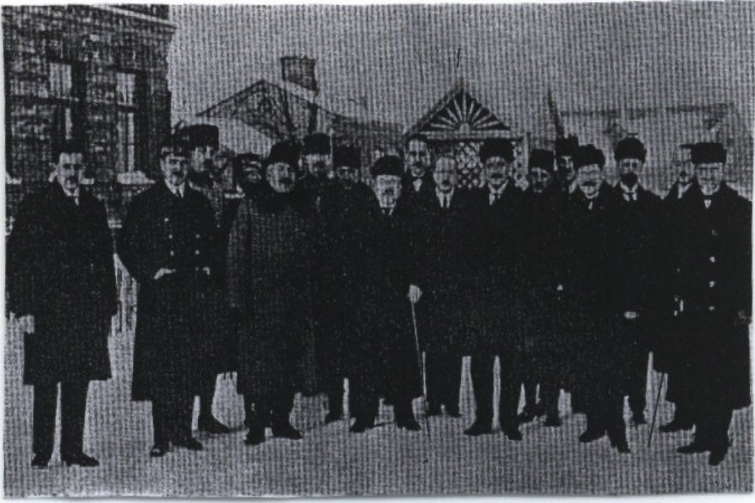
EK-1: Brest - Litovsk Antlaşması görüşmelerine katılan Osmanlı murahhas heyeti (resimde Talat Paşa, İbrahim Hakkı Paşa, Ahmet İzzet Paşa, Rauf Orbay ve Hrant Abro görülmektedir.) (Tuğlacı, 1987: 524).