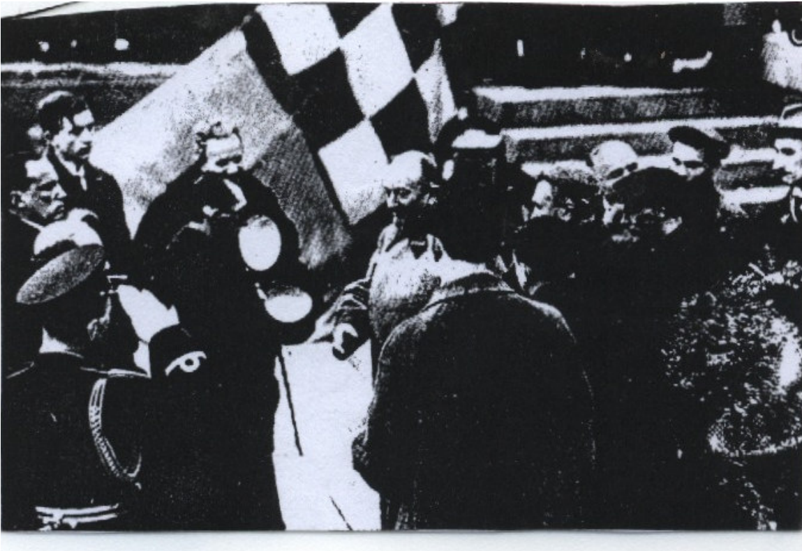
EK-10: Türkiye Dışışleri Bakanı Tefvik Rüştü Aras ile SSCB Dışışleri Bakanı Çiçerin Odesa’da (1926) (Tuğlacı, 1987: 578).