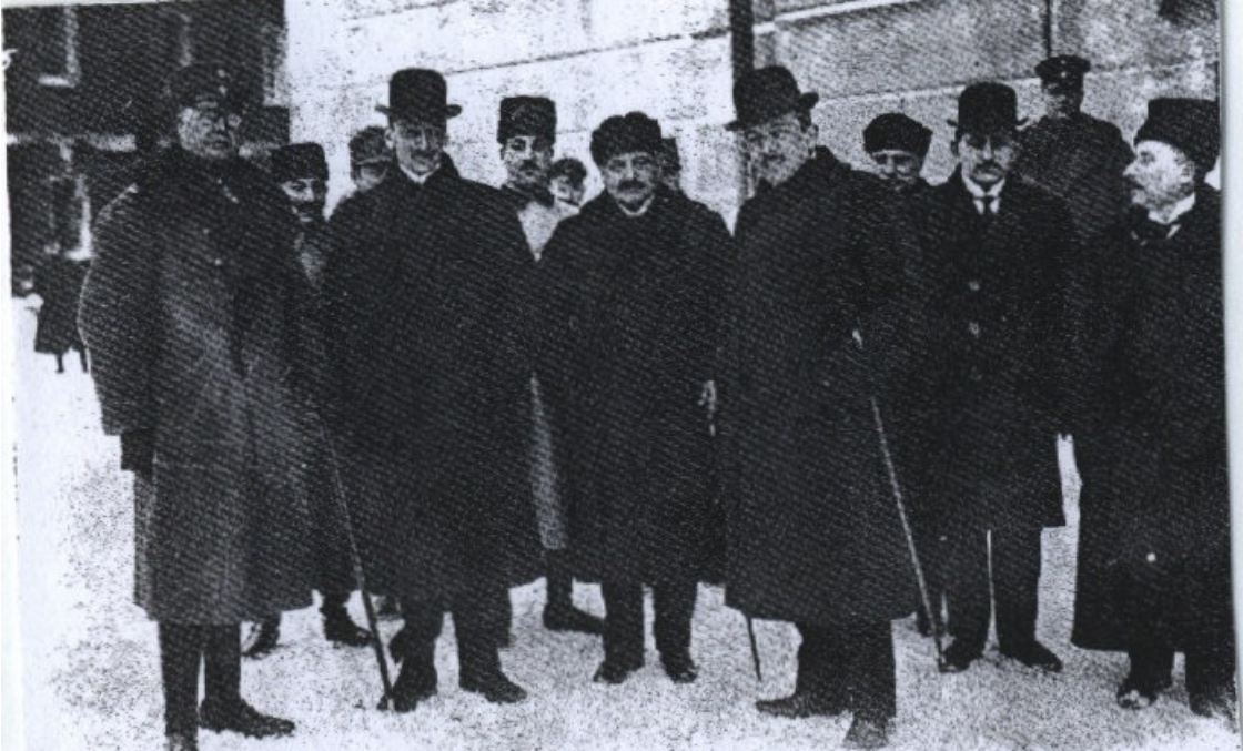
EK-2: Brest - Litovsk Barış Antlaşması'nda hazır bulunan delegelerden bazıları (iki melon şapkalı kişinin arasında duran Sadrazam Talat Paşa'dır.) (Tuğlacı, 1987: 524).