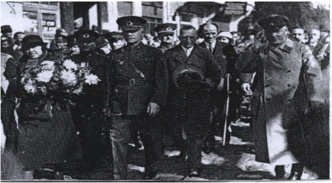
EK-15: Mareşal Voroşilov ve Şükrü Naili Paşa İstanbul'da (Tuğlacı, 1987: 585).