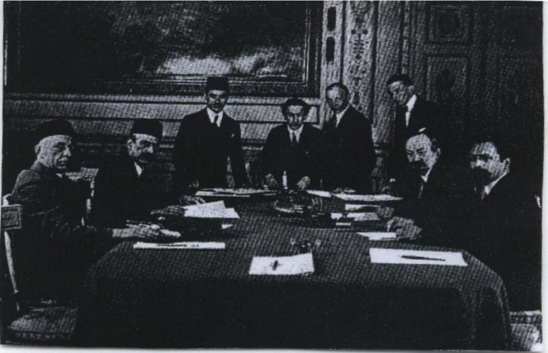
EK-4: Sovyetler Birliği ile Türkiye arasında Dostluk ve Kardeşlik Antlaşması'nın imzalanışı (Moskova, 16 Mart 1921) (Tuğlacı, 1987: 554).