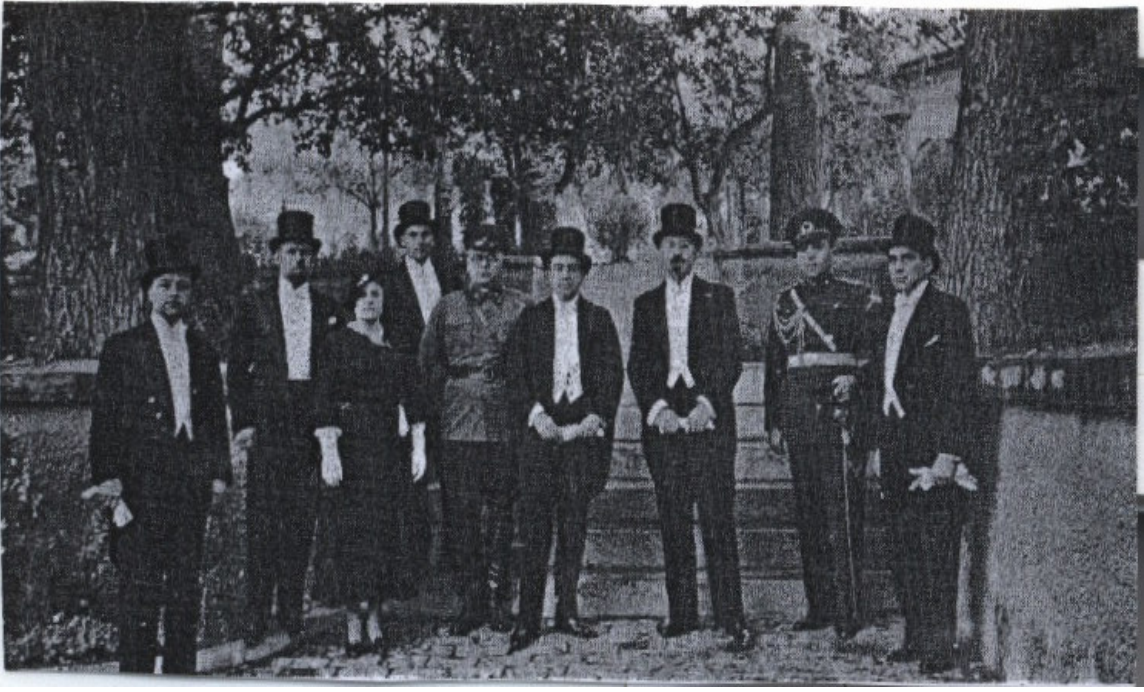
EK-11: SSCB Hariciye Komiseri Leon Karahan, Ankara'da Sovyet Büyükelçiliği mensupları ile (Tuğlacı, 1987: 589).