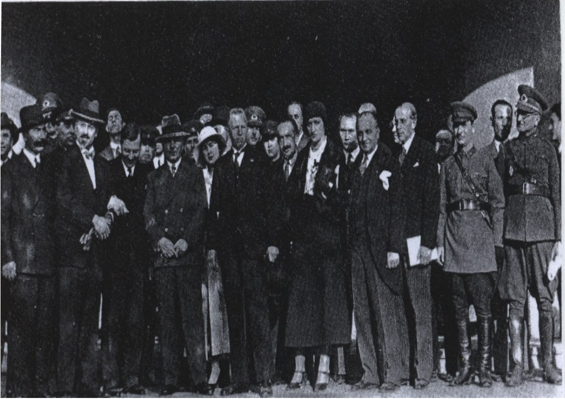
EK-12: Sovyet Hariciye Komiseri Leon Karahan'ın maiyetiyle Türkiye'ye gelişinde Ankara'da Türk ilgililerince karşılanması (16 Aralık 1929) (Tuğlacı, 1987: 589).