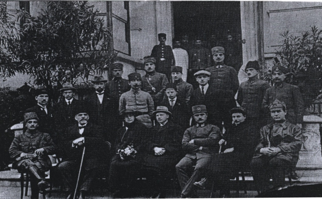
EK-8: Sovyetler Birliği'nin tam yetkili elçisi olarak Türkiye'ye gelen Semiyon Aralov, Ankara'daki SSCB Sefareti üyeleri ve Türk subayları ile (Tuğlacı, 1987: 563).