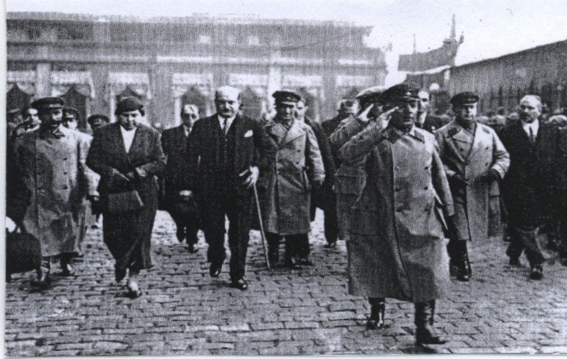
EK-14: Cumhuriyetin 10. yıldönümünde hazır bulunmak üzere Türkiye'yi resmen ziyaret eden Sovyet Orduları Başkomutanı Mareşal Kliment Yefremoviç Voroşilov, Kızılordu Süvari Genel Müfettişi, Budyonni ve Hariciye Komiseri Leon Karahan, İstanbul'da Vali Muhittin Bey (Üstündağ) tarafından karşılanması (26 Ekim 1933) (Tuğlacı, 1987: 585).