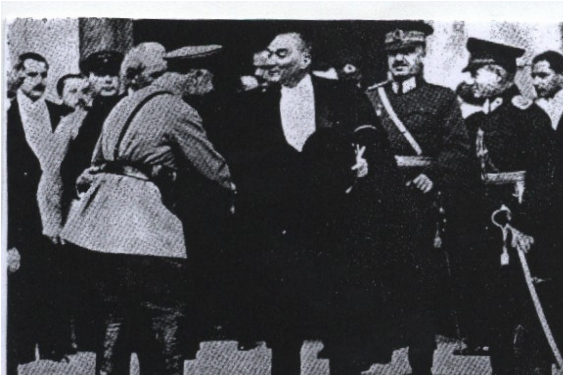
EK-16: Cumhuriyetin 10. yıldönümünde Sovyet Mareşali Voroşilov, Cumhurbaşkanı Atatürk'e tebriklerini sunarken (29 Ekim 1933) (Tuğlacı, 1987: 585).