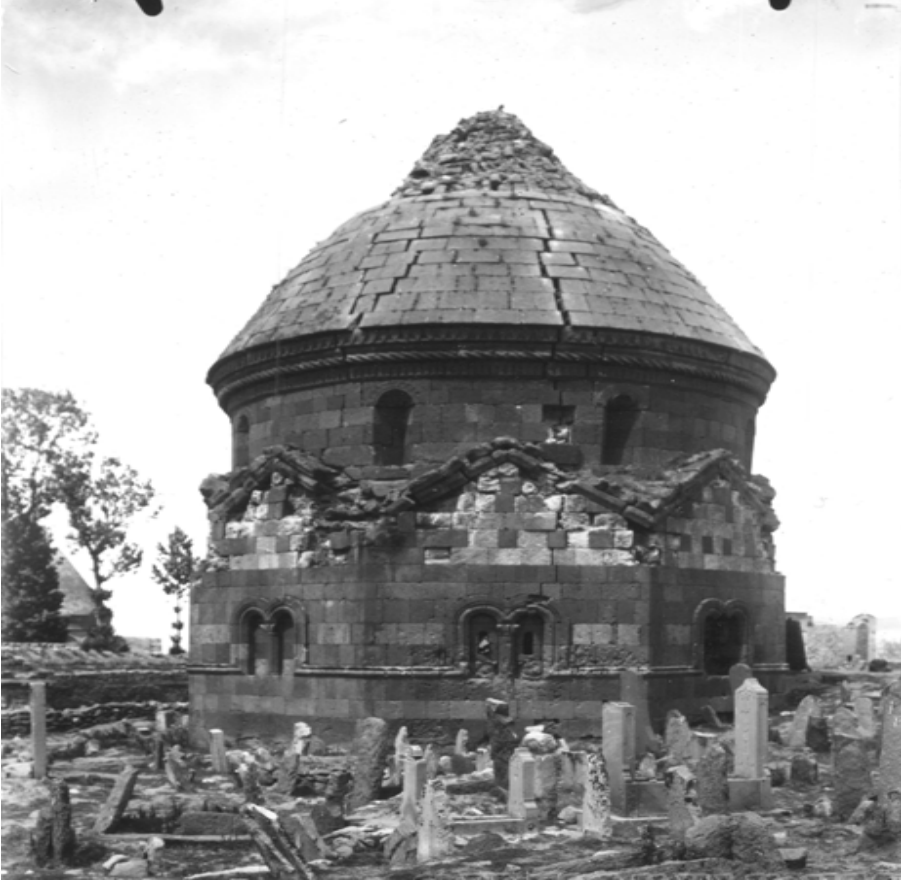
Resim-3: Erzurum'daki Üç Kümbetler