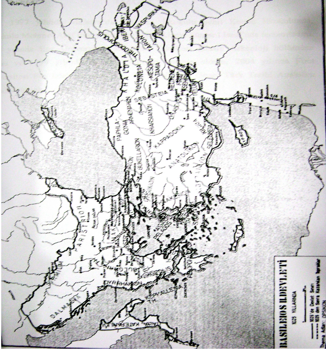
Harita-2: Georg Ostrogorsky, Bizans Devleti Tarihi, Ankara 1999, s.288.