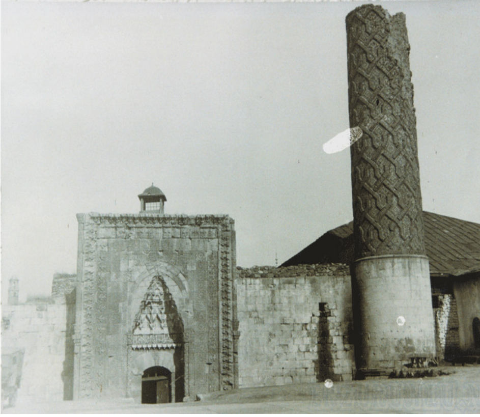
Resim-2: Erzurum'daki Çifte Minareli Medrese