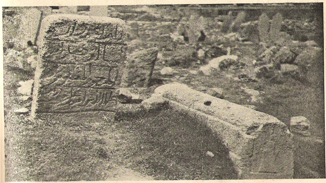
Resim-1: Erzurum'daki eski mezar taşları, Abdurrahim Şerif BEYGU, Erzurum, İst 1936, s.158