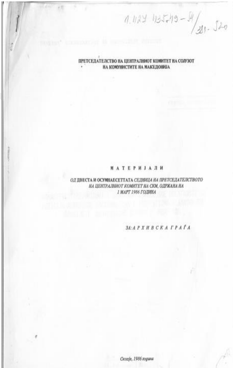
Ek. 4: Makedonya Arşiv Belgeleri.