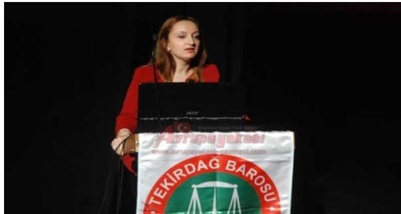
Resim 15: “Aile Hukuku” Semineri 357