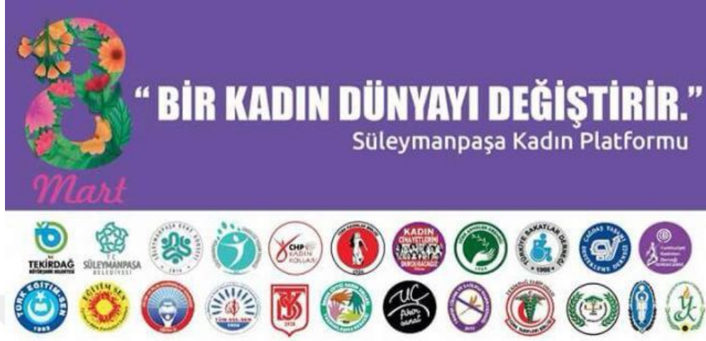
Resim 2: Süleymanpaşa Kadın Platformu Logosu