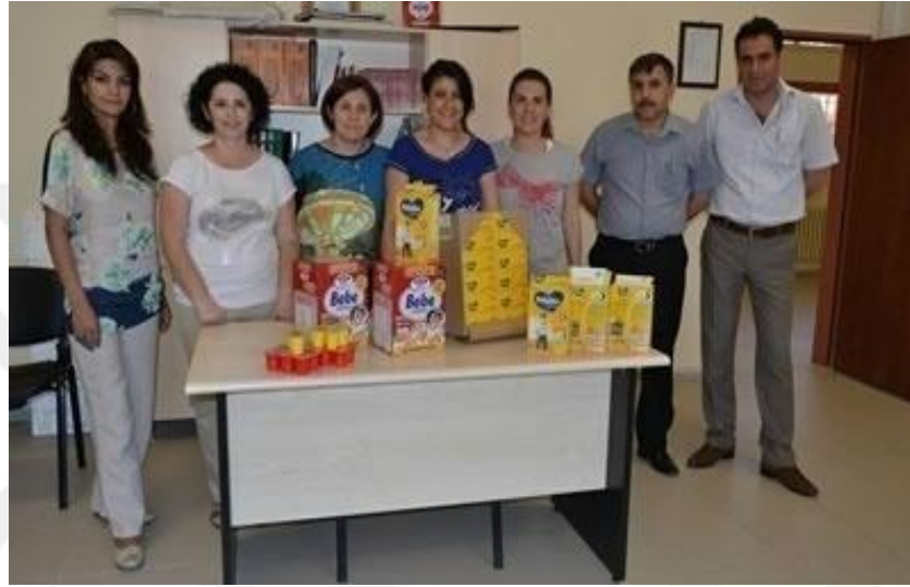
Resim 10: “Cezalandırmadık Ödüllendirdik” Projesi

KASAİD Çorlu Şubesi'nin Tekirdağ T1 Kapalı Cezaevi'ndeki kadın ve çocuklara yardım paketi dağıtımı