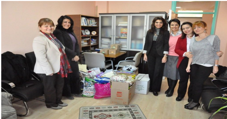
Resim 17: Cezaevindeki Kadınlara Destek Projesi 361