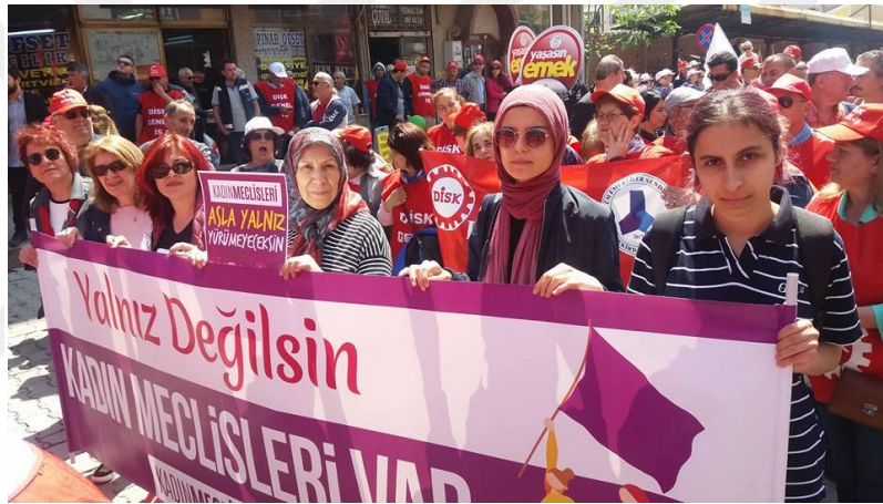
Resim 6: “Yalnız Değilsin Kadın Meclisleri Var” Yürüyüşü

1 Mayıs 2018 İşçi Bayramı'na Kadın Cinayetlerini Durduracağız Platformu Tekirdağ Şubesi “Yalnız Değilsin Kadın Meclisleri Var” pankartıyla kadın kortejinde yürüyüşe katılmıştır.