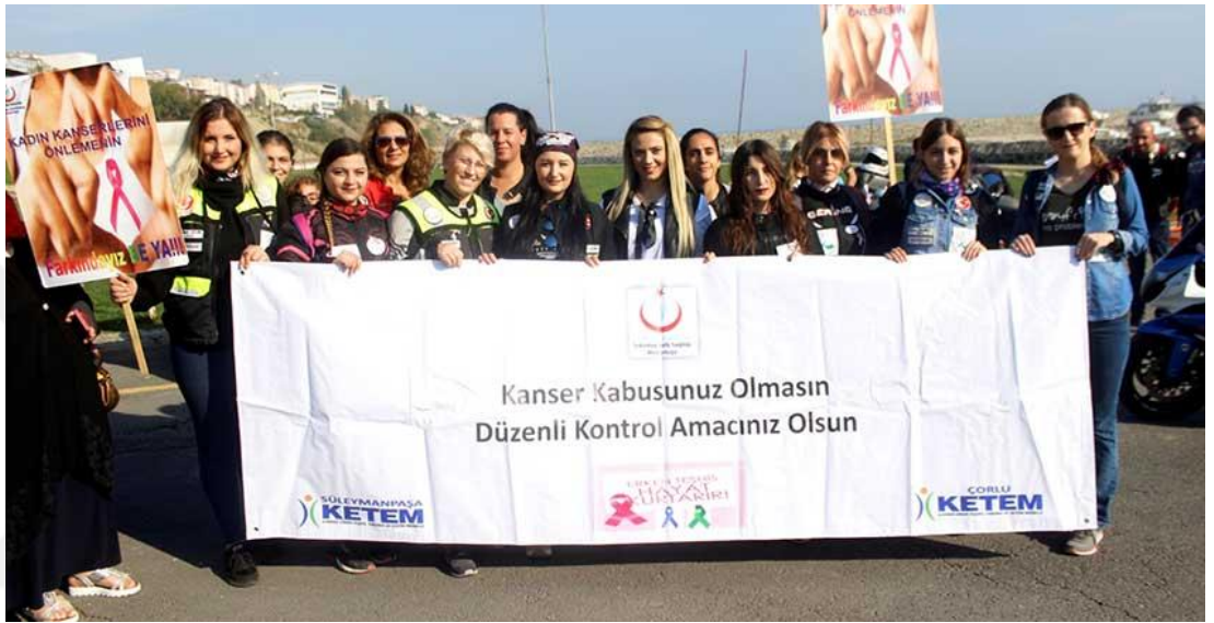
Resim 12: “Meme Kanseri Farkındalık Sürüşü” 345