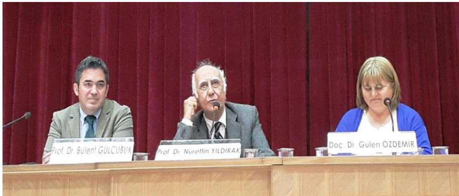
Resim 18: Kadınla Geleceğe Sempozyumu 362