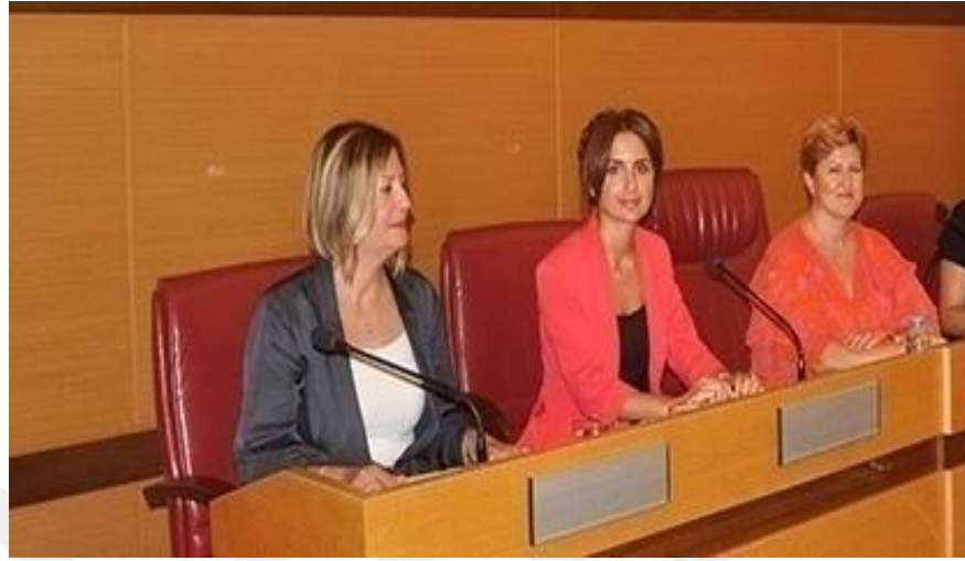
Resim 14: “Kadına Yönelik Şiddet ve Boşanma Hukuku” Paneli 355