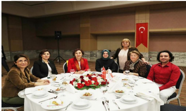
Resim 19: Aile ve Sosyal Politikalar Bakanı Tarafından Düzenlenen İstişare Toplantısı 363

"NAKSAM üniversite çatısı altında kurulmuş olan bir birim olduğu için daha çok eğitim seminerleri, sempozyumlar, konferanslar ve sergiler gibi akademik çalışmalara ağır vermektedir."