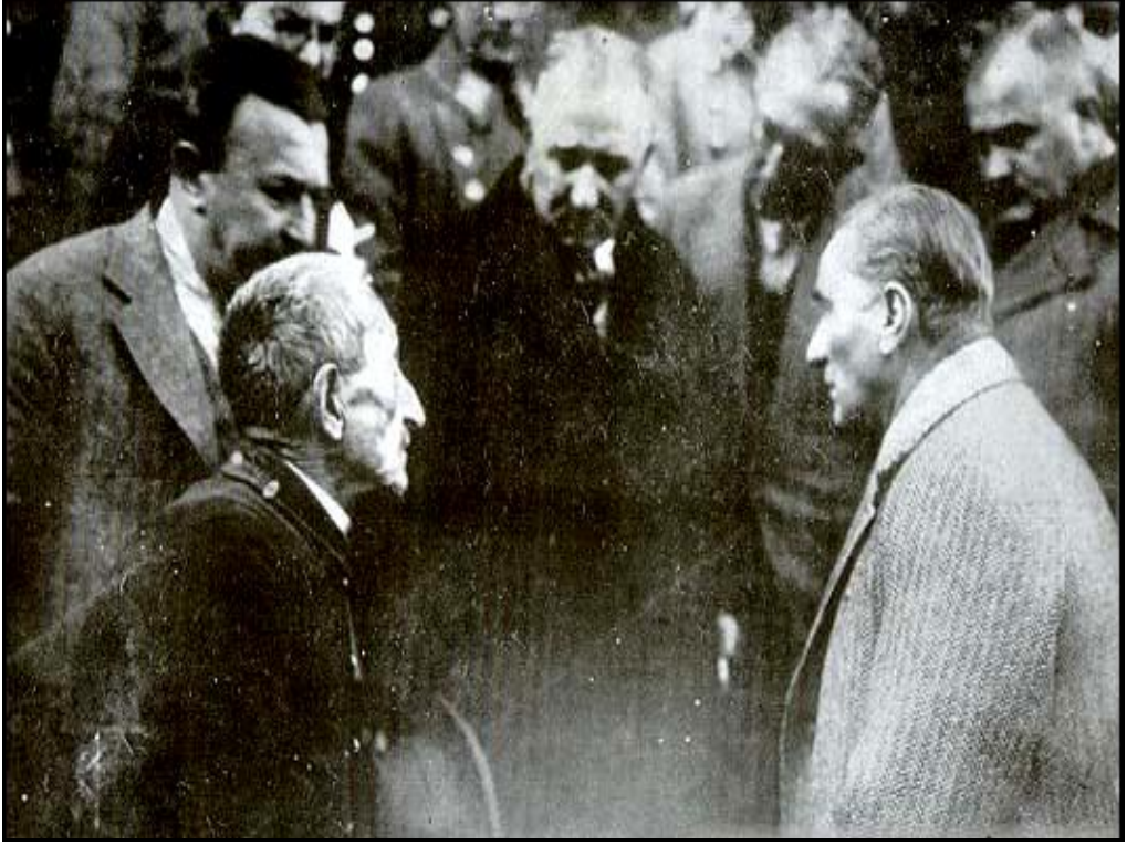
Atatürk Amasya'da vatandaşıyla konuşuyor. (22 Kasım 1930)