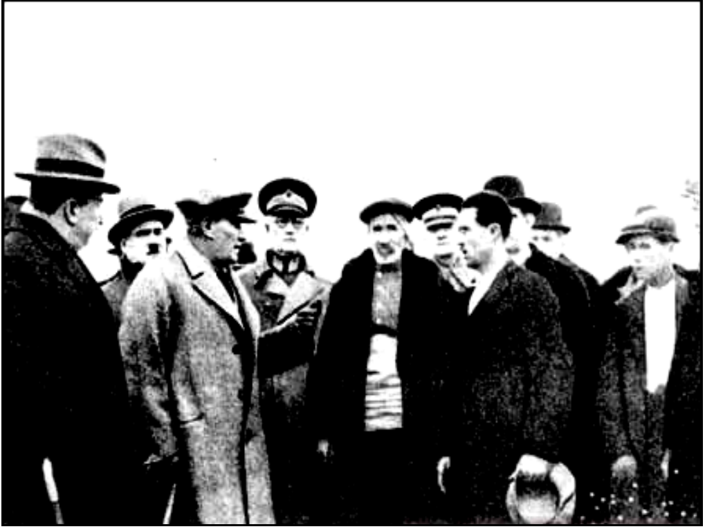
Edirne'de Kemalköy'de çeltik üreticileriyle (23 Aralık 1930)