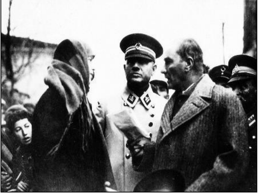
Atatürk, Sonbahar Yurt Gezisi'nde bir bayan yurttaşla konuşurken.