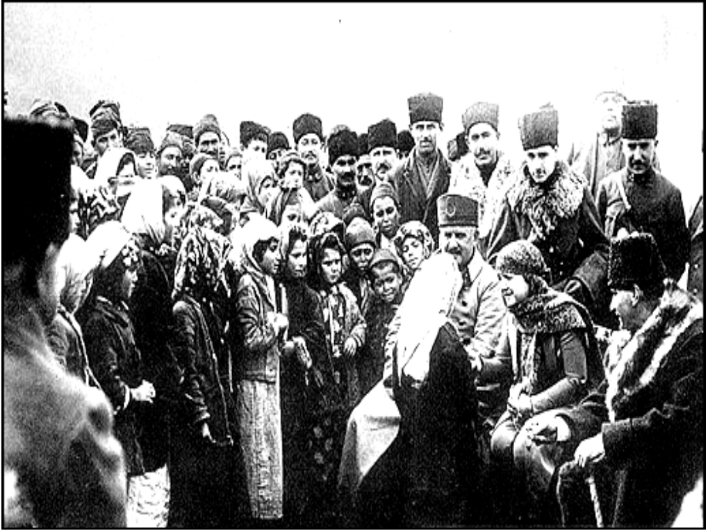
M.Kemal Paşa, Edremit yolu üzerindeki Ergama köyünde (6 Şubat 1923)