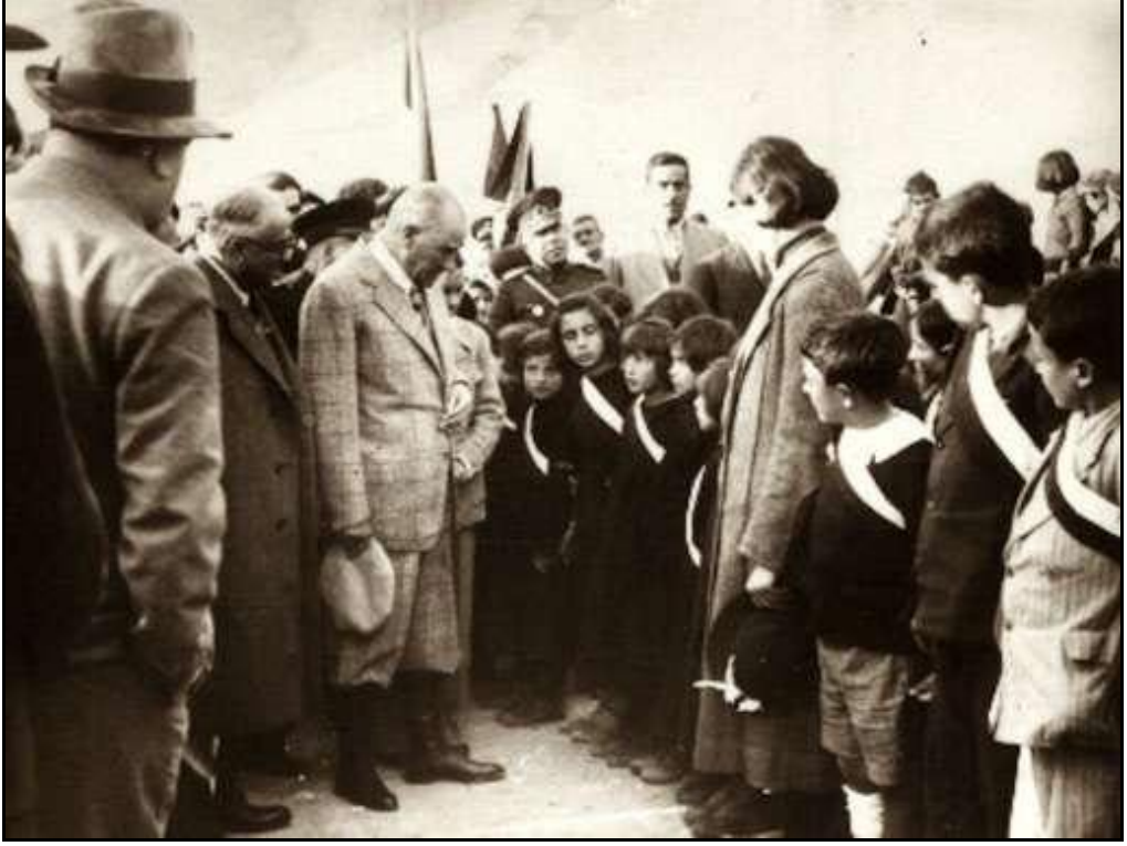
Atatürk Pertek'te Öğrencilerle (17 Kasım 1937)