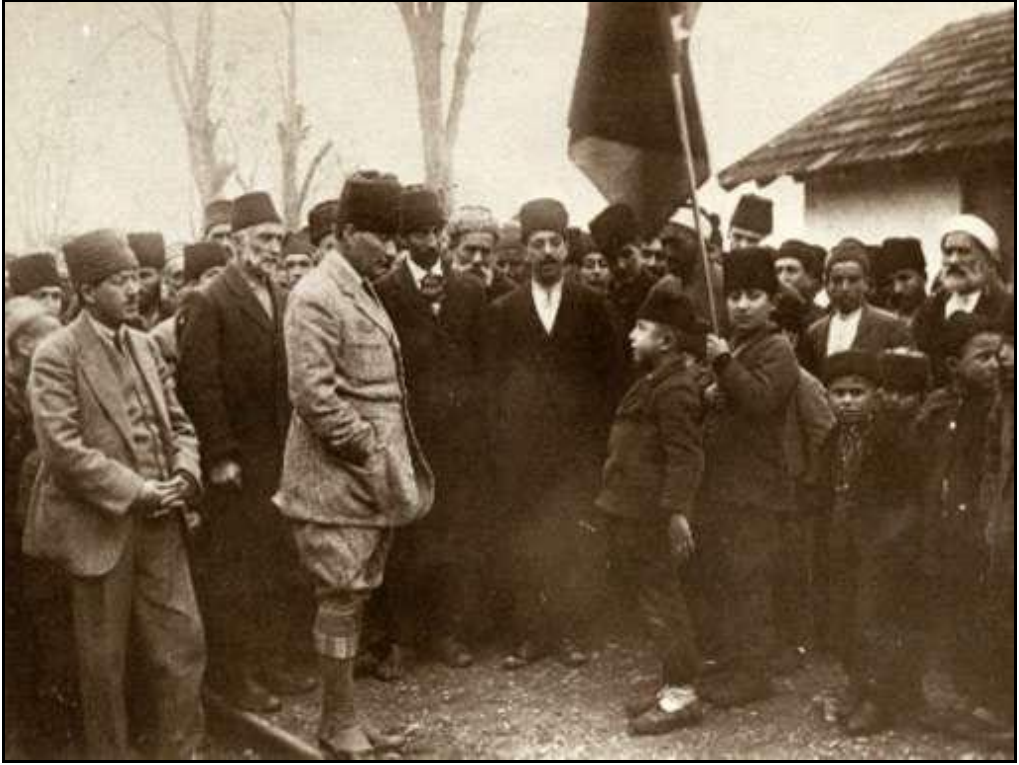
TBMM Başkanı Gazi Mustafa Kemal, Bilecik Osmaneli İstasyonu'nda bir öğrencinin okuduğu şiiri dinlerken (20 Ocak 1923)