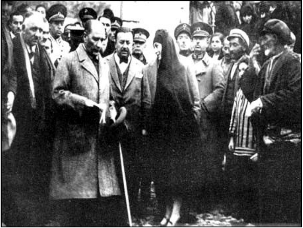
Amasya'da halkın ve bir kadının derdini dinlerken. (22 Kasım 1930)