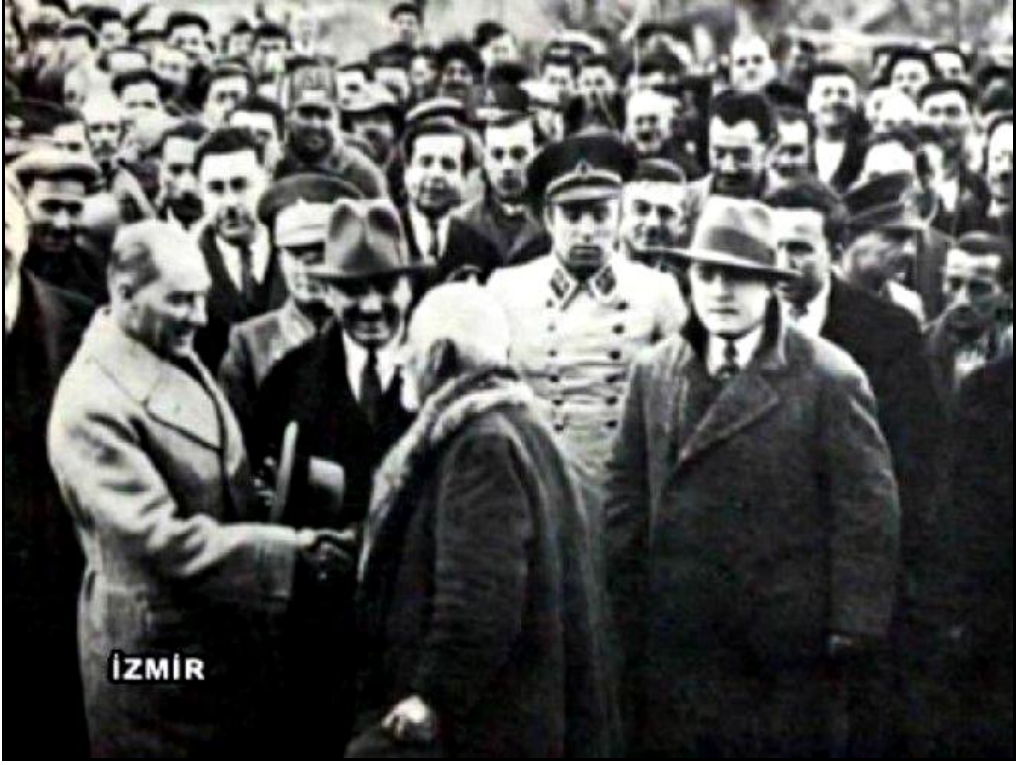
Atatürk, İzmir’de kendisini karşılamaya gelen halkla sohbet ederken.(1931)