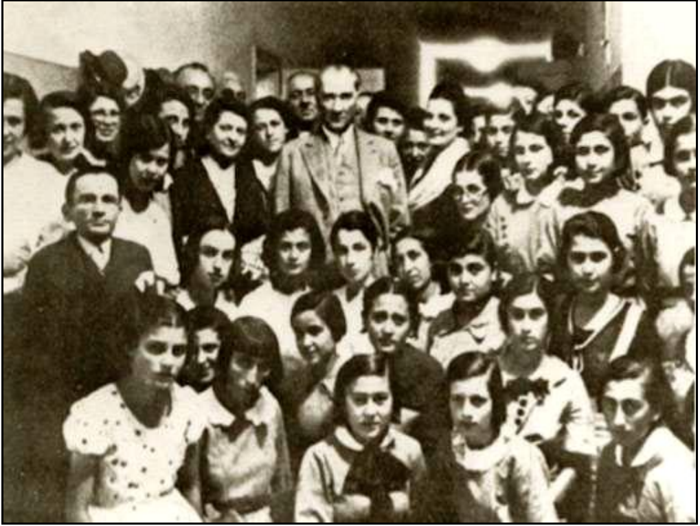
Cumhurbaşkanı Gazi Mustafa Kemal, Ankara İsmet Paşa Kız Enstitüsünde Öğretmen ve Öğrencilerle (27 Haziran 1933)