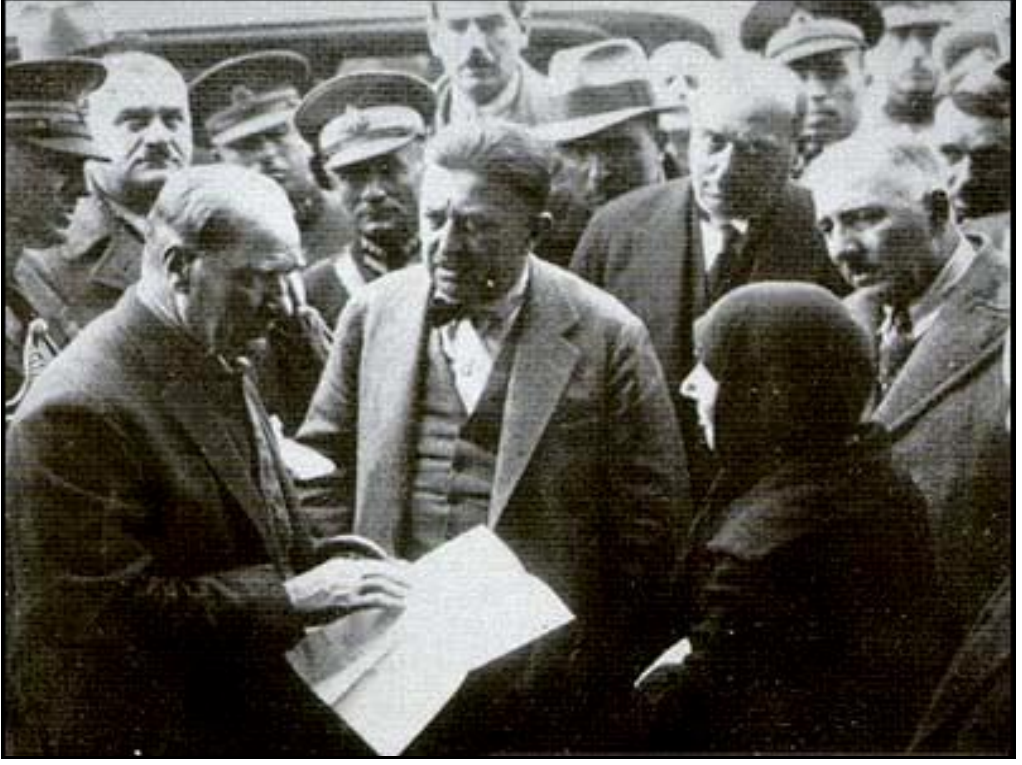
Kayseri'de bir kadının sorunlarıyla ilgilenirken ( Kasım 1930 )