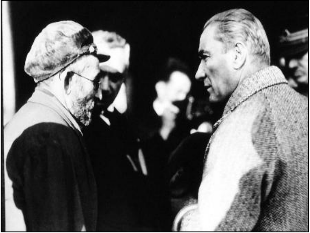
Atatürk, Yurt Gezisi'nde yaşlı bir vatandaşla konuşurken ( Kasım 1930 )