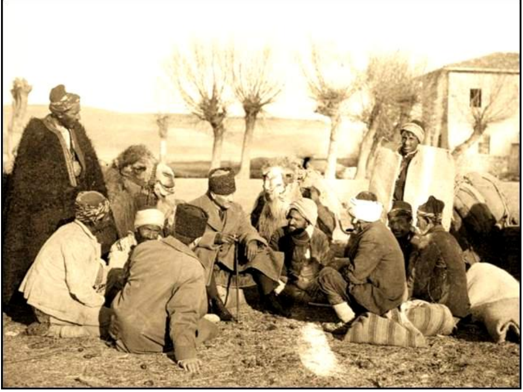
Mustafa Kemal cepheye erzak taşıyan köylülerle sohbet ederken. (6 Nisan 1921)