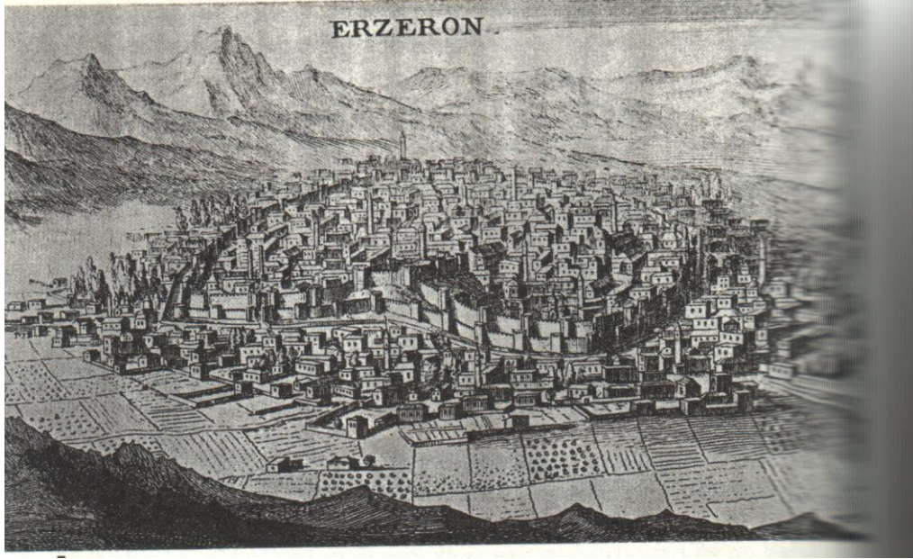
18. Yüzyılın Başlarında Erzurum Şehri (Kaynak: Joseph de Tournefort, Tournefort Seyahatnamesi , (Editör: Stefanos Yerasimos, Çeviren: Teoman Tunçdoğan), 2. Cilt, 2. Baskı, İstanbul, Ocak 2008, s. 148.